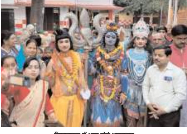
शिववारात में भाग लेते भक्तगण