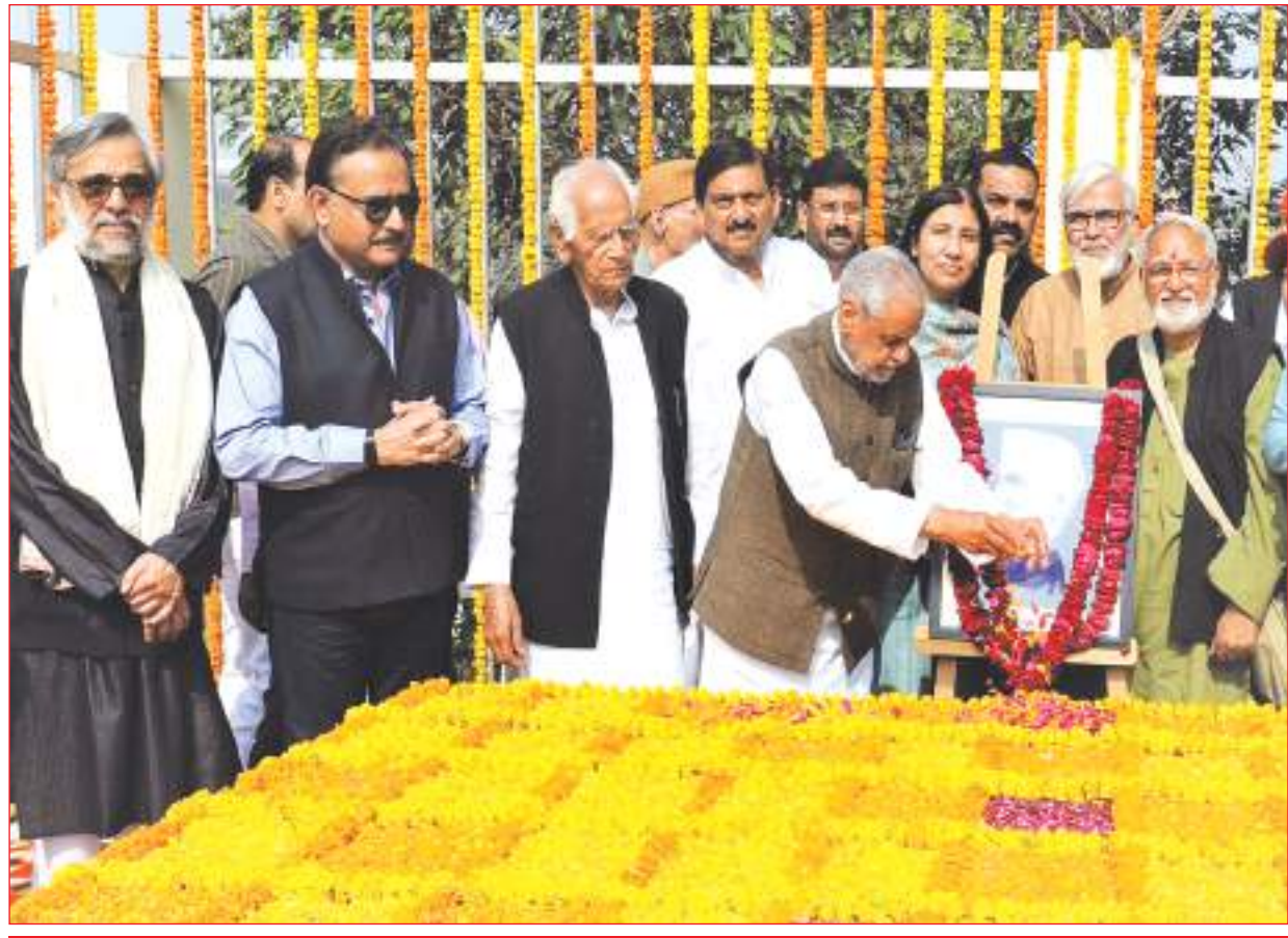
समाजवादी पार्टी के राष्ट्रीय अध्यक्ष, पूर्व मुख्यमंत्री एवं नेता विरोधी दल अखिलेश यादव की ओर से समाजवादी पार्टी के राष्ट्रीय संघटन एवं पूर्व कैबिनेट मंत्री राजेंद्र चौधरी ने आज मंसून समाजवादी नेता एवं विचारक आचार्य नरेन्द्र देव जी की 67वीं पुण्यतिथि पर लखनऊ में गोमती तट स्थित उनकी समाधि पर पुष्प अर्पित कर श्रद्धांजलि दी। समृद्धि न्यूज़

10 मार्च तक कि विधानसभा सत्र के चलाया जाएगा। वह बहुत ही कम है। इस तरीके से सत्य की कार्यवाही में पिछली बार भी हम लोगों की बात सामने नहीं रखी गई। और इस बार भी महिलाओं दलित वंचित और सामाजिक मुद्दों को ध्यान नहीं दिया जा रहा है। विधायक दल की बैठक से पहले रामचरितमानस और जाति जनगणना को लेकर लगाए गए बैनर पोस्टर समाजवादी पार्टी से पहले हटा दिए गए। एक तरफ समाजवादी पार्टी के विधायक दल की बैठक होने जा रही थी उससे पहले सभी होल्डिंग ऑ को हटा दिया गया। सपा के विधायक रविदास मल्होत्रा का कहना है कि जाति जनगणना को लेकर जो भी समाजवादी पार्टी कार्यालय के बाहर बैनर लगाई गई थी वह भाजपा सरकार के द्वारा हटा दी गई।