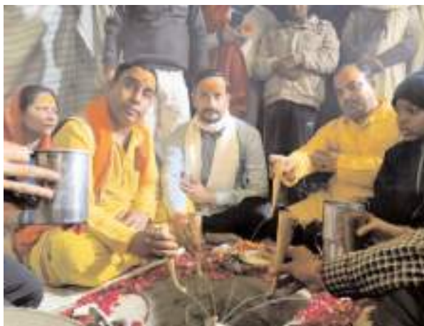
गंगा तट पर रुद्राभिषेक करते भक्तगण