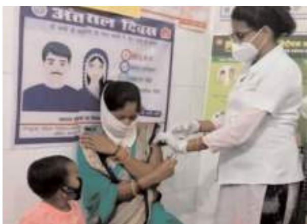
महिला को टीका लगाती एएनएम

फर्रुखाबाद, समृद्धि न्यूज। नवीन गर्भनिरोधक साधनों में महिलाओं की पहली पसंद बना नैमासिक गर्भनिरोधक इंजेक्शन अंतरा। जहां बच्चों के जन्म में अंतर रखने में बेहद कारगर व सुरक्षित है, वहीं गर्भाशय, अंडाशय व रक्तन के