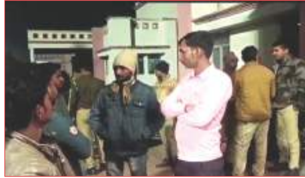
मृतक का फाइल फोटो व घटनास्थल पर मौजूद लोग

जिससे परिजनों को चिंता हुई। परिजनों ने रात में ही उसकी खोजबीन शुरू कर दी। काफी खोजबीन के बाद भी जब उसका कहीं पता नहीं चला। परिजन उसकी खोजबीन करते हुए शनिवार की रात्रि करीब 1 बजे तिवां के दौलेधर धाम रात्रि पर वह मेला देखने तिवां के शिव मंदिर गया था, लेकिन वह देर रात तक अपने घर नहीं लौटा,