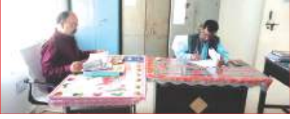
बैठक में उपस्थित अधिकारी

ही आवश्यक निर्देश दिए गए। निर्देशित किया गया कि स्ट्रॉग रूम एवं डबल लॉक आलमारी को खोलने एवं बन्द करने के समय को एवं अन्य आवश्यक विवरणों को अंकित करने हेतु एक लॉग बुक रजिस्टर तैयार किया जाएगा। जिसमें केन्द्र व्यवस्थापक, स्टेटिक मजिस्ट्रेट एवं वाह्य केन्द्र व्यवस्थापक द्वारा हस्ताक्षर किये जाएंगे तथा स्ट्रॉग रूम में प्रश्न पत्रों के रखरखाव हेतु डबल लॉक युक्त आलमारी के एक ताले की चाबी