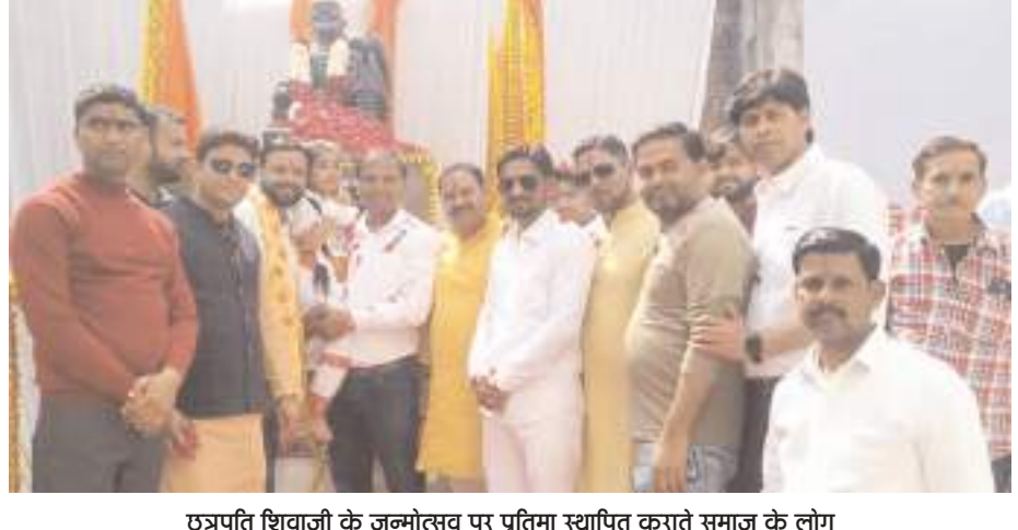
छत्रपति शिवाजी के जन्मोत्सव पर प्रतिमा स्थापित कराते समाज के लोग

फर्रुखाबाद, समृद्धि न्यूज। रविवार को नेकपुर चौरासी स्थित शिवाजी संस्थान में 393 जन्मोत्सव के उपलक्ष्य में सरदार पटेल युवा मंच के संस्थापक पदाधिकारियों द्वारा मूर्ति अनावरण कार्यक्रम का आयोजन किया गया। साथ ही लोगों ने शोभायात्रा निकाल प्रतिमास्थल पर पहुंचे। सरदार पटेल युवा मंच के द्वारा प्रतिमा स्थापित व हवन पूजन कार्यक्रम सम्पन्न हुआ। समाज के लोगों ने हवन पूजन में बढ़-चढ़कर भाग लेते हुए आहूतियां दीं और शिवाजी को याद किया। सभी लोगों के मन में एक ही पीड़ा थी कि 20 वर्ष बीत गये, उसके बावजूद भी संस्थान में अभी तक दीवारें खड़ी हैं लेंटर तक नहीं पड़ा। अगर सभी एक जुट हो जायें, तो संस्थान को छत