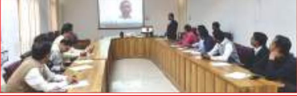
प्रशिक्षण कार्यशाला में मौजूद न्यायालयों के कर्मचारी