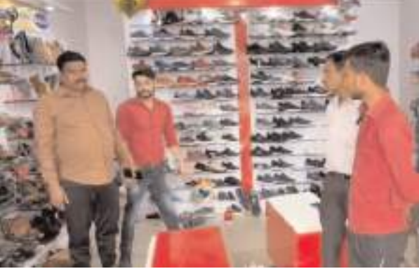
दुकान में हुई तोड़फोड़ के बारे में जानकारी देते कर्मचारी