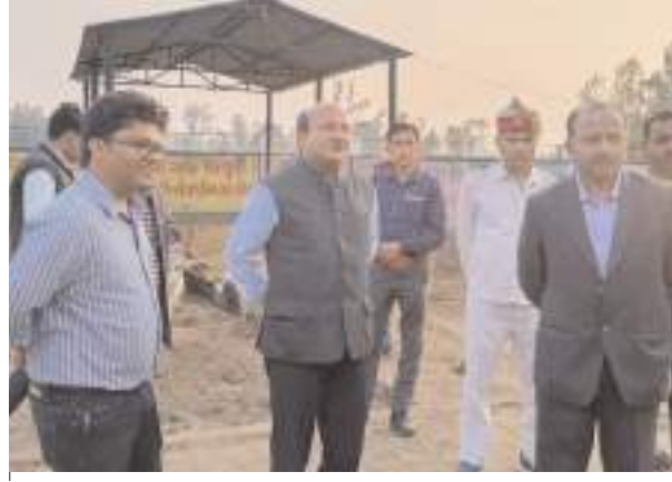
गौशाला का निरीक्षण करते जिलाधिकारी

शमसाबाद, समृद्धि न्यूज। जिलाधिकारी ने कान्हा गौशाला का निरीक्षण किया। इस दौरान उन्होंने दाना, भूसा की गुणवत्ता देखी और चरागाह बनवाने के निर्देश दिये।