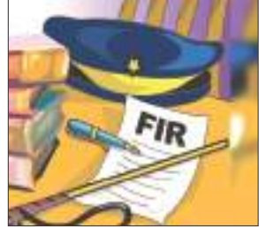
गुरसहायगंज, समृद्धि न्यूज़।

एक नाबालिग किशोरी को युवक अपने परिजनों के सहयोग से कहीं बहला-फुसलाकर भगा ले गया। किशोरी की मां ने कोतवाली पुलिस को तहरीर देकर कार्रवाई की मांग की है।