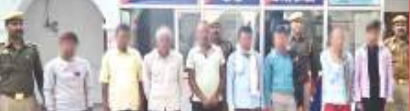
पुलिस अभिरक्षा में आरोपी

कोतवाली क्षेत्र के दो अलग-अलग ग्रामों में भूमि व डीजे बजाने के विवाद को लेकर लोगों में गाली गलौज के