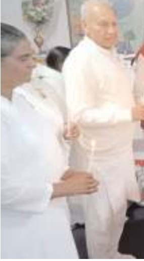
बीबीगंज सर्वलाइट केन्द्र पर केक काटकर मोमबत्ती जलाकर महाशिवरात्रि मनाते अतिथिगण