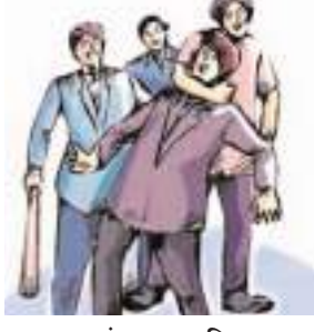
कायमगंज, समृद्धि न्यूज।

बाइक सवार ने लापरवाही से चलाते हुए बाइक सवार को टक्कर मार दी। जिससे वह गम्भीर रूप से घायल हो गया। पुलिस ने तहरीर के आधार पर मुकदमा दर्ज कर लिया है।