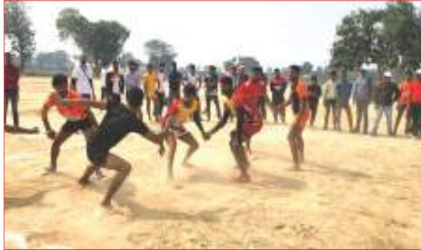
सांसद खेल स्पर्धा में प्रतिभाग करते हुए खिलाड़ी

शहर के बोर्डिंग मैदान में चल रही है सांसद खेल स्पर्धा