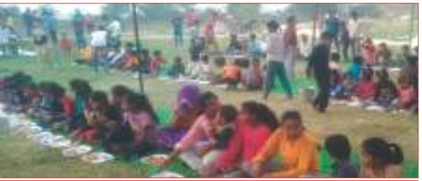
भंडारे में प्रसाद ग्रहण करते श्रद्धालुगण