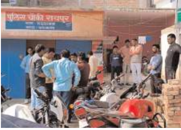
चौकी में मौजूद दोनों पक्षों के लोग

फर्रुखाबाद, समृद्धि न्यूज। तेज रफ्तार से आ रहे ट्रेक्टर ने कार में टक्कर मार दी। जिससे कार सवार युवक गंभीर रूप से घायल हो गया व कार क्षतिग्रस्त हो गई। आसपास के नागरिकों ने ट्रेक्टर चालक को पकड़ लिया।