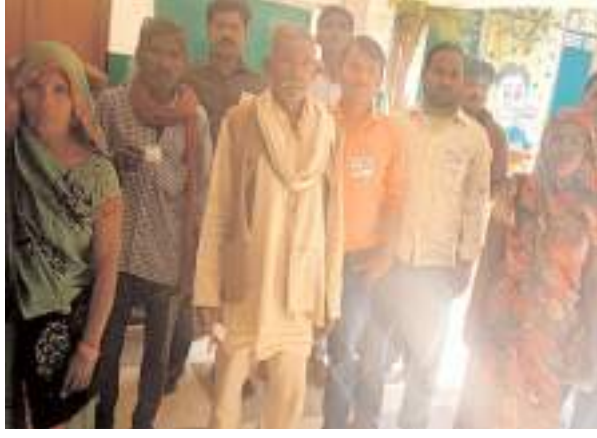
वोट डालने के बाद जानकारी देते मतदाता

कपिल, समृद्धि न्यूज़। ग्राम प्रधान की आकस्मिक मृत्यु के बाद खाली हुई सीट पर हुए उप चुनाव में तीन प्रत्याशियों का भाग्य मतपेटियों में कैद हो गया। तीन बूथों पर 1384 मतदाताओं ने अपने मताधिकार का