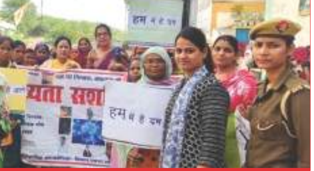
प्रभात फेरी निकालती महिलाएं समृद्धि न्यूज

कन्नौज, समृद्धि न्यूज। भारत सरकार के निर्देशन में अन्तर्राष्ट्रीय महिला दिवस के तहत सप्ताह भर विभिन्न कार्यक्रमों का आयोजन कराए जाने के निर्देश दिए गए हैं। इसके तहत शहर के काशीराम कॉलोनी में महिला कल्याण विभाग एवं दिव्यता सशक्तिकरण के द्वारा 'हम में है दम- कार्यक्रम का आयोजन कर प्रभात फेरी निकाली गई। कार्यक्रम में महिलाओं ने चढ़ बढ़ कर हिस्सा लिया।