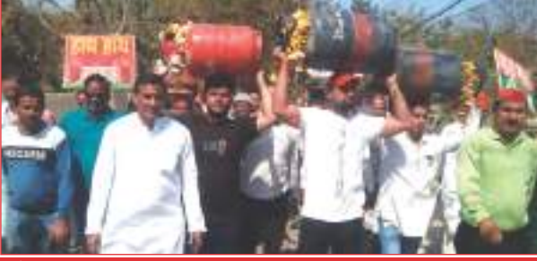
गैस सिलेण्डरों की अर्थी निकालते व कलेक्ट्रेट में प्रदर्शन करते सपाईय

सपाईयों ने गैस सिलेण्डरों को फूलमाला पहनाकर निकाली अर्थी, जुलूस की शक्ल में पहुंचे कलेक्ट्रेट किया प्रदर्शन