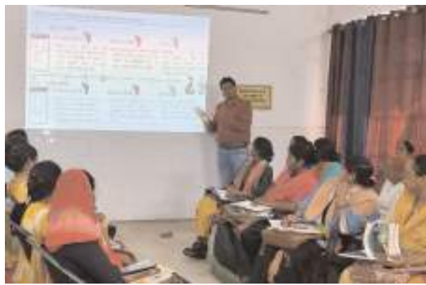
प्रशिक्षण के दौरान मौजूद एएनएम

फर्रुखाबाद, समृद्धि न्यूज। गर्भपात के बाद होने वाली मातृ मृत्यु को रोकने के लिए सीएचसी कायमगंज, मोहल्लबाद, कमालगंज, नवाबगंज और बरौन में बुधवार को एएनएम को प्रशिक्षण दिया गया। दौरान उत्तर प्रदेश तकनीकी सहयोग इकाई से जिला परिवार नियोजन विशेषज्ञ द्वारा तकनीकी सहयोग दिया गया।