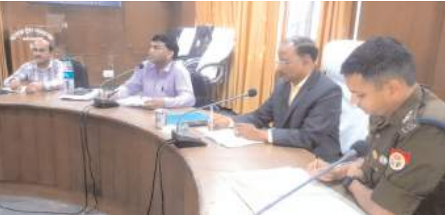
शांति कमेट्री की बैठक लेते जिलाधिकारी व पुलिस अधीक्षक