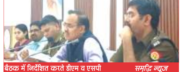
बैठक में निर्देशित करते डीएम व एसपी समृद्धि न्यूज

त्यौहारों में अराजकता फैलाने वालों पर होगी कड़ी कार्रवाई