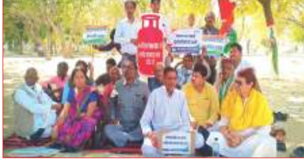
प्रदर्शन करते कांग्रेसी

राष्ट्रपति को सम्बोधित ज्ञापन अतिरिक्त जिला मजिस्ट्रेट को सौंपा