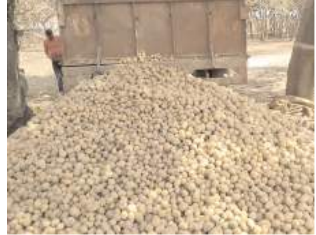
सातनपुर मंडी में लगा आलू का ढेर