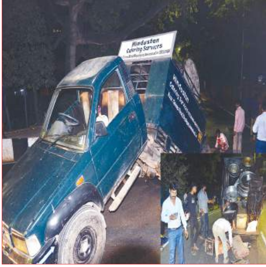
गोमती एल के पास टेस्ट रात डाले की वीडियो टूटने से विख्यात सामान

ने गुरुवार को वीडियो टवीट कर गंगा की सफाई को लेकर सवाल पूछा। उन्होंने कैंपन लिखा, 'शुद्ध पानी को प्यासी, कैसी हो गयी ये काशी'। वीडियो वाराणसी के तुलसी घाट के आसपास का है। इसमें घाट किनारे गंगा का काला पानी और गंदगी दिख रहा है। उनके इस टवीट पर मिलीजुली प्रतिक्रिया देखने को मिली। किसी यूजर ने गंगा में गंदगी पर दुख जताया तो किसी यूजर ने सपा प्रमुख को अपने शासन काल की याद दिलाई। अखिलेश यादव इससे पहले भी कई मौके पर गंगा की सफाई को लेकर सवाल पूछे हैं। पिछले वाराणसी दौरे में भी उन्होंने बातचीत में मीडिया से कहा था कि नमामि गंगा से पूछिए, गंगा साफ हो गई क्या? गंगा सफाई को लेकर के कितना पैसा पानी की तरह बह गया।