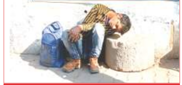
नगर के तिराहे पर पड़ा जहरखुरानी का शिकार युवक समृद्धि न्यूज

गुरुसहायगंज, समृद्धि न्यूज। निशाना बने युवक को रोडवेज परिचालक ने मानवता की हदें पार कर बस से धक्का देकर स्थानीय तिराहे पर नीचे गिरा दिया और चलाता बने। जब युवक काफी समय तक अपनी जगह से हिला डुला नहीं। तो नागरिकों ने डायल 112 सहित कोतवाली पुलिस को सूचना दी। जिस पर मौके पर पहुंची पुलिस ने बेहोशी की हालत में युवक को इलाज के लिए भर्ती कराया है।