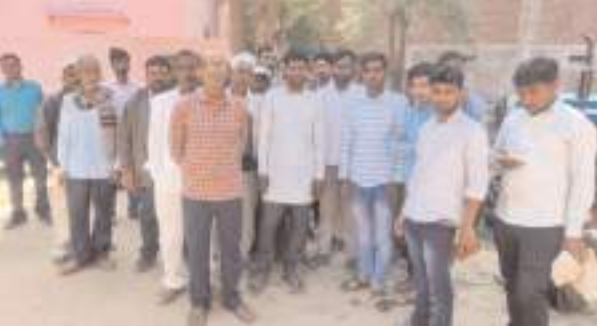
पोस्टमार्टम हाउस में मौजूद परिजन व मृतक का फाइल फोटो

फर्रुखाबाद, समृद्धि न्यूज़। ट्रेक्टर पर आलू लादकर जा रहे किसान का पैर पहिये में फंसने की उसकी मौके पर ही दर्दनाक मौत हो गई। जानकारी होने पर परिजनों में कोहराम मच गया। सूचना पर पहुंची पुलिस ने जांच पड़ताल कर शव का पंचनामा भरकर पोस्टमार्टम के लिए भेज दिया।