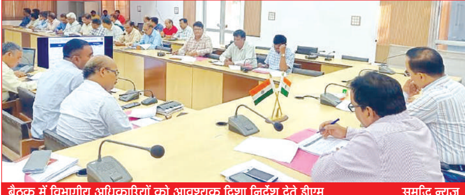
बैठक में विभागीय अधिकारियों को आवश्यक दिशा निर्देश देते डीएम

▶ कलेक्ट्रेट स्थित गांधी सभागार में जिला शिक्षा एवं अनुश्रवण समिति की बैठक में डीएम ने बीएसए को दिए शिक्षा में सुधार लाए जाने के निर्देश ▶ डीएम ने कहा: 19 पैरामीटर के अंतर्गत सभी विद्यालयों में कार्य पूर्ण हो जाना चाहिए