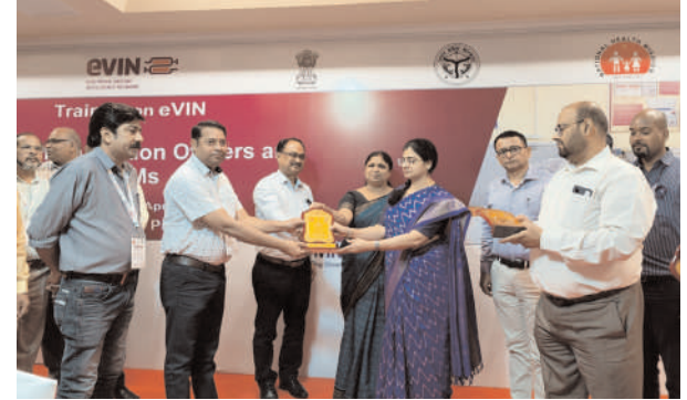
सम्मानित होते जिला प्रतिरक्षण अधिकारी व कोल्ड चेन मैनेजर

लखनऊ में इलेक्ट्रॉनिक वैक्सीन इंटेलिजेंस नेटवर्क की कार्यशाला सम्पन्न