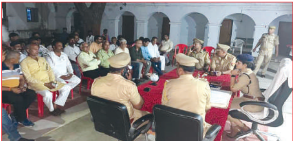
पिस कमेटे में मौजूद पुलिस के अधिकारीगण व कमेटे के सदस्य