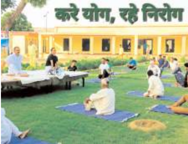
जेल में योग का अभ्यास करते बंदी

योग दिवस को सफल बनाने के लिए जोर शोर से चल रही तैयारी