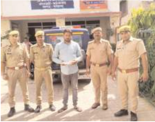
पुलिस मुठभेड़ में पकड़ा गया आरोपी