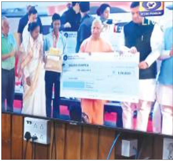
महोबा। समृद्धि न्यूज़

वर्ष 2023 की हाईस्कूल एवं इंटरमीडिएट समकक्ष परीक्षा उत्तीर्ण राज्य स्तर पर प्रथम 05 स्थान प्राप्त करने वाले मेधावी विद्यार्थियों को लोक भवन लखनऊ के सभागार में आयोजित सम्मान समारोह में मुख्यमंत्री उत्तर प्रदेश सरकार द्वारा एक