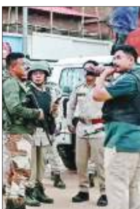
हजारों हथियार बरामद