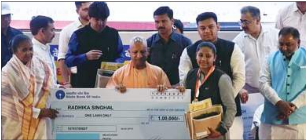
अपने पुरुषार्थ से सफलता की मंजिल को चूमना ही वास्तविक सफलता

मुख्यमंत्री योगी ने कहा कि 6 वर्ष पहले प्रदेश बोर्ड परीक्षाओं में नकल के कारण बदनाम था। पूरा साल परीक्षा में ही निकलता था। सरकार बनते ही मैंने लक्ष्य दिया कि 1 माह में परीक्षा और परिणाम दोनों आए। 15 दिन के भीतर परीक्षा हुई और 14 दिन के भीतर परिणाम घोषित किया गया। पारदर्शिता से परीक्षा कराई गई सामान्य प्रश्न पत्र बनाया गया और सामुदायिक नकल पर छात्रों की बजाय प्रबंधकों अधिकारियों पर कार्रवाई की गई। एक डीआईओएस को जेल में डालना पड़ा। उन्होंने कहा कि नकल