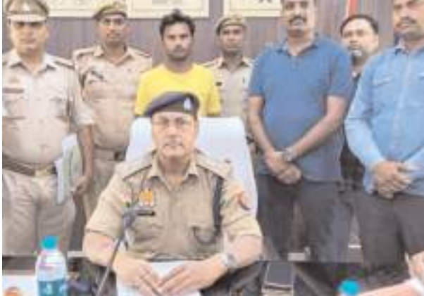
पुलिस हिरासत में हत्यारोपी

सोमवार को मक्का के खेत में पड़ी मिली थी युवती की लाश