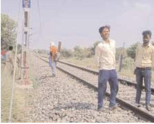
घटनास्थल पर जांच करती पुलिस व मौजूद लोग

► पुलिस के काफी प्रयास के बाद भी नहीं हो सकी महिला की शिनाख्त ► पुलिस ने शव को मर्चरी में रखवा दिया