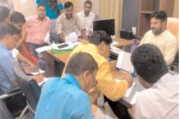
सचिवों की बैठक लेते बीडीओ

नवाबगंज, समृद्धि न्यूज। विकास खंड अधिकारी ने सचिवों के साथ बैठक कर सरकार द्वारा चलाई जा रही योजनाओं के विकास कार्यों की समीक्षा की। विकास खंड