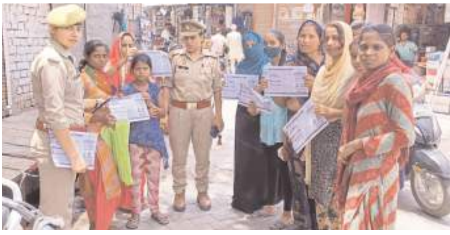
महिलाओं व युवतियों को जागरूक करती महिला सुरक्षा दल की टीम