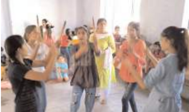
कार्यशाला में डाडिया सीवती छात्रावर्ग