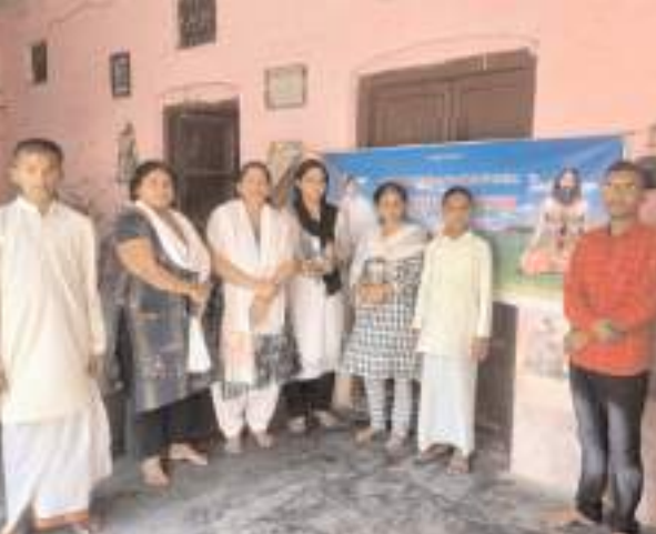
पतंजलि महिला योग समिति की टीम