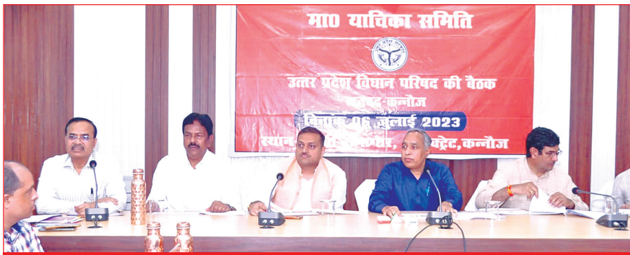
कन्नौज-प्रकरणों की समीक्षा करते समिति के सदस्यगण समृद्धि न्यूज

निश्चित रूप से बननी चाहिए। समय-समय पर सड़क की पटरियों की साफ-सफाई मनरेगा के माध्यम से कराई जाये। सुझाव दिया की ग्राम व शहर की नालियों पर पथर रखवाया जाये। जिससे नालिया चोक न हो और नालियों के अंदर कूड़ा कबाड़ा न भरने पाये। इस दौरान समिति द्वारा विकासखंड कन्नौज के अंतर्गत ग्राम अहमदपुर रौनी में सड़क का निर्माण कराए जाने की जानकारी ली जिसमें, अपर मुख्य अधिकारी जिला पंचायत द्वारा बताया गया कि ग्राम अहमदपुर रौनी में सीसी रोड का निर्माण कार्य मजरा से नसीम के घर तक जिला पंचायत द्वारा वर्ष 2015-16 में कराया गया था। वर्तमान में इस रोड पर पेयजल पाइप लाइन हेतु खुदाई का कार्य चल रहा है। सभापति ने निर्देश दिए कि पाइप लाइन का कार्य समाप्त होने के उपरांत सड़क की मरम्मत का कार्य कराया जाना सुनिश्चित किया जाए। इसी प्रकार