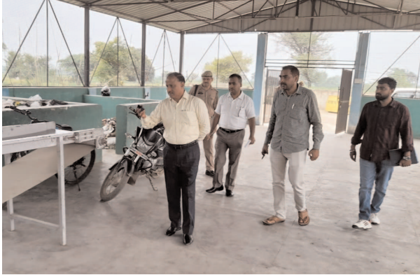
कूड़ा निस्तारण केंद्र का निरीक्षण करते डीएम

फर्रुखाबाद, समृद्धि न्यूज़। जिलाधिकारी संजय कुमार सिंह ने नगर पालिका के कूड़ा निस्तारण केन्द्र/एम0आर0एफ0 सेन्टर का औचक निरीक्षण किया। निरीक्षण के दौरान देखा गया कि कूड़ा निस्तारण केन्द्र के मार्ग पर 03 किलोमीटर पूर्व से ही गन्दगी है और बड़ी-बड़ी झाड़ियां हैं। कूड़ा निस्तारण केन्द्र के आस-पास कीटनाशक दवा का छिड़काव नहीं किया जा रहा है। जिलाधिकारी ने मार्ग की साफ-सफाई मार्ग एवं आसपास परिया में कीटनाशक दवा का छिड़काव, पूरे परिया को सी0सी0टी0वी0 केमरे से