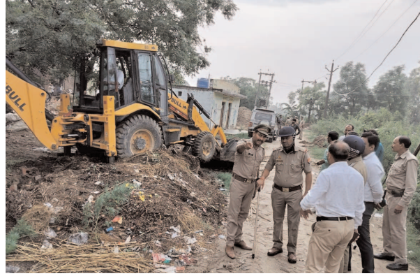
मौके पर अतिक्रमण हटवाते एसडीएम व सीओ