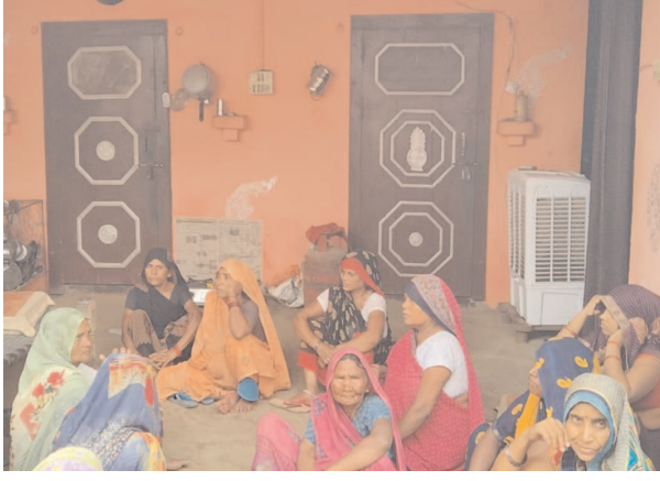
गुमथुम बैठे मृतका के परिजन

अमृतपुर, समृद्धि न्यूज़। संदिग्ध परिस्थितियों में नवविवाहिता को खून की उल्टी होते ही हालत बिगड़ गयी। जिसे ससुरालीजन उपचार के लिए अस्पताल ले गये। जहां उपचार के दौरान उसकी मौत हो गयी। इस घटना की जानकारी जैसे ही परिजनों को हुई, तो कोहराम मच गया। वहीं मृतका के पिता ने ससुरालीजनों पर पुत्री की हत्या कर देने का आरोप लगाते हुए कार्यवाही करने की मांग की है।