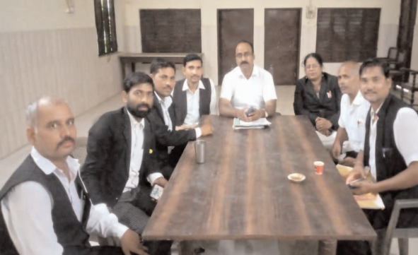
बैठक के दौरान मौजूद अधिवक्तागण

फर्रुखाबाद, समृद्धि न्यूज़। गुरुवार को अपराष्ट्र जिला बार एसोसिएशन फतेहगढ़ के प्रांगण में कार्यकारिणी की बैठक आयोजित की गई। पूर्व में हुई बैठक में जो एलडर्स कमेटी बनाई गई थी उसमें एलडर्स