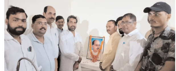
डॉ0 श्यामा प्रसाद मुखर्जी के चित्र पर माल्यार्पण करते भाजपा नेता