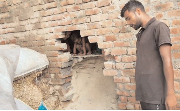
चोरों द्वारा लगाये गये नकब को दिवाता युवक