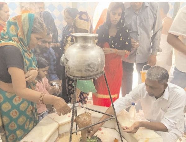
भगवान भोलेनाथ की पूजा अर्चना करते भक्तगण

कारव वाले स्वामी जी के मूर्ति स्थल पर भी भारी भीड़ रही। कपिलमुनि, कालेश्वरनाथ समेत अन्य मंदिरों में भी अलसुबह से ही पूजन-अर्चना का दौर शुरू हो गया था। भगवान भोलेनाथ के जयकारे से वातावरण शिवमय हो गया। सभी ने शिव को प्रसन करने के लिए उन्हें अत्यंत प्रिय भांग, धतूरा