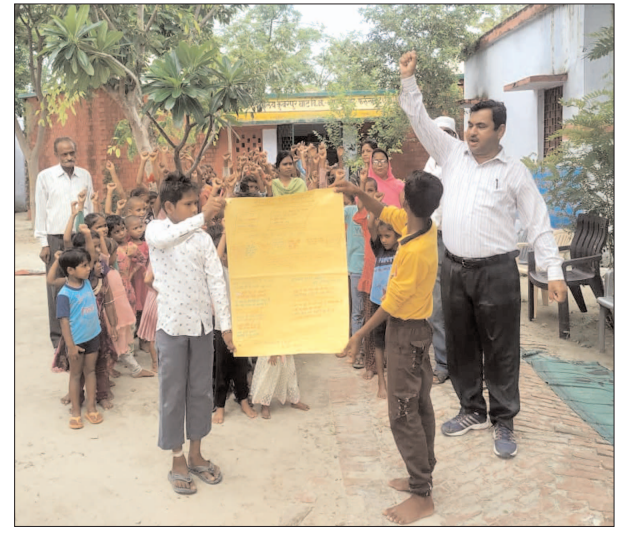
संचारी रोग नियंत्रण जागरुकता रैली में भाग लेते बच्चे