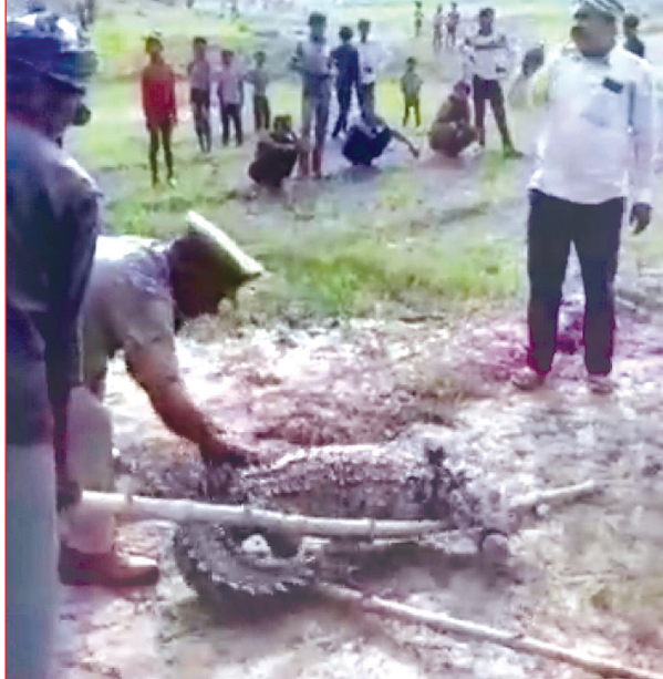
मगरमच्छ को रस्सी से बांधकर दूसरी ओर ले जाते लोग

भोर होते ही महादेवी गंगा घाट पहुंच गए थे। श्रद्धालुजनों समेत गंगा घाट स्थित आश्रम में रहने वाले साधु-सन्त भी गंगा में स्नान कर रहे थे कि तभी उन्हें एक विशालकाय मगरमच्छ गंगा तट पर दिखाई दिया, जिससे वहां अफरा-तफरी मच गई। चीख पुकार और शोरगुल सुनकर आसपास मौजूद