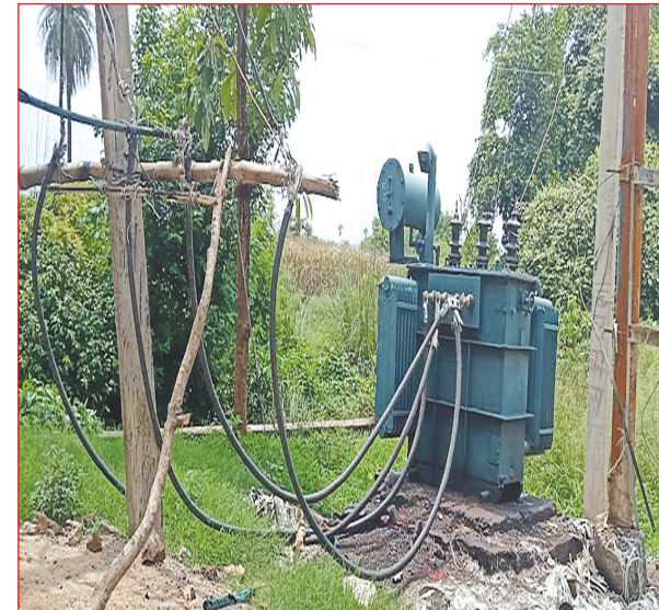
समधन पश्चिमी स्वागत द्वार गेट के पास खुले में रखा ट्रांसफार्मर व टाकुरद्वारा के निकट झूलती जर्जर बिजली केबिल