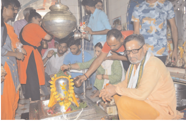
पंडाबाग मंदिर में पूजा अर्चना करते भक्तगण

फर्रुखाबाद, समृद्धि न्यूज। सावन के प्रथम सोमवार पर नगर के शिवालयों में भक्तों ने पहुंचकर विधि विधान से भगवान भोलेनाथ की पूजा अर्चना की और उनको वेलपत्र, धतूरा, भांग आदि अर्पण किये। वहीं कई भक्तों ने गंगा स्नान कर वहां से लाये गये जल से भगवान भोलेनाथ का जलाभिषेक किया। मंदिरों में पूरे