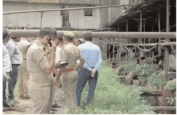
घटनास्थल पर जांच पड़ताल करती पुलिस

जानकारी के अनुसार कोतवाली क्षेत्र स्थित चीनी मिल में सोमवार को एक अज्ञात युवक का शव पड़ा उस समय मिला जब चीनी मिल में सफाई का कार्य चल रहा था। चीनी मिल के पीछे जब कर्मचारी गये तो हौद में एक युवक का शव पड़ा देख सूचना अपने अधिकारियों को दी। मौके पर तमाम लोगों की भीड़ लगा गई। सूचना पुलिस को दी गई। मौके पर क्षेत्राधिकारी