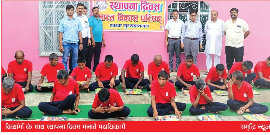
दिव्यांगों के साथ स्थापना दिवस मनाते पदाधिकारी