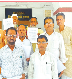
वक्फ सम्पत्ति बचाओ संघर्ष समिति के बैनर तले मुस्लिम समाज के लोगों ने शहर में वक्फ माफिया के विरुद्ध कार्यवाही कर वक्फ सम्पत्तियों को बचाने के लिए जिलाधिकारी के माध्यम से मुख्यमंत्री को ज्ञापन भेजा। ज्ञापन में कहा गया है कि वक्फ माफिया वक्फ सम्पत्तियों को फर्जी मुकदमे करके कागजातों में हेराफेरी करकर फर्जी जमींदारों के बानामा करकर हड़पने के बाद भू माफियाओं से सांठांठ कर बेच देता है। वक्फ नम्बर 119 कब्रिस्तान जो शहर में स्टेशन रोड पर स्थित है, जब उक्त माफिया इस कब्रिस्तान का अध्यक्ष था तब उसने भू माफियाओं से मिलकर कब्रिस्तान के आगे वाली भूमि को बेच कर कब्रिस्तान की कीमती भूमि को खुरदबुर कर दिया।