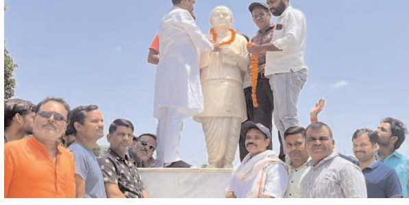
पटेल प्रतिमा की सफाई करते भाजपाई