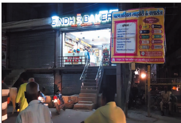
मॉल संचालक की पार्किंग गोडा लखनऊ मुख मार्ग है। ऐसे में ग्राहक

रहा है। सूत्रों के द्वारा बताया जा रहा है कि गुड्डू माल चौराहे के सामने सिंध बेकर्स का बड़ा शॉपिंग कॉम्प्लेक्स खुला है। इसकी पार्किंग बेसमेंट में है परंतु भवन स्वामी पार्किंग स्थल को दुकान के रूप में प्रयोग कर रहे हैं। सिंध बेकर्स की दुकान में आने वाले ग्राहक अपने वाहन सड़क पर खड़ा कर रहे हैं। इससे वाहनों की असुरक्षित है। इतना ही नहीं अव्यवस्था भी बनी है। वहीं गोडा लखनऊ रोड गुरु नानक चौराहे के समीप निजी बैंक व वी 2 माल संचालित है। लेकिन पार्किंग की कोई व्यवस्था नहीं है।