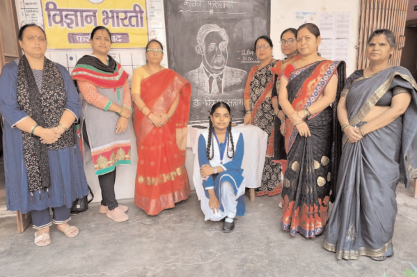
विक्रम साराभाई की जयंती मनाती शिक्षिकाएँ