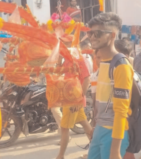
गोला गोकर्णनाथ रवाना होते कांवरिए