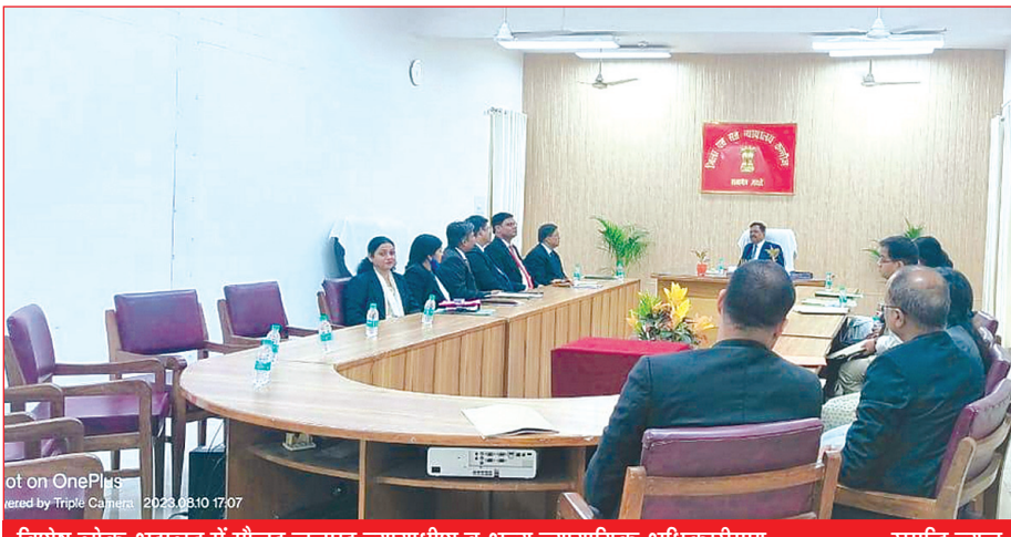
विशेष लोक अदालत में मौजूद जनपद न्यायाधीश व अन्य न्यायाधिकारिक अधिकारीगण समृद्धि न्यूज

▶ 391 संदर्भित वादों में सुलह समझौते के आधार पर 102 वाद हुए निस्तारित ▶ जिला विधिक सेवा प्राधिकरण के तत्वाधान में आयोजित हुई विशेष लोक अदालत