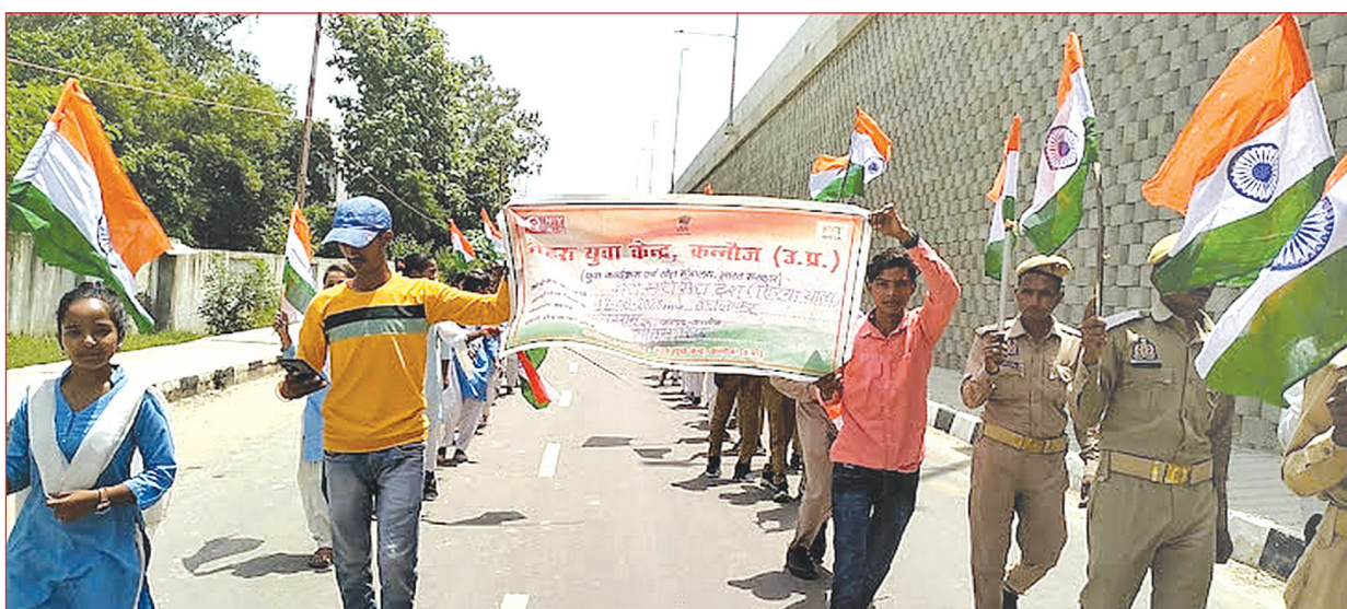
तिरंगा शोभा यात्रा निकालते राष्ट्रीय युवा स्वयंसेवक समृद्धि न्यूज