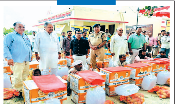
बाढ़ पीड़ितों को मिला बाढ़ राहत सामग्री