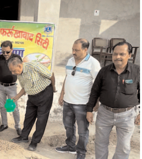
वृक्षारोपण करते लायंस क्लब के सदस्य