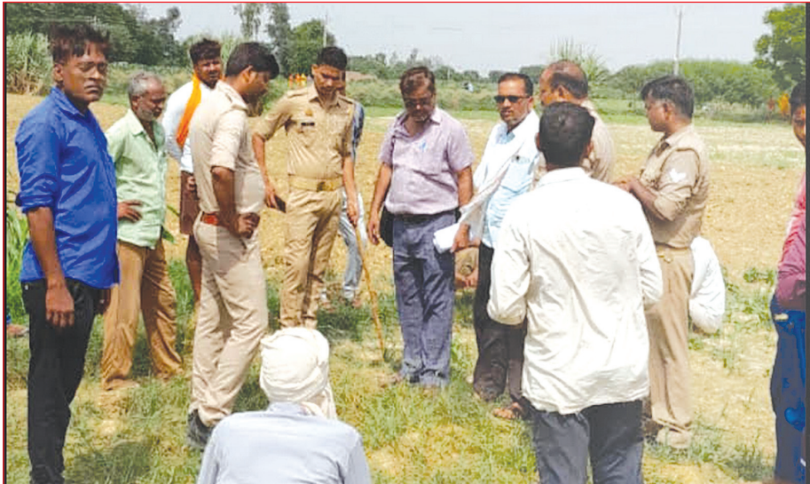
मौके पर पहुंची राजस्व व पुलिस टीम शिकायत का निस्तारण कराती समृद्धि न्यूज

प्राप्त हुई जिसमें में मौके पर 06 शिकायतों का निस्तारण किया गया। फरियादियों की शिकायतों को सुनते हुए जिलाधिकारी ने सम्बन्धित अधिकारियों को निर्देशित करते हुए कहा कि प्राप्त प्रार्थना पत्रों का निस्तारण गुणवत्तापूर्ण ढंग से किया जाये। उन्होंने कहा कि निस्तारण की गुणवत्ता शासन स्तर से भी सीधे