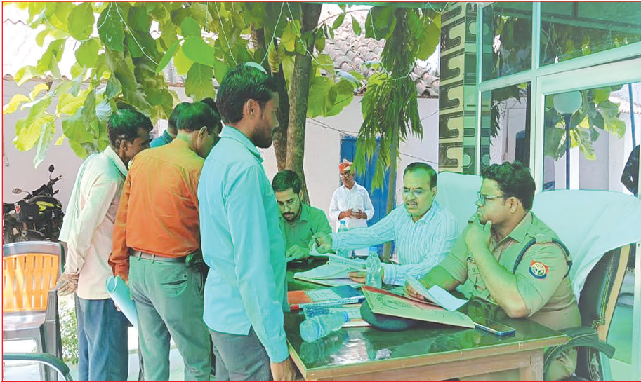
थाना इन्दरगढ़ में फरियादियों की शिकायतों को सुनते डीएम व एसपी समृद्धि न्यूज

▶ थाना समाधान दिवस में प्राप्त शिकायतों के मौके पर निस्तारण हेतु डीएम ने राजस्व व पुलिस की संयुक्त 37 टीमों का कारावा गठन ▶ जिले भर के थानों में आयोजित थाना समाधान दिवस में प्राप्त 55 शिकायतों का गठित की गई टीमों ने मौके पर जाकर कारावा निस्तारण