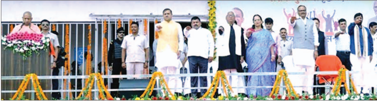
अन्तरराष्ट्रीय युवा दिवस के अवसर पर यहाँ 'नशा मुक्त प्रदेश अभियान का शुभारंभ करने के बाद मुख्यमंत्री योगी आदित्यनाथ ने उपस्थित युवाओं को नशा मुक्ति की शपथ दिलायी

► मेरा बेटा नशा करता था, मैं नहीं बचा पाया ► सांसद कौशल किशोर बोले, रक्षाबंधन पर बहनों भाईयों से नशा न करने का वचन मांगे लखनऊ। समृद्धि न्यूज़