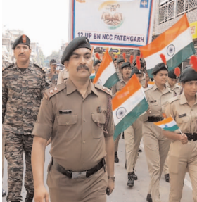
रैली निकालते एनसीसी कैडेट