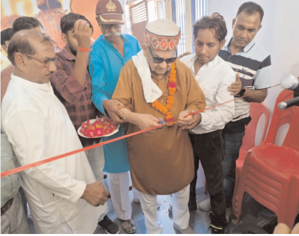
जिम का उद्घाटन करते दददू जी

▶ प्रशिक्षण लेने वाले युवाओं की चिकित्सीय टीम करेगी निगरानी