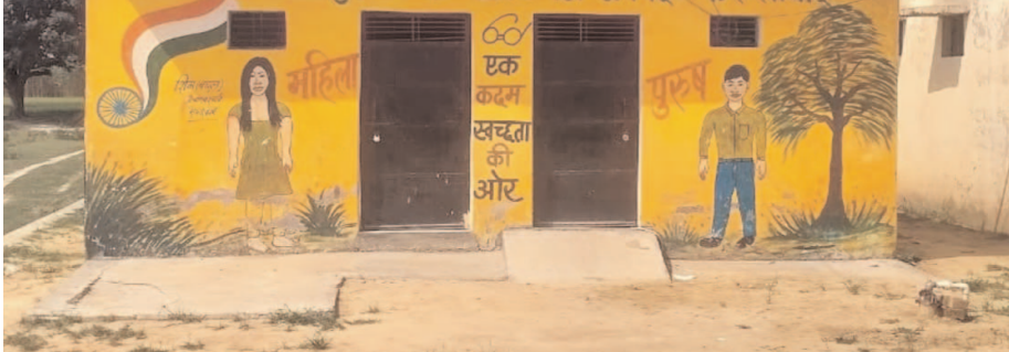
सामुदायिक शौचालय में पड़ा ताला

नवाबगंज, समृद्धि न्यूज़। केयरेटेकर सरकार के स्वच्छता मिशन अभियान को दरकिनार कर शौचालय का ताला नहीं खोल रहा है। जिससे लोगों में रोष है। नवाबगंज विकास खंड क्षेत्र के ग्राम पंचायत बलीपुर सामुदायिक शौचालय में ताला पड़ा हुआ है, जबकि सामुदायिक शौचालय में सरकार ने वरीयता के हिसाब से केयरेटेकर नियुक्त करवाकर उनको हर माह करीब दस हजार मानदेय देने की व्यवस्था ग्राम पंचायत से की थी। किसी भी मद से ग्राम सचिव उनको उनका मानदेय दें, लेकिन सारे काम करके केयरेटेकर को मानदेय दिया जाता है। वहीं मानदेय लेने के बाद केयरेटेकर मौज मस्ती में लग जाते हैं, लेकिन जो उनका काम सामुदायिक शौचालय खोलना उनको नहीं खोलते हैं। ऐसे में या तो उनका लापरवाही कहीं जाए, या फिर उन पर अधिकारियों का आशीर्वाद समझा जाए। जिससे वह ताले खोलने को