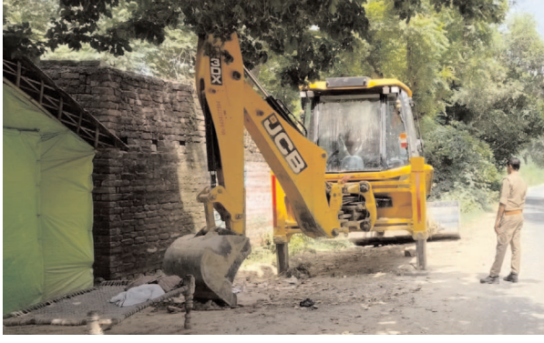
जेसीबी की निगरानी करती पुलिस

▶ लम्बे समय से चल रहा है अवैध कारोबार, कई लोग शामिल ▶ पट्टाधारक ने एसडीएम के चालक व पुलिस को सुविधा शुल्क देने का लगावा आरोप