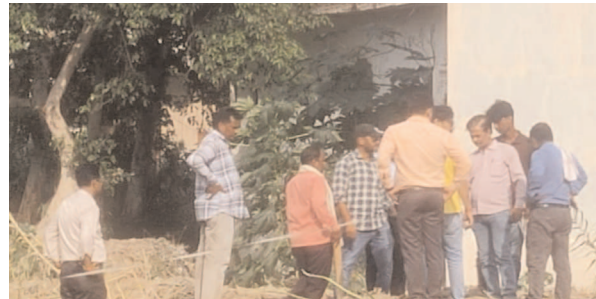
पैमाइश करते राजस्व कर्मी

फर्रुखाबाद, समृद्धि न्यूज। सरकारी भूमि पर अवैध रूप से कुछ लोगों द्वारा कब्जा कर लेने की शिकायत के मामले में जिलाधिकारी के आदेश पर एसडीएम सदर की मौजूदगी में भूमि की पैमाइश करायी गई। इस दौरान सरकारी भूमि पर अवैध तरीके से जिन्होंने कब्जा कर रखा है वह अपने स्तर से हटा लें, नहीं तो प्रशासन अपने स्तर से हटवायेगा तो