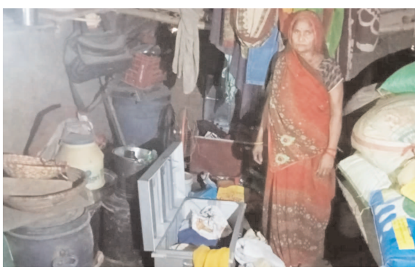
चोरी की जानकारी देती पीड़ित महिला

कपिल, समृद्धि न्यूज। दीवार में नकब लगाकर चोरों ने नगदी, जेवर समेत दो लाख का माल चोरी कर लिया। सुबह जागने पर दंपति को घटना की जानकारी हुयी। थाना पुलिस ने मौके पर पहुंच जांच पड़ताल की।