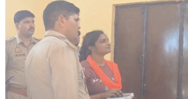
जांच पड़ताल करती पुलिस

नवाबगंज, समृद्धि न्यूज। बीती रात अज्ञात चोरों ने पंचायत भवन का ताला तोड़कर लाखों की चोरी कर ली। घटना की जानकारी उस समय हुई पंचायत सहायक सुबह ताला खोलने आयी तो ताला टूटा पड़ा था। सूचना ग्राम प्रधान ने पहुंचकर सूचना पुलिस को दी। मौके पर पहुंची पुलिस ने जांच पड़ताल की। घटना के संबंध में ग्राम प्रधान ने पुलिस को तहरीर दी है।