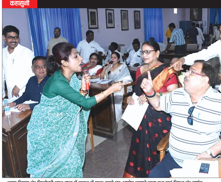
नगर निगम के त्रिलोकी नाथ हाल में सद्वन में एक दूसरे पर आरोप लगाते सत्ता पक्ष एवं विपक्ष के पार्षद