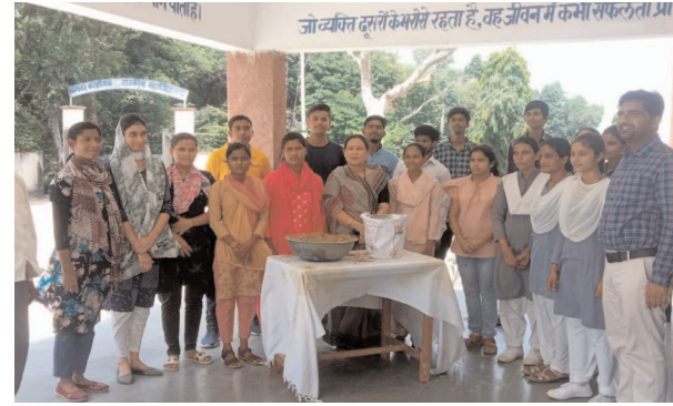
माटी के साथ पंच प्रण लेते छात्र-छात्राओं