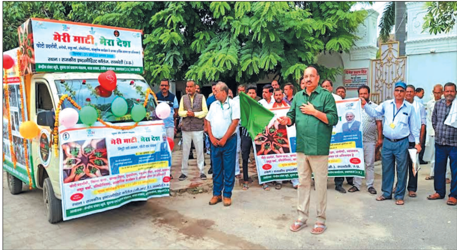
रायबरेली, समृद्धि न्यूज़।

► केन्द्रीय संचार ब्यूरो प्रयागराज द्वारा जीआईसी में दो दिवसीय विविध कार्यक्रम का आयोजन ► मेरी माटी मेरा देश, मिट्टी को नमन, वीरों का वंदन