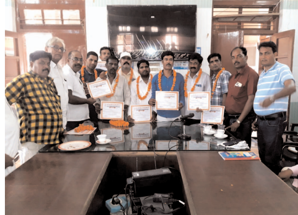
ग्रामीण पंचायतरीज सफाईकर्मों के नवीन पदाधिकारी