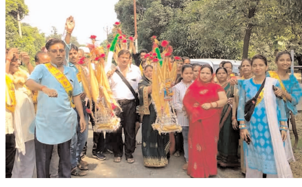
कांवर यात्रा में भाग लेते भक्तगण व महिलाएँ