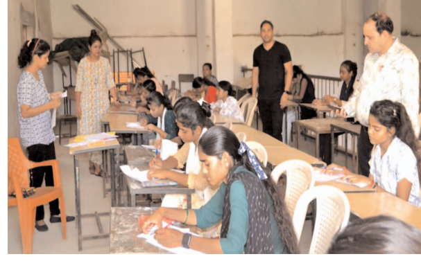
सामान्य प्रतियोगिता में भाग लेते परीक्षार्थी

फर्रुखाबाद, समृद्धि न्यूज। विश्वनाथ सामाजिक सेवा संस्थान द्वारा संचालित एशियन कंप्यूटर इंस्टीट्यूट द्वारा पांच केंद्रों पर सामान्य ज्ञान परीक्षा में कुल 5014 छात्रों ने भाग लिया। फर्रुखाबाद में सरस्वती विद्या मंदिर इंटर कॉलेज श्याम नगर केंद्र पर सीनियर वर्ग में 1284 व जूनियर वर्ग में 943, कमालगंज में मौलाना आजाद इंटर कॉलेज केंद्र पर सीनियर वर्ग में 363 व जूनियर वर्ग में 319, राजपुर में एसआरएस पब्लिक इंटर कॉलेज में सीनियर वर्ग में 386 व जूनियर वर्ग में 343, शाहजहांपुर भरगंवा में अवतीबाई इंटर कॉलेज केंद्र पर सीनियर वर्ग में 354 व जूनियर वर्ग में 296, नवाबगंज में जेएस इंटर कॉलेज में सीनियर वर्ग में 417 व जूनियर वर्ग में 309 छात्र-छात्राओं ने प्रतिभाग किया। परीक्षा दो वर्गों में आयोजित हुई। जूनियर वर्ग कक्षा 6 से 9 प्रातः 9 से 10.00 बजे तक तथा सीनियर वर्ग कक्षा 10 से परास्नातक तक प्रातः 11.00 से 12.00 तक। छात्रों ने छत्रवृत्ति व पुरस्कार पाने के लिए दिमागी कसरत की। परीक्षा में समासामयिक, राजनीति, खेलकूद, तार्किक योग्यता,