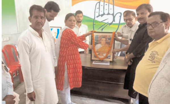
पार्टी कार्यालय पर स्व० राजीव गांधी की जयंती मनाते कांग्रेसी