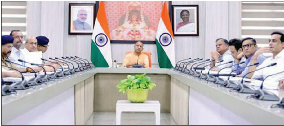
मुख्यमंत्री योगी आदित्यनाथ अयोध्या राम जन्म भूमि की सुरक्षा को लेकर करते समीक्षा बैठक

मुख्यमंत्री का निर्देश- मंदिर लोकार्पण से पहले करें भव्य सजावट