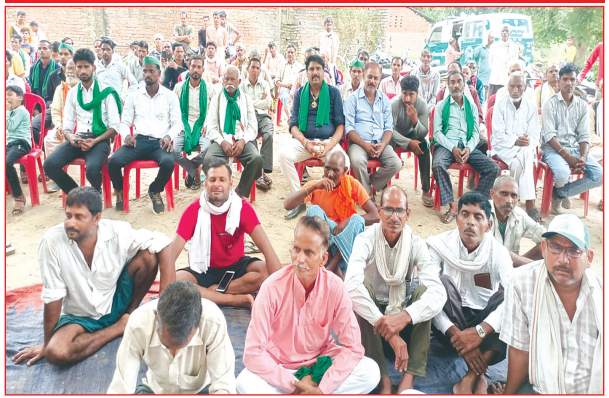
किसान पंचायत में मौजूद किसान समृद्धि न्यूज