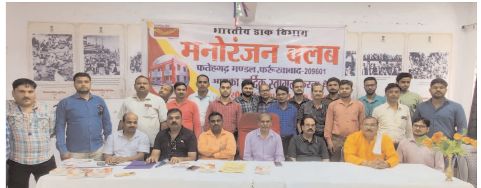
मनोरंजन क्लब की नवीन कार्यकारिणी के गठन के दौरान मौजूद पदाधिकारी