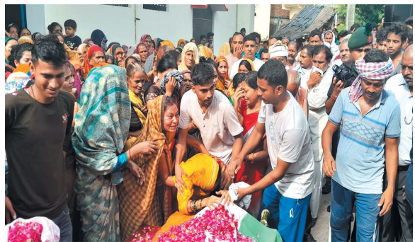
उन्नाव, समृद्धि न्यूज़।