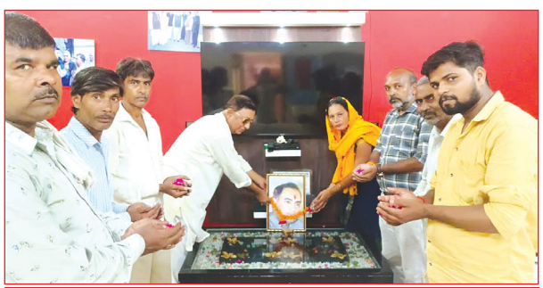
पूर्व पीएम स्व. राजीव गांधी के चित्र पर पुष्प अर्पित करते कांग्रेसीजन