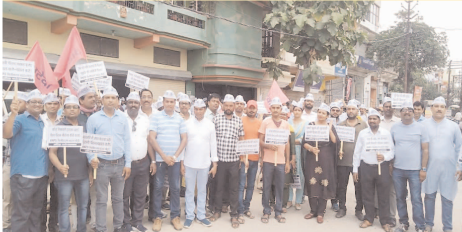
पुरानी पेंशन बहाली को लेकर सांसद का घेराव कर नारेबाजी करते शिक्षक व कर्मचारी