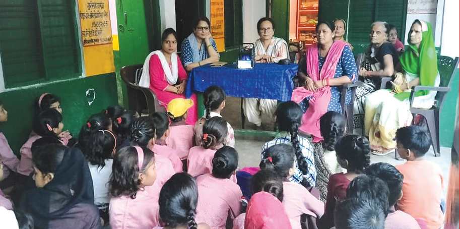
प्राथमिक विद्यालय गुरसहायगंज में सजीव प्रसारण को देखते बच्चों