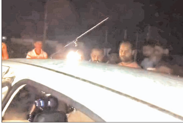
चौकी इंचार्ज को धमका रहा भाजपा नेता

▶ खनन करने का मामला, कहा सरकार हमारी है ▶ सीओ ने मुकदमा दर्ज कराने की कही बात