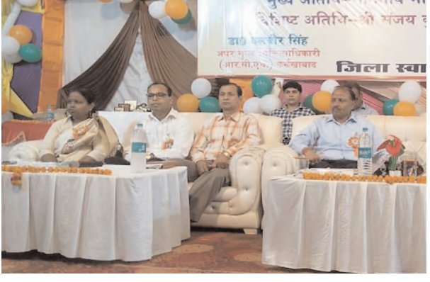
कार्यक्रम में मौजूद जिलाधिकारी व अन्य

फर्रुखाबाद, समृद्धि न्यूज। राष्ट्रीय ग्रामीण स्वास्थ्य मिशन के अंतर्गत आशा दिवस के उपलक्ष्य में शहर के उपाध्यक्ष मिश्रा भवन में बुधवार को आशा सम्मेलन का आयोजन किया गया। मुख्य अतिथि जिला पंचायत अध्यक्ष और डीएम संजय सिंह ने फीता काटकर व दीप प्रज्वलित कर कार्यक्रम का शुभारम्भ किया। कार्यक्रम का संचालन एआरओ हरिमोहन कटियार ने किया।