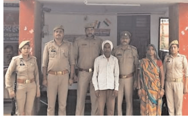
पुलिस हिरासत में हत्यारोपी दंपति

▶ पुलिस ने दंपति को गिरफ्तार कर भेजा जेल