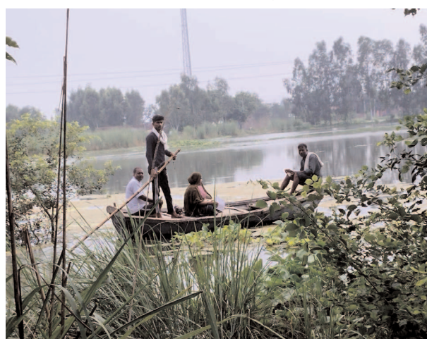
ग्राम कुसमापुर में बच्चे की दवा लेने नाँव से जाती महिला

अमृतपुर, समृद्धि न्यूज। कहते हैं जब व्यक्ति दोहरी मार को झेलता है तो वह पूरी तरह से टूट जाता है। फिर उसको संभलना भी मुश्किल हो जाता है। यही हाल है इस समय अमृतपुर तहसील क्षेत्र के वाशियों का। एक तरफ गंगा की बाढ़ ने तबाही मचा रखी है। जिससे लोगों को अपना घर भी छोड़ना पड़ा है। लोग सड़कों व छतों पर पत्ती तानकर रहने को मजबूर हैं। वहीं दूसरी ओर बारिश ने उनकी जान की आफत कर दी। पेट भरने के लिए रखे अनाज आदि भीगकर खराब होने की कगार पर पहुंच गए। क्षेत्र के कई गांव ऐसे हैं जहां के प्रधानों की लापरवाही की वजह से अभी तक ना ही राशन सामग्री पहुंची और ना ही उनके निकलने के लिए नाव मिल पाई। ग्राम सभा