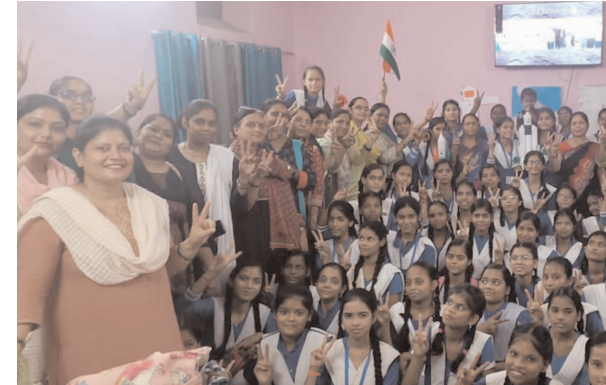
चंद्रयान-3 का लैंडिंग कार्यक्रम देखती छात्राओं व मौजूद शिक्षिकायें

फर्रुखाबाद, समृद्धि न्यूज। चंद्रयान-3 की सफलता पर पूरे देश में जश्न का माहौल है। भारत की इस कामयाबी पर सभी देशों ने इसरो को बधाई दी है। जनपद के विभिन्न विद्यालयों में टीवी पर लाइव प्रसारण देर शाम देखा गया। शहर के विभिन्न विद्यालयों में लाइव प्रसारण देखने के दौरान भारत माता की जय के नारों के साथ छात्र-छात्राओं ने आवाज बुलंद