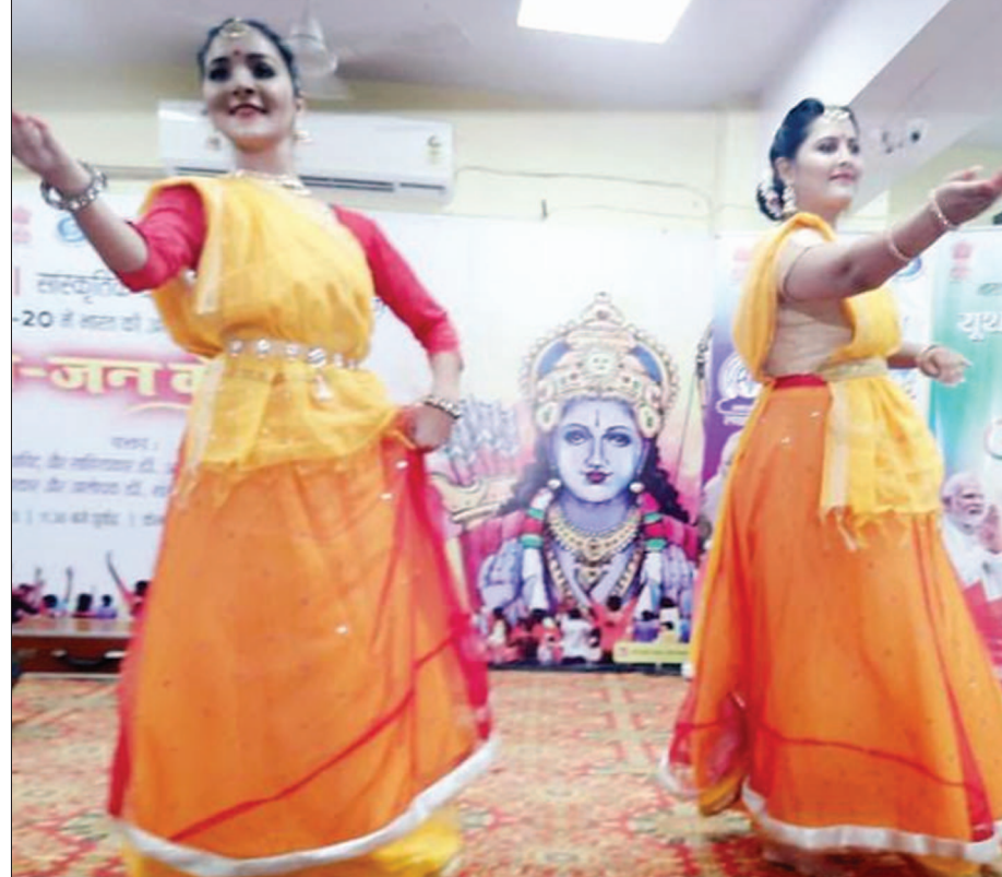
केन्द्रीय संस्कृत विश्वविद्यालय परिसर में हुआ जी-20 में भारत की अध्यक्षता का उत्सव श्रृंखला में आकाशवाणी द्वारा जन जन के दिवस विधाक वृथ कॉलेज और सांस्कृतिक कार्यक्रम समृद्धि न्यूज़