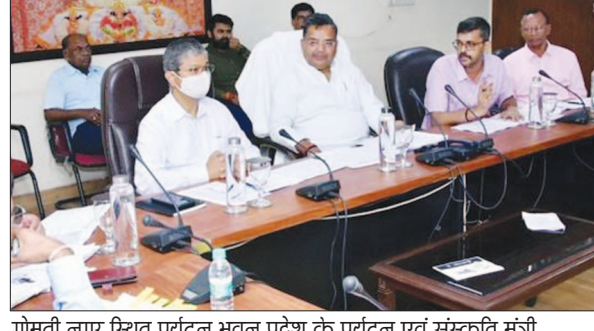
गोमती नगर स्थित पर्यटन भवन प्रदेश के पर्यटन एवं संस्कृति मंत्री जयवीर सिंह ने पर्यटन निगम के कार्यों तथा परियोजना का समीक्षा की

उत्तर प्रदेश के पर्यटन एवं संस्कृति मंत्री जयवीर सिंह ने कहा है कि राज्य पर्यटन विकास निगम लि के अंतर्गत आने वाले होटलों तथा पर्यटक आवास गृहों में उच्च स्तर की साफ-सफाई की व्यवस्था सुनिश्चित की जाए। सभी में लिनन की बेडसीट, तौलिया तथा मैट्रेस आदि ताज होटल की तरह ग्राहकों को उपलब्ध कराई जाए। उन्होंने कहा कि सुरक्षा के लिए सीसीटीवी कैमरे लगाये जाये। उन्होंने कहा कि पर्यटन निगम के होटलों की आमदनी बढ़ाई जाए। पर्यटन मंत्री आज यहां गोमतीनगर स्थित पर्यटन भवन में पर्यटन विकास निगम द्वारा क्रियान्वित परियोजनाओं का पालन अनिवार्य रूप से करने के निर्देश दिए। निर्माण कार्यों की थर्ड पार्टी जांच कराई जाए। घंटिया निर्माण तथा आणमानक सामग्री का उपयोग पाये जाने पर संबंधित कार्यदायी संस्था के खिलाफ विधिक कार्यवाही की जायेगी। उन्होंने प्रयागराज, अयोध्या तथा वाराणसी में संचालित