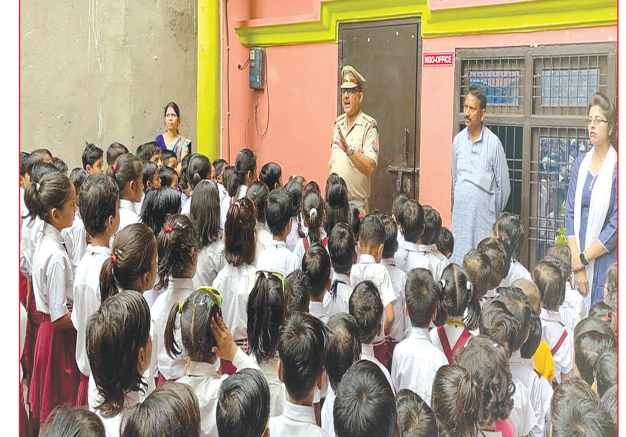
स्कूली वाहन को चेक करते व बच्चों को यातायात के प्रति जागरूक करते यातायात प्रभारी

क्या-क्या सावधानी बरतनी है। सड़क को किस तरह से क्रॉस करना है बताया गया। यातायात प्रभारी द्वारा बच्चों को बताया गया कि अगर तुम्हारे बस या वैन चालक रॉंग साइड वाहन चलते हैं या तुम्हारे उतरते, चढ़ते समय सही ढंग से देखभाल नहीं करते हैं तो आप अपने माता-पिता को या स्कूल में प्रधानाचार्य को