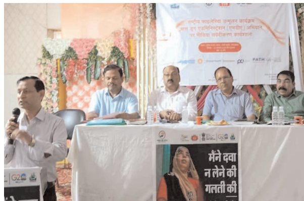
कार्यक्रम के दौरान मौजूद एसीएमओ, मलेरिया अधिकारी व अन्य

फर्रुखाबाद, समृद्धि न्यूज़। जनपद में 10 अगस्त से चलने वाले मास ड्रग एडमिनिस्ट्रेशन कार्यक्रम एमडीए अभियान के उद्देश्य को प्राप्त करने में मीडिया सहयोगियों की महत्वपूर्ण भूमिका है। इसी को ध्यान में रखते हुए स्वास्थ्य विभाग के तत्वावधान में सेंटर फॉर एडवोकेसी एंड रिसर्च सीफार संस्था के सहयोग से गुरुवार को नगर के एक स्थानीय होटल में मीडिया संवेदीकरण कार्यशाला का आयोजन किया गया। इस दौरान 25 मीडिया कर्मियों ने फाइलेरिया रोधी दवा का सेवन कर फाइलेरिया अभियान को सफल बनाने की शपथ ली। इस मौके पर सम्बोधित करते हुए फाइलेरिया उन्मूलन कार्यक्रम के नाडल व अपर चिकित्सा