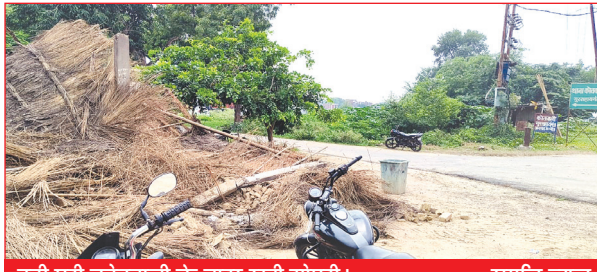
टूटी पड़ी कोतवाली के बाहर रखी झोपड़ी।