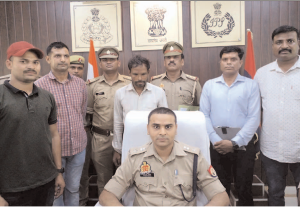
घटना का खुलासा करते पुलिस अधीक्षक

एसपी ने घटना का किया खुलासा, पुलिस ने हत्यारोपी को आलाकल्ल 315 बोर का तमंचा सहित गिरफ्तार कर भेजा जेल