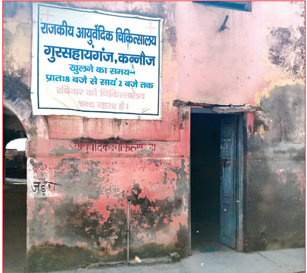
नगर स्थित राजकीय आयुर्वेदिक अस्पताल