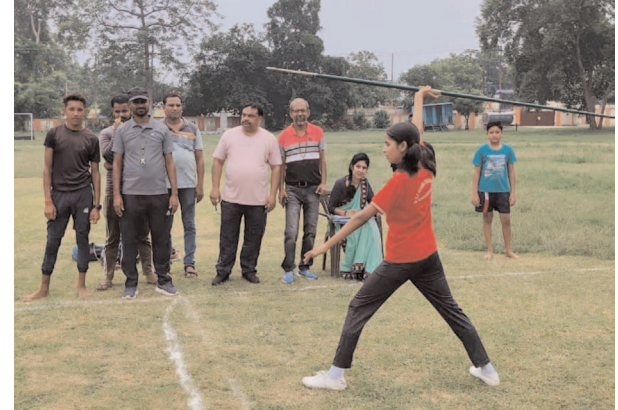
भाला फेंक प्रतियोगिता में भाग लेती छात्रा

फर्रुखाबाद, समृद्धि न्यूज़। स्व० ब्रह्मदत्त स्टेडियम फतेहगढ़ में जिला स्तरीय भाला फेंक प्रतियोगिता का चयन 18 वर्ष से कम आयु बालक बालिका वर्ग, 16 वर्ष से कम आयु बालक बालिका वर्ग, 14 वर्ष से कम आयु बालक बालिका वर्ग, 18 वर्ष से अधिक आयु वर्ग के बालक महिला व पुरुष टीम का चयन किया गया।