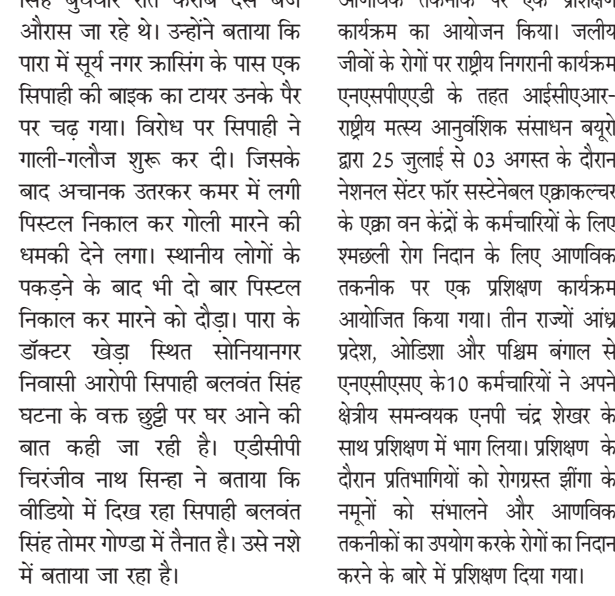
मछली रोग निदान के लिए दिया गया प्रशिक्षण