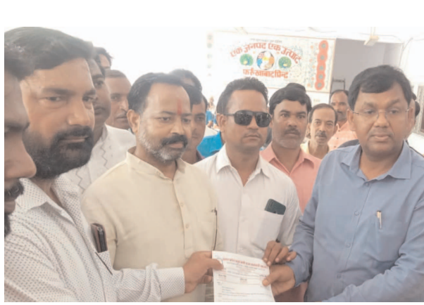
अतिरिक्त एसडीएम को ज्ञापन सौंपते राज्य कर्मचारी महासंघ के लोग

फर्रुखाबाद, समृद्धि न्यूज़। उत्तर प्रदेश चतुर्थ श्रेणी राज्य कर्मचारी महासंघ ने विभिन्न विभागों में कार्यरत चतुर्थ श्रेणी राज्य कर्मचारियों पंडित दीन दयाल उपाध्याय केशलेस स्वास्थ्य