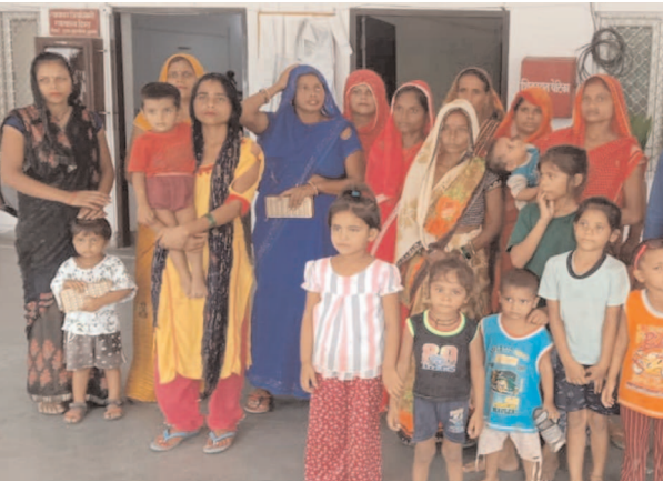
घटना की जानकारी देते ग्रामीण

फर्रुखाबाद, समृद्धि न्यूज़। विधायक के पति पर आम रास्ते पर पक्का निर्माण कर रास्ता अवरुद्ध करने का आरोप लगाते हुए ग्रामीणों ने जिलाधिकारी से लिखित शिकायत कर निर्माण कार्य रुकवाया जाने की मांग की। कादरीगेट बाग लकूला के लगभग