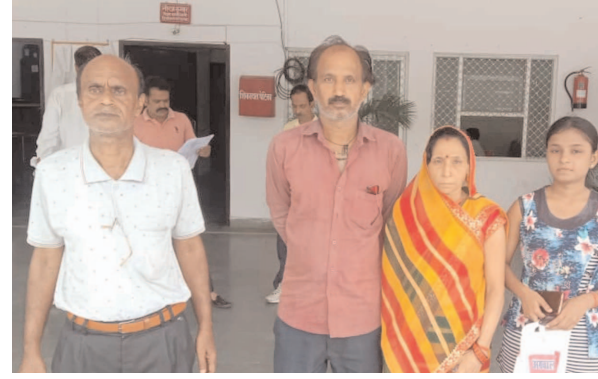
जानकारी देते पीड़ित माता पिता

डीएम ने मामले को संज्ञान में लेकर सीओ को दिवे जांच के आदेश