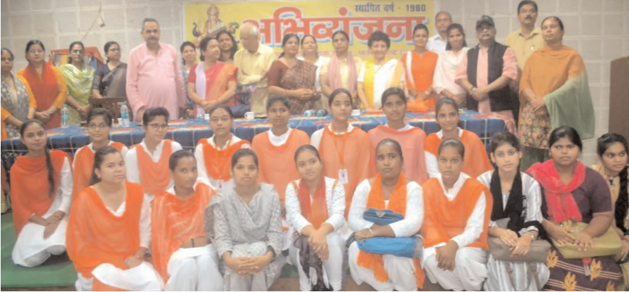
कवि दिवस पर संगोष्ठी में भाग लेते साहित्यकार व छात्राईय