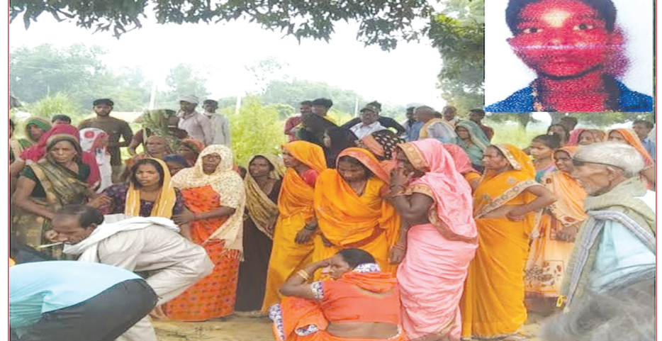
घटनास्थल पर मौजूद भीड़ व मृतक बालक की फाइल फोटो