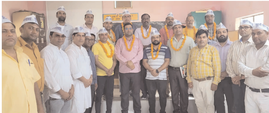
अटेवा की ब्लाक कायमगंज नव नियुक्त कार्यकारिणी के साथ मौजूद पदाधिकारी