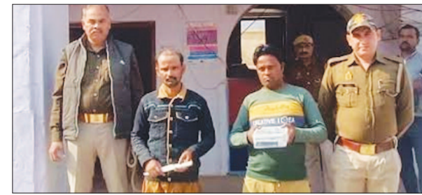
पुलिस गिरफ्तार में पकड़ा गया आरोपी