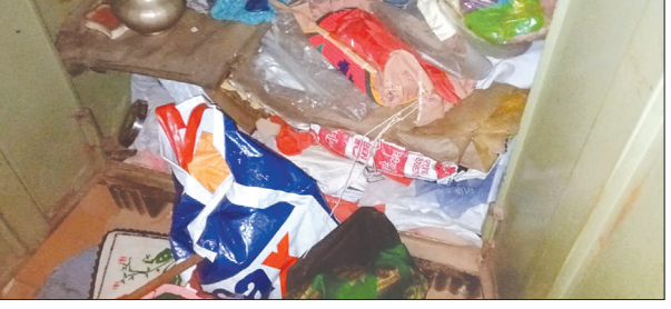
टूटी सेफ व बिखरा पड़ा सामान समृद्धि न्यूज़