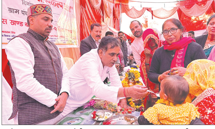
बच्चों का अन्नप्राशन करते विधायक