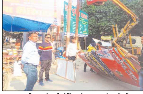
अनाधिकृत से लगी होर्डिंग को जल्द करते कर्मचारी

प्रशासन के आदेश पर नगर क्षेत्र मुख्य मार्ग पर अवैध रूप से लगाये गये होर्डिंग/बैनर को हटवाये जाने के लिए टीम गठित की गई थी। रविवार को नगर पालिका टीम ने नगर क्षेत्र में मुख्य मार्ग के दोनों तरफ व चौराहों, तिराहों अनाधिकृत रूप से लगी होर्डिंग/बैनर को हटवाया गया। नगर पालिका अधिशासी अधिकारी