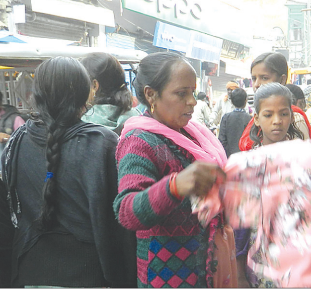
संडे बाजार में गर्म कपड़ों की खरीद फरोख्त करते लोग समृद्धि न्यूज़

जैसे-जैसे सर्दी सुख हो रही है, वैसे-वैसे गर्म कपड़ों की बिक्री में इजाफा हो रहा है। इसी क्रम में रविवार को चौक से लेकर घुमना तक लगने वाले संडे बाजार में गरीब व मध्यमवर्गीय लोगों ने गर्म कपड़ों की जमकर खरीददारी की। बताते चलें कि संडे बाजार गरीब व मध्यमवर्गीय लोगों के लिए मुफ्ती माना जाता है, क्योंकि इस बाजार में कम कीमत में बच्चों से लेकर बड़ों तक के गर्म कपड़े मिल जाते हैं। रविवार को गर्म कपड़ों की खरीददारी के लिए लोगों की भारी भीड़ उमड़ी। महिलाओं व पुरुषों ने स्वेटर व जैकेट की खरीददारी की। वहीं युवतियों ने भी गर्म कुर्ती व जैकेट खरीदीं। चौक से लेकर घुमना तक बाजार में काफी भीड़ होने के चलते कई बार जाम की स्थिति भी बनी। जिससे लोगों को निकलने में काफी दिक्कतों का सामना करना पड़ा। यहां पर दुकान लगाने वाले दुकानदार