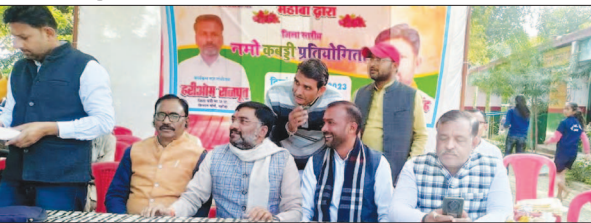
महोबा। समृद्धि न्यूज़