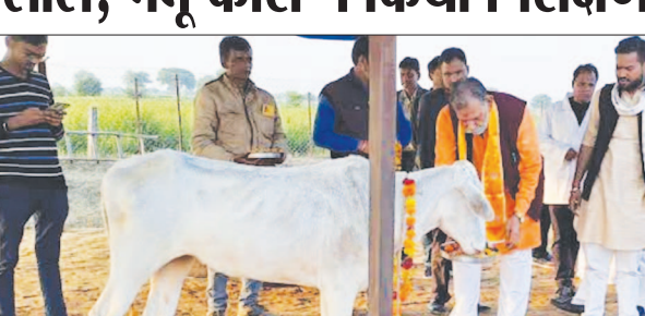
हमीरपुर। समृद्धि न्यूज़