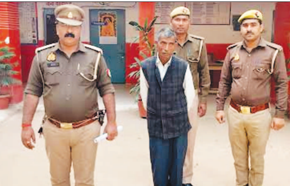
पुलिस गिरफ्तार में आया आरोपी