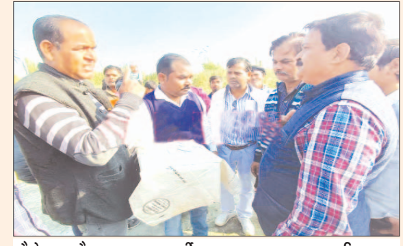
मौके पर मौजूद राजस्व कर्मी