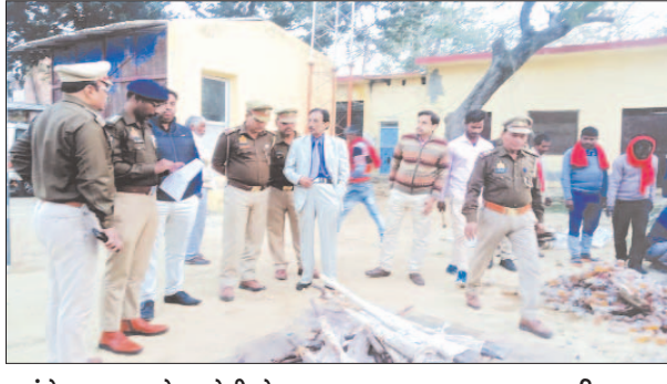
तमंचे नष्ट करते कमेटी के सदस्य