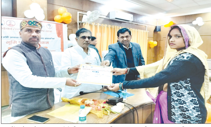
पात्रों को स्वीकृत पत्र देते जिलाध्यक्ष व विधायक आदि समृद्धि न्यूज़

सदर विधायक ने पात्रों को वितरित किये प्रधानमंत्री आवास के स्वीकृत पत्र