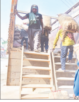
गाड़ी लोड करते पल्लेदार