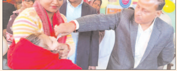
बच्चों को पोलियो की दवा पिलाते डीएम