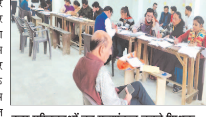
उत्तर पुस्तिकाओं का मूल्यांकन करते शिक्षक