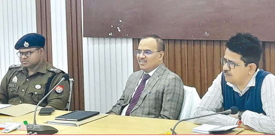
कन्नौज, समृद्धि न्यूज

ने कलेक्ट्रेट के गांधी सभागार में बैठक कर सम्बन्धित विभागीय अफसरों को आवश्यक दिशा निर्देश दिये। डीएम ने बैठक में कहा कि परीक्षा केन्द्रों का चयन निर्धारित मानक अनुसार होना चाहिए। प्रत्येक परीक्षा केन्द्र पर अच्छी क्वालिटी के सीसीटीवी, वाइस रिक्टर कैमरा एवं सड़क तथा प्रकाश व पानी, शौचालय, साफ-सफाई, बाउण्ड्रीवाल, खिड़की, आदि की समुचित व्यवस्था होनी चाहिए। उन्होने कहा कि विगत वर्ष