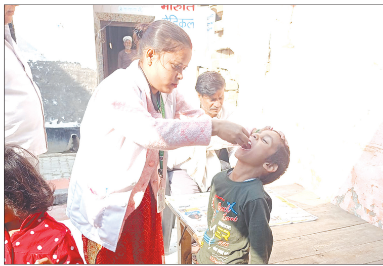
बच्चों को पोलियो की खुराक पिलाती नर्स