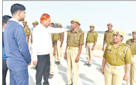
परेड का निरीक्षण करते पीआरडी के पूर्व महानिदेशक