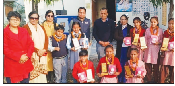
योग एथलीट्स को सम्मानित करते बीईओ डकोर साथ में छडे शिक्षक।

उन्होंने बताया कि अब से हर वर्ष 10 दिसंबर को योग एवं योगासना में मंडल एवं प्रदेश के लिए चयनित योगा एथलेट्स को ये पुरस्कार दिया जायेगा। इस वर्ष 7 बच्चों को ये पुरस्कार दिया गया। जिसमें उन्हें एक सोलर लाइट एवं मोमेंटो प्रदान किया गया। डकोर ब्लॉक के यूपीएस