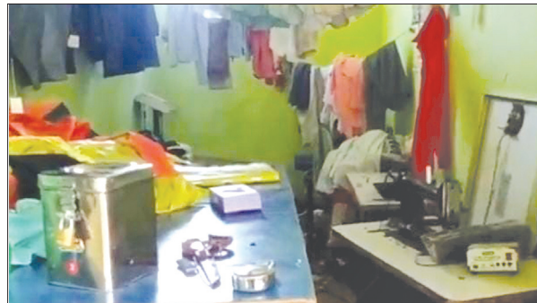
दुकान में चोरों द्वारा की गयी चोरी के बाद अस्त व्यस्त सामान

चोर बीती रात टेलर की दुकान में नकब लगाकर पांच हजार की नकदी, सिले कपड़े सहित बैट्री व इन्वर्टर चोरी कर ले गये। सुबह जब दुकान स्वामी दुकान खोलने पहुंचा, तब उसे चोरी होने की जानकारी हुई। उसने घटना की सूचना कोतवाली पुलिस को दी। पुलिस ने मौके पर पहुंचकर जांच पड़ताल की और जल्द से जल्द चोरी की घटना का खुलासा करने की बात कही।