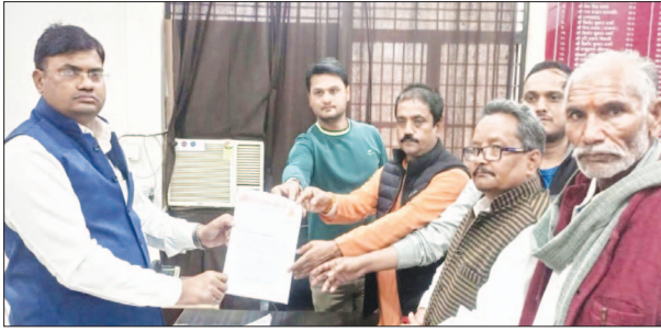
मांस की दुकानों की बंद कराने के लिए ज्ञापन देते हिंदू संगठनों के प्राधिकारी।

नगर में वधशाला न होने के बावजूद होटलों पर बड़े मांस की बिक्री होने का विरोध करते हुए उन्होंने मांस की दुकानों को बंद कराने की मांग की। एक सप्ताह में कार्यवाही न होने पर मौन जुलूस निकालकर मांस की दुकानों के सामने धरना देने की भी बात कही। हिंदू युवा वाहिनी