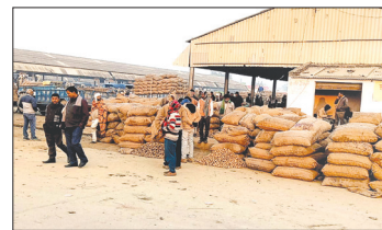
मण्डी में लगे आलू के पैकेट

आलू की आमद बढ़ने से सातनपुर मण्डी में भाव में लगातार गिरावट जारी है। सोमवार को आलू की आमद लगभग 150 मीटर रही। आलू का भाव एकदम धड़ाम से गिरने से किसान बेहाल हुआ। निबल आलू 251 रुपये से 281 रुपये पैंकेट बिका। मोटा पीला आलू 301 रुपये से 341 रुपये पैंकेट बिका। आलू का भाव गिरने से किसानों के चेहरे पर चिंता की लकीरे बन गयीं। ऐसे में आलू की लागत भी नहीं निकल पा रही है। आलू की बुआई, खाद, पानी लगाने के बाद आलू की खुदाई व आलू को मण्डी के लिए ट्रैक्टर का भाड़ा, आइडियों की तुलाई शामिल है। 600 रुपये कुंटल से भी कम दाम मिलने से आलू किसान