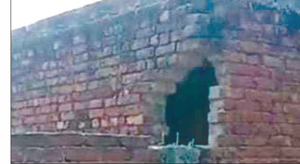
चोरों द्वारा दुकान में लगाया गया नकब

कपड़े सिलकर व अपने परिवार का भरण पोषण करता है। बीती देर शाम वह दुकान ठीक प्रकार से बंद कर अपने घर चला गया था। सोमवार को सुबह जब वह दुकान खोलने आया, तो दीवार में नकब लगा देख उसके होश उड़ गये। उसने अंदर जाकर देखा, तो सारा सामान बिखरा पड़ा था तथा गोलक में रखी पांच हजार की नकदी गायब थी। दुकान ने बताया कि