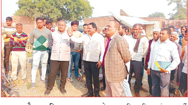
कन्नौज, समृद्धि न्यूज