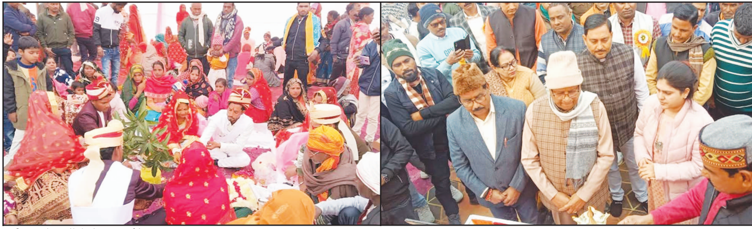
विवाह बंधन में बंधते युगल जोड़े