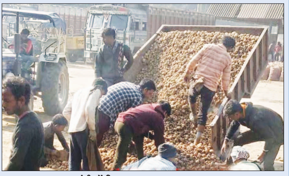
सातनपुर आलू मंडी में बिक रहा आलू

फर्रुखाबाद, समृद्धि न्यूज़। आलू के भाव में बुधवार को 30 रुपये का उछाल आया। जिससे आलू का भाव 681 रुपये कुंतल तक बिका। वहीं किसानों का कहना है कि लागत निकालना मुश्किल हो रहा है। जानकारी के अनुसार एशिया प्रसिद्ध सातनपुर आलू मंडी में बुधवार को आलू की आमद 125 मोटर रही। आलू के भाव में 30 रुपये का इजाफा दर्ज किया गया। आलू 531 से 681 प्रति कुंतल तक बिक्री किया गया। किसानों ने बताया कि आलू में मंदी के चलते उन्हें लागत के दाम निकालना मुश्किल हो रहा है। जिसके चलते कई किसानों ने फिलहाल आलू की खुदाई धीमी कर दी है। वहीं किसानों का यह भी कहना है कि यदि आलू खुदाई में ज्यादा विलम्ब करेंगे, तो गेहूँ आदि की बुवाई में विलम्ब हो जायेगा। साथ ही जानवरों आदि का चारा भी नहीं बो पायेंगे। फिलहाल आलू के घटते बढ़ते दामों से किसानों के चेहरे मुझाये हुए हैं।