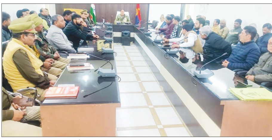
कोल्ड स्टोरेज मालिकों की बैठक लेते अपर पुलिस अधीक्षक