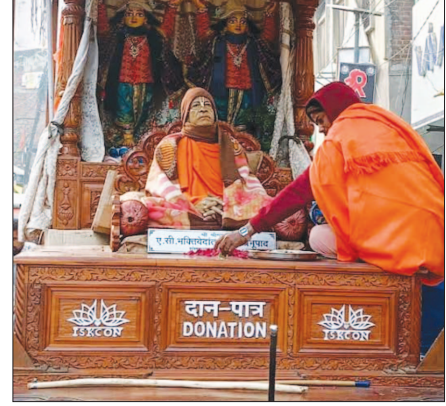
नगर में भ्रमण करती इस्कॉन श्रीराम पद यात्रा।

दिल्ली से चलकर नगर पहुंची इस्कॉन श्री राम पदयात्रा का स्थानीय लोगों ने धूमधाम से स्वागत किया। यात्रा को नगर भ्रमण करने के बाद भजन संध्या का आयोजन किया गया। जिसमें स्थानीय लोगों ने प्रवचनों को सुनकर अनुसरण करने का संकल्प लिया। बुधवार की दोपहर दिल्ली से चलकर अयोध्या जा रही इस्कॉन श्री राम पदयात्रा नगर पहुंची। जहां जगह-जगह पर उसका भव्य स्वागत किया गया। देर शाम यात्रा को नगर के जीटी रोड, तिवां रोड, चकोर गली