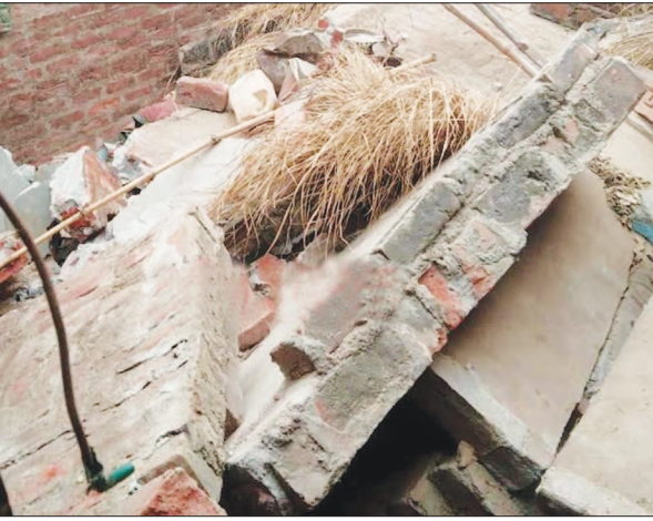
गिरे लैंटर का मलबा