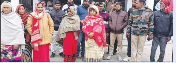
शिकायत करने के बाद जानकारी देते ग्रामीण

सरकारी भूमि से दबंगों का कब्जा हटाने को सौंपा ज्ञापन