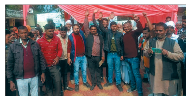
मोतीगंज/गोण्डा, समृद्धि न्यूज़।

जर्जर भवनों के ध्वस्तिकरण के सम्बन्ध में जिलाधिकारी ने कहा कि जनपद में पुराने जर्जर भवन को तकनीकी समिति के द्वारा परीक्षण करवाकर 15 दिन के भीतर ध्वस्तिकरण की कार्यवाही की जाय। बैठक में मुख्य विकास अधिकारी, जिला विकास अधिकारी, जिला बेसिक शिक्षा अधिकारी सहित अन्य सभी संबंधित अधिकारी गण उपस्थित रहे।