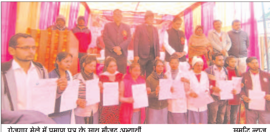
रोजगार मेले में प्रमाण पत्र के साथ मौजूद अभ्यर्थी