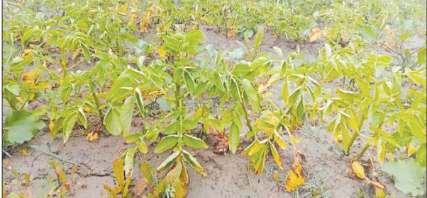
झुलसा रोग का शिकार आलू की फसल

फर्रुखाबाद, समृद्धि न्यूज़। जिला कृषि रक्षा अधिकारी ने किसानों से अपील की है कि कोहरा पड़ना शुरू हो गया है। जिस कारण रबी की प्रमुख फसलें जैसे आलू में झुलसा, सरसों में तुलासिता एवं गेहूं की फसल में पीली गेरुई रोग लगने की सम्भावना है। कोट/रोग से बचाव हेतु नियमित निगरानी करें। कोट/रोग के लक्षण प्रतिक्रिया होने पर तत्काल निर्मूलकित सुझाव एवं संस्तुतियों को अपना फसल को बचा सकते हैं। उन्होंने कहा कि आलू की फसल में ओगी/पिछेती झुलसा का प्रकोप होने पर पत्तियों पर भूरे व काले रंग के धब्बे बनते हैं तथा तीव्र प्रकोप होने पर सम्पूर्ण पौधा झुलस जाता है। रोग के प्रकोप को रोकने में कॉपरऑक्सी क्लोराइड 50 प्रतिशत डब्ल्यूपी 1 किलोग्राम, मैन्कोजेप 75 प्रतिशत डब्ल्यूपी 1 किलोग्राम, जिनेब 75 प्रतिशत डब्ल्यूपी 1 किलोग्राम, 2.5 किलोग्राम प्रति हेक्टेयर की दर से 800 से 1000 लीटर पानी में घोलकर छिड़काव करें। इसी प्रकार प्रति एखड़ की दर से छिड़काव करें। इसी प्रकार सरसों की फसल में