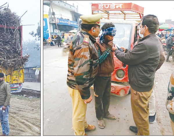
शराबी चालकों की जांच करते यातायात प्रभारी व समृद्धि न्यूज़