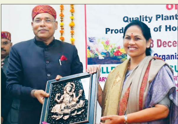
प्रमुख विषयों पर देश-विदेश के वैज्ञानिकों द्वारा एक मंच पर वैश्विक विमर्श किया जायेगा।

डॉ. राममनोहर लोहिया अवध विश्वविद्यालय के पर्यावरण विज्ञान विभाग द्वारा आयोजित दो दिवसीय अंतर्राष्ट्रीय कॉन्फ्रेंस 29 और 30 दिसंबर को परिसर के संत कबीर सभागार में होगा। इस कॉन्फ्रेंस में 350 से अधिक देश-विदेश के पर्यावरणविद् एवं वैज्ञानिक शामिल रहेंगे। कॉन्फ्रेंस में पर्यावरण एवं समाज विषय पर पांचवी अंतर्राष्ट्रीय कॉन्फ्रेंस गेसा द्वारा अपशिष्ट प्रबंधन के नवीन प्रयोग के महत्वपूर्ण विन्डुओं सहित जलवायु में तेजी से बढ़ रहे तापक्रम, कार्बन उत्सर्जन जैसे