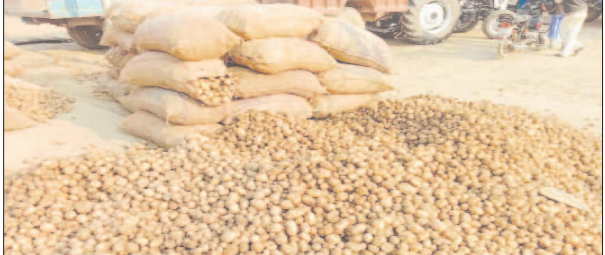
सातनपुर आलू मंडी में बिक रहा आलू

फर्रुखाबाद, समृद्धि न्यूज। आलू के भाव में गुरुवार को 31 रुपये की गिरावट आयी। जिससे आलू का भाव 651 रुपये कुंतल तक बिका। वहीं किसानों का कहना है कि लागत निकालना मुश्किल हो रहा है। जानकारी के अनुसार एशिया प्रमिड सातनपुर आलू मंडी में गुरुवार को आलू की आमद 125 मीटर रही। आलू के भाव में 31 रुपये की गिरावट दर्ज की गयी। आलू 551 से 651 प्रति कुंतल तक बिक्री किया गया। आज निबल आलू चेचक और घुघिया वाले 481 से 521 रुपए कुंतल तक में बिके। किसानों ने बताया कि आलू में मंदी के चलते उन्हें