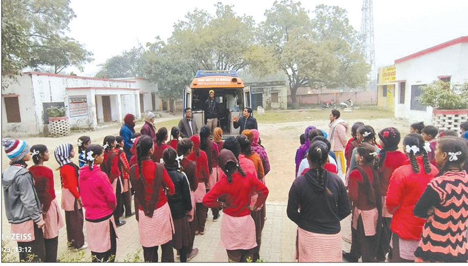
बच्चों को जानकारी देती एफएसडब्लू की टीम