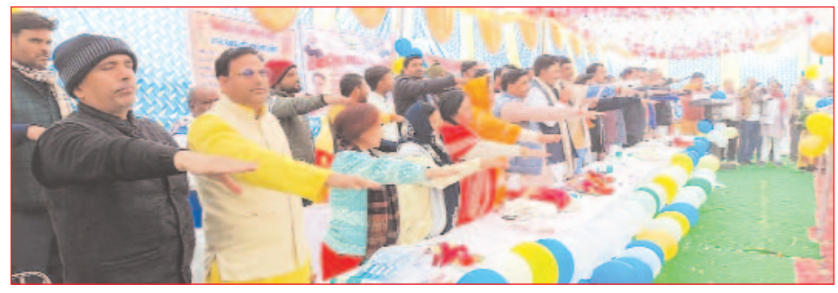
आयोजित कार्यक्रम में शपथ दिलाते मुख्य अतिथि व अन्य भाजपा पदाधिकारीगण

जलालाबाद समृद्धि न्यूज। विकासखंड जलालाबाद में जीटी रोड पर स्थित श्री दक्षिणमुखी हनुमान मंदिर प्रांगण में विकसित भारत यात्रा कार्यक्रम का आयोजन किया गया। जिसमें मुख्य अतिथि के रूप में सांसद सुब्रत पाठक ने माँ सरस्वती के चित्र पर दीप प्रज्ज्वलित कर कार्यक्रम का शुभारंभ किया। उन्होंने