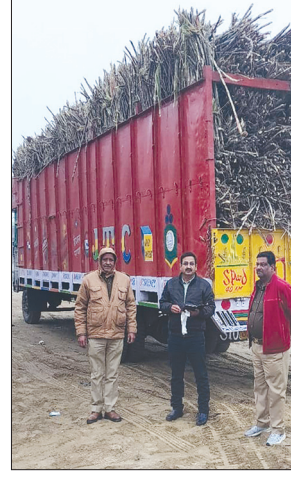
ओवरलॉड ट्रक को पकड़ने के बाद जानकारी देते अधिकारी

तीन ओवरलॉड मालवाहन तथा सात ओवरलॉड यात्री वाहन भी पकड़े