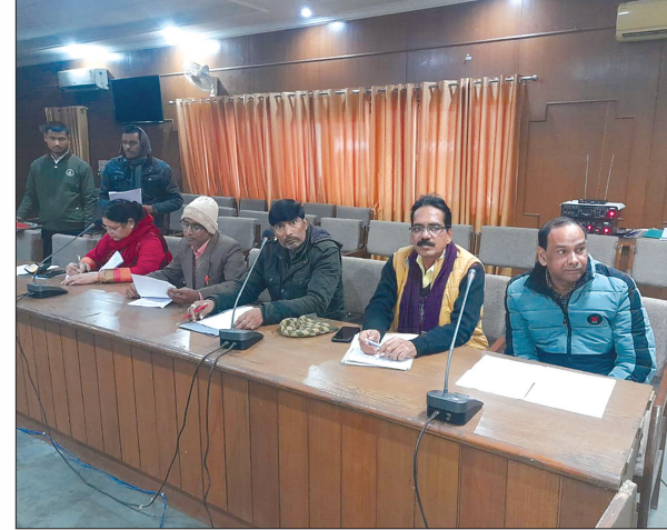
बैठक में मौजूद राजनैतिक दलों के प्रतिनिधि