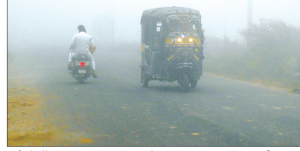
कोहरे में लाइट जलाकर चल रहे वाहन

सर्दी का प्रकोप लगातार बढ़ रहा है। सुबह और शाम घने कोहरे के कारण सड़क और रेल यातायात भी प्रभावित है। सर्दी के चलते हीटर, गीजर व कोयल की बिक्री में भी इजाफा देखा गया। जानकारी के अनुसार बीते चार पांच दिनों से सर्दी का प्रकोप तेजी से बढ़ने लगा है। शाम होते ही कोहरे का प्रकोप शुरू हो जाता है। जिससे वाहनों की रफ्तार भी धम सी जाती है। कोहरे के चलते बीते दिन चार दिनों में दुर्घटनाओं में भी इजाफा देखा गया। हालांकि सिटी के अंदर कोहरे का प्रकोप उतना नहीं है, जितना शहर के बाहर देखा जा रहा है। कोहरे के कारण वाहन चालक भी लाइट जलाकर तथा इंजीकेटर ऑन करके वाहन चला रहे हैं। वहीं बुजुर्ग घर से