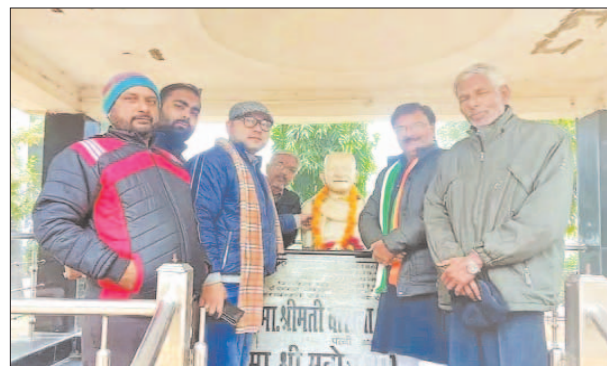
गांधी प्रतिमा पर माल्यार्पण करते कांग्रेसी