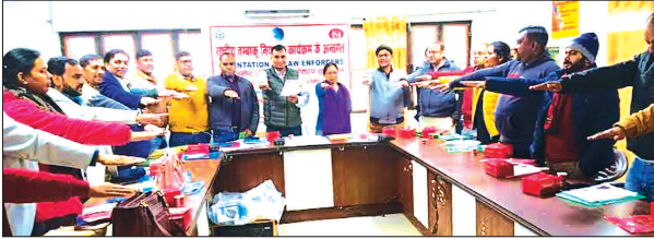
बहराइच, समृद्धि न्यूज़।

सोमवार को मुख्य चिकित्साधिकारी कार्यालय के सभागार कक्ष में राष्ट्रीय तम्बाकू निरंतरण कार्यक्रम के अंतर्गत ऑरिएंटेशन ऑफ लॉ इनफोर्सेस प्रशिक्षण/ उन्मुखीकरण कार्यशाला का आयोजन हुआ। इस प्रशिक्षण/ उन्मुखीकरण कार्यशाला में बेसिक शिक्षा विभाग, पंचायती राज विभाग, रेल विभाग आदि समेत समस्त स्वास्थ्य इकाइयों पर कार्यरत आशा एवं एएनएम ने तम्बाकू निरंतरण पर प्रशिक्षण प्राप्त कर तम्बाकू सेवन से होने वाली बीमारियों और बचाव के बारे में