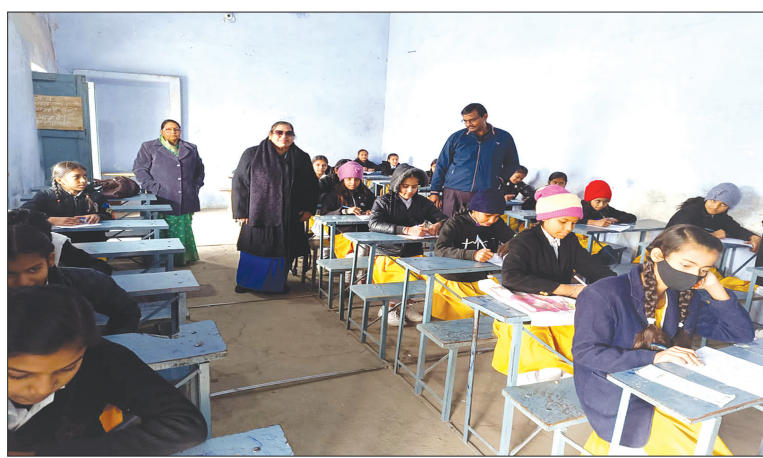
बीएसजी ज्ञान परीक्षा देते छात्र-छात्रायां

बीएसजी ज्ञान परीक्षा का जनपद के विभिन्न विद्यालयों में आयोजन हुआ। भारतीय पाठशाला इंटर कालेज में 458 पंजीकृत थे। 342 उपस्थित रहे, 116 छात्रों अनुपस्थित रहे। एसएमएन इंटर कालेज कायमगंज में 347 पंजीकृत थे, जिसमें 247 उपस्थित रहे, 100 छात्र अनुपस्थित रहे। पंडित दीनदयाल रोशनाबाद में पंजीकृत 144 थे, 113 उपस्थित रहे, 31 छात्र अनुपस्थित रहे। राजकीय बालिका इंटर कालेज राजेपुर में पंजीकृत 78 छात्रायां थी, जिसमें 76 छात्रायां उपस्थित रही। दो छात्रायां अनुपस्थित रही। कुल पंजीकृत छात्र 1027 थे। जिसमें 778 उपस्थित रहे और 249 छात्र-छात्रायां अनुपस्थित रही। परीक्षा जनपद के चार केंद्रों पर दोपहर 12 से 1 बजे