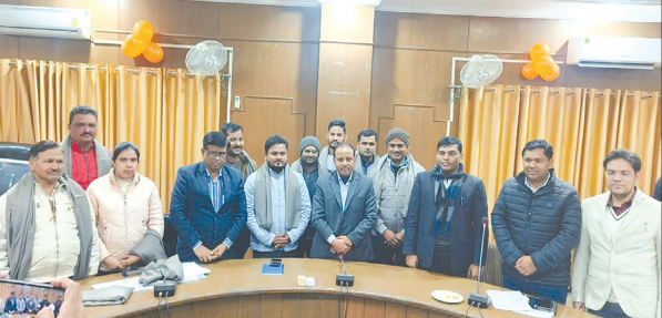
डीएम के साथ सम्मानित लेखपाल