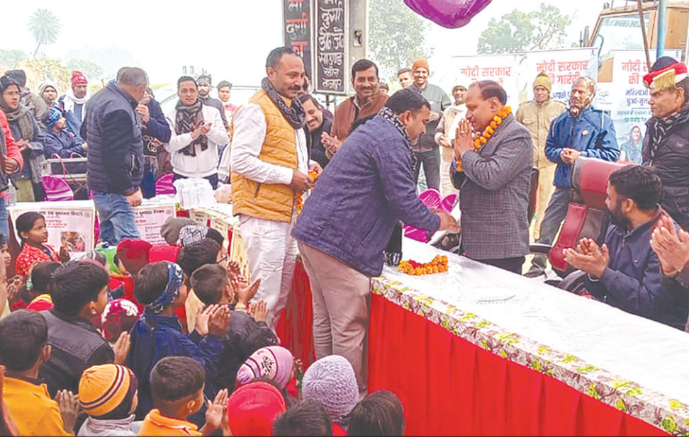
कार्यक्रम में मौजूद जिलाधिकारी व ग्रामीण