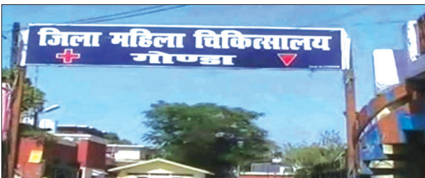
गोंडा, समृद्धि न्यूज़।

को लापरवाही और केस बिगड़ने का हौवा दिखाकर महिला अस्पताल में तैनात डॉक्टर के निजी अस्पताल ले जाने की सलाह देती हैं। इतना ही नहीं निजी अस्पतालों में सुरक्षित प्रसव कराने की सलाह देकर आशाएँ कमीशन के चक्कर में खेल करती हैं। गोंडा जिला महिला अस्पताल में गर्भवती के एंटी करते ही नेटवर्क से जुड़े लोग सक्रिय हो जाते हैं। इनमें