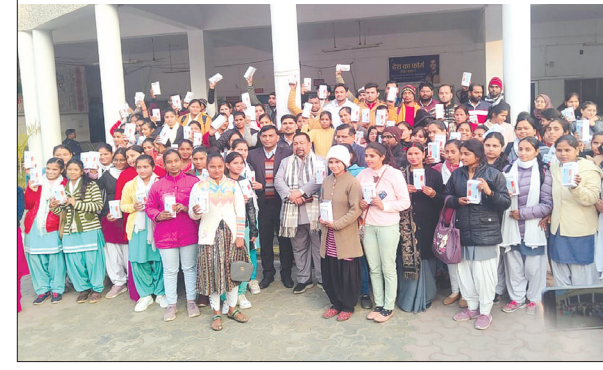
स्मार्टफोन के साथ युवा व मौजूद सांसद व एडीएम आदि