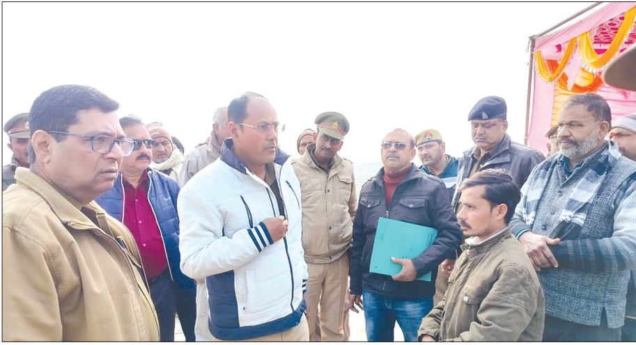
मेला क्षेत्र में वार्ता करते दोनों जनपदों के पुलिस अधिकारी समृद्धि न्यूज़

रामनगरिया मेले को लेकर अपर पुलिस अधीक्षक फर्रुखाबाद तथा अपर पुलिस अधीक्षक जनपद शाहजहांपुर ने बैठक कर मेले की तैयारियों पर चर्चा की। जानकारी के अनुसार ढाईघाट शमशाबाद पर लगने वाले मेला रामनगरिया को लेकर शुक्रवार को फर्रुखाबाद तथा शाहजहांपुर जिला प्रशासन ने समीक्षा बैठक की। साथ ही अपूर्ण कार्य को जल्द पूर्ण कराने के निर्देश दिये गये। अगहन पूर्णिमा को होने वाले स्नान को काफी भीड़ होती है। जिसके लिए बल्लू आदि लगाने के भी निर्देश दिये गये। सबसे बड़ी बात यह है शमशाबाद जनपद