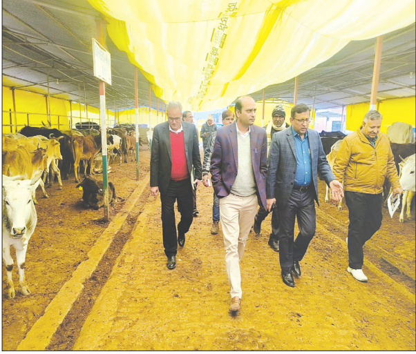
बसेली गोशाला का निरीक्षण करते नोडल अधिकारी

नोडल अधिकारी ने शुक्रवार को गोवंश आश्रय स्थल बसेली का निरीक्षण किया। निरीक्षण के समय 125 गोवंश पाये गये। गोशाला में गोवंशों के लिए हरे चारे की व्यवस्था ठीक पायी। गोशाला से सम्बद्ध चारागाह की 05 बीघा भूमि पर हरा चारा बोया गया है। निरीक्षण के समय गोशाला में 25 कुण्डल भूसा, 10 बोरी दाना, खड़िया, नमक व चूना पाया गया है। गोशाला में गोवंश को सर्दी से बचाव हेतु तिरपाल लगाये गये हैं तथा जिला कारागार फतेहगढ़ से बनकर आये काऊ कोट गोवंशों को पहनाए गये हैं। साथ ही रात्रि के समय सर्दी से बचाव हेतु अलाव की व्यवस्था की गई है। गोशाला में स्वयं सहायता समूह के माध्यम से गोबर के द्वारा वर्मी कम्पोस्ट तैयार कराया जा रहा है तथा जीवामृत भी तैयार कराया जा