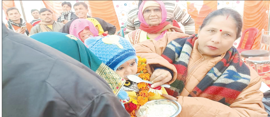
बच्चों का अन्नप्राशन करती आंगनवाड़ी कार्यकर्त्री समृद्धि न्यूज़

भारत सरकार द्वारा चलाई जा रही विकसित भारत संकल्प यात्रा का क्षेत्र का ग्राम पंचायत गुठिना में जगह-जगह स्वागत हुआ। इस दौरान पात्रों को उज्ज्वला गैस कनेक्शन तथा सम्मान निधि पत्र वितरित किये गये। नवाबगंज विकास खंड क्षेत्र के ग्राम पंचायत गुठिना में विकास खंड स्तर के अधिकारियों तथा जनप्रतिनिधियों द्वारा भारत सरकार द्वारा चलाई जा रही विकसित भारत संकल्प यात्रा का ग्राम पंचायत में बड़े हर्षोल्लास के साथ स्वागत किया गया। जिसमें मुख्य अतिथि के तौर पर विधायक पति अजीत गंगवार तथा ग्राम पंचायत के अधिकारियों ने बड़-चढ़कर भाग लिया।