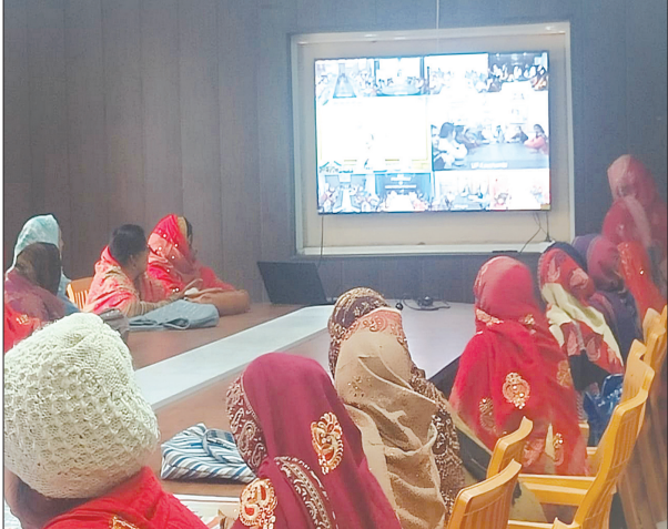
लाइव प्रसारण देखतीं समूह की महिलाएं समृद्धि न्यूज़

विकास खंड कार्यालय पर प्रदेश के उपमुख्यमंत्री द्वारा बीसी सखी तथा समूह की महिलाओं से लाइव प्रसारण के माध्यम से वर्चुअल संवाद किया गया तथा उन्हें सरकार की उपलब्धियां बतायी गयीं। नवाबगंज विकास खंड कार्यालय पर सभागार में शुक्रवार को प्रदेश के उपमुख्यमंत्री केशव प्रसाद मौर्य द्वारा बीसी-सखी तथा समूह की महिलाओं से लाइव प्रसारण के माध्यम से वर्चुअल संवाद किया गया। जिसमें प्रदेश के उपमुख्यमंत्री ने समूह की महिलाओं तथा सहायक विकास खंड