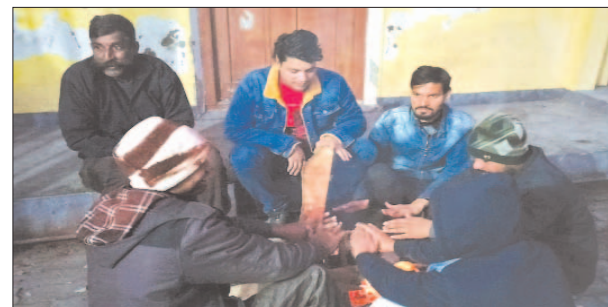
अलाव तापते लोग

रविवार को सर्दी का सबसे ठंडा दिन रहा। धूप के दर्शन न होने के कारण लोग या तो रजाई में बैठे रहे या फिर अलाव के पास। सबसे ज्यादा बुजुर्गों का हाल बेहाल हो गया। वहीं छोटे बच्चे सर्दी जुकाम की चपेट में आ गये। जानकारी के अनुसार सर्दी का सितम जारी है। रविवार को सबसे ज्यादा ठंडा दिन रहा। पूरे दिन सूर्य भगवान के दर्शन नहीं हुए। लोग अलाव तापते नजर आये। वहीं सबसे ज्यादा बिक्री लकड़ी, लकड़ी के कोयले, हीटर आदि की हुई। रविवार को संडे बाजार में भी गरीबों ने पहुंचकर सर्दी से बचाव के लिए गम कपड़े खरीदे। जैकेटों की सबसे अधिक बिक्री हुई। सबसे ज्यादा दिक्कत रोज कमाकर खाने वालों को