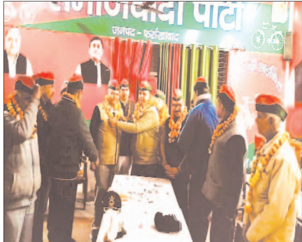
नवनिवृत्त पदाधिकारियों का स्वागत करते सैनिक प्रकोष्ठ के पदाधिकारी

फर्रुखाबाद, समृद्धि न्यूज। बैठक पार्टी कार्यालय आवास विकास पर सम्पन्न हुई। साथ ही समाजवादी सैनिक प्रकोष्ठ की