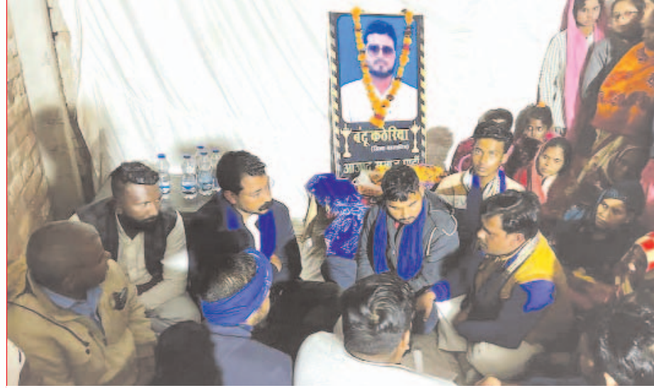
मृतक बंदूक ठेकेदारों के शोकाकुल परिजनों को डंडा बंधाते आजाद समाज पार्टी के राष्ट्रीय अध्यक्ष चन्द्रशेखर आजाद

भीम आर्मी चीफ एवं आजाद समाज पार्टी के राष्ट्रीय अध्यक्ष एंड. चन्द्रशेखर आजाद शनिवार की शाम पार्टी के जिला महासचिव मृतक बंदूक ठेकेदारों के आवास ग्राम जयसिंहपुर पहुंचे। यहां उन्होंने शोकाकुल परिजनों से मिलकर उन्हें डंडा बंधाते हुए हर संभव मदद दिये जाने का भरोसा दिया। गौरतलब है कि बीते माह आजाद समाज पार्टी के जिला महासचिव बंदूक ठेकेदारों की जमीनी विवाद के चलते उनके ही सगे चाचा द्वारा हत्या कर दी गई थी। भीम आर्मी