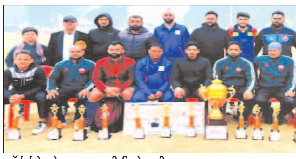
नॉर्दन रेलवे लखनऊ की विजेता टीम

फर्रुखाबाद, समृद्धि न्यूज। राज्य स्तरीय पुरुष आमंत्रण हॉकी प्रतियोगिता का फाइनल मैच एनसीआर प्रयागराज तथा नॉर्दन रेलवे लखनऊ के मध्य खेला गया। नियत समय में दोनों ही टीम में एक-एक गोल कर बराबरी पर रही। मैच का