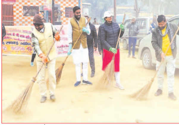
गुरसहायगंज, कन्नौज। समृद्धि न्यूज

मुख्यमंत्री के आदेश पर नगर पालिका प्रशासन द्वारा नगर में स्वच्छता तीर्थ अभियान चलाया गया। जिसमें जनप्रतिनिधियों, पालिका कर्मियों ने धार्मिक स्थलों पर झाड़ू लगाकर सफाई अभियान चलाया। जिससे तहत नगर के दो मंदिरों में साफसफाई कराई गई। रविवार की दोपहर नगर पालिका परिषद द्वारा नगर के दो मंदिरों रामगंज स्थित प्राचीन देवी मंदिर के