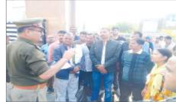
जाम लगाते लोगों से बातचीत करती पुलिस समृद्धि न्यूज

संदिग्ध परिस्थितियों में ट्रांसपोर्टर की मौत हो गई। परिजनों ने रुपये के लेनदेन में जहर देकर हत्या करने का आरोप लगाया है। पुलिस ने पोस्टमार्टम