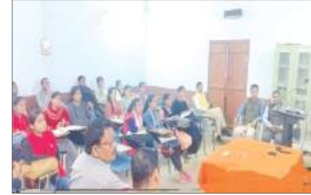
कार्यशाला में प्रशिक्षण लेते विद्यार्थी