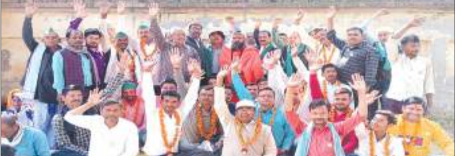
मांगों को लेकर प्रदर्शन करते भाकियू नेता