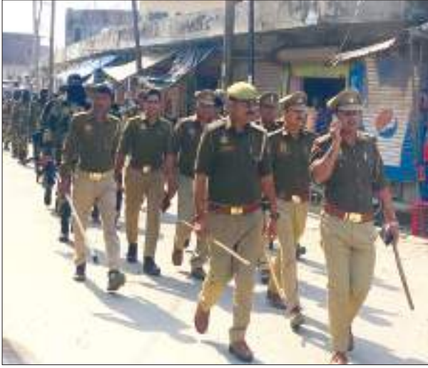
फ्लैगमार्च करती पुलिस और पैरामिलेट्री फोर्स समृद्धि न्यूज

लोकसभा चुनाव के मद्देनजर क्षेत्र में पुलिस और पैरामिलेट्री फोर्स ने मिलकर फ्लैग मार्च निकाला। फोर्स ने घनी आबादी और संवेदनशील इलाकों से गुजरते हुए असामाजिक तत्वों को कड़ा संदेश दिया कि चुनाव प्रभावित करने का प्रयास करने वालों की खैर नहीं। साथ ही आमजन को यह विश्वास दिलाया कि वे निडर होकर मतदान करें। लोकसभा चुनाव की अधिसूचना अभी जारी नहीं हुई है। इससे पहले ही पुलिस प्रशासन अपनी तैयारी को पूरता बनाने में जुट गया है। इसी के चलते सोमवार को बीएसएफ जवानों की एक कंपनी कपिल थाने पहुंची और पट्टी मढारी, कपिल, कमरुद्दीन नगर, सिरसा, विल्सडी, राईपुर चिन्हटपुर, सादनगर, इकलहरा, कटिया सहित क्षेत्र के लगभग दो दर्जन से अधिक गांवों में फ्लैग मार्च किया। इस दौरान कपिल थानाध्यक्ष और बीएसएफ कमांडेंट ने ग्रामीणों से वार्ता की और