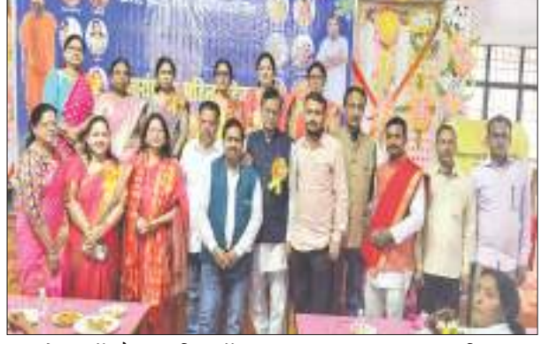
कार्यक्रम में मौजूद महिलाएँ