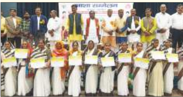
को 2 हजार तथा सर्वश्रेष्ठ बीसीपीएम प्रथम को 5 हजार रुपए पुरस्कार की प्रोत्साहन राशि वह प्रमाण पत्र दिए गए।

भूमिका होती है। उन्होंने बेटी बचाओ बेटी पढ़ाओ पर विशेष ध्यान केंद्रित किया, उन्होंने कहा कि प्रधानमंत्री ने बेटी बचाओ बेटी पढ़ाओ पर विशेष