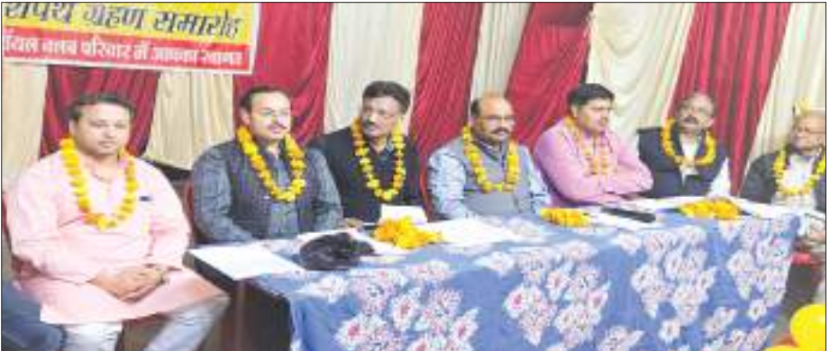
शपथ ग्रहण समारोह में मौजूद नवनिर्वाचित पदाधिकारी