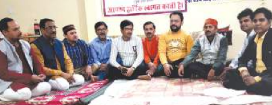
बैठक में मौजूद पदाधिकारी