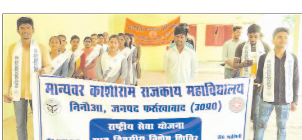
स्वच्छता जागरुकता रैली में भाग लेते स्वयं सेवक