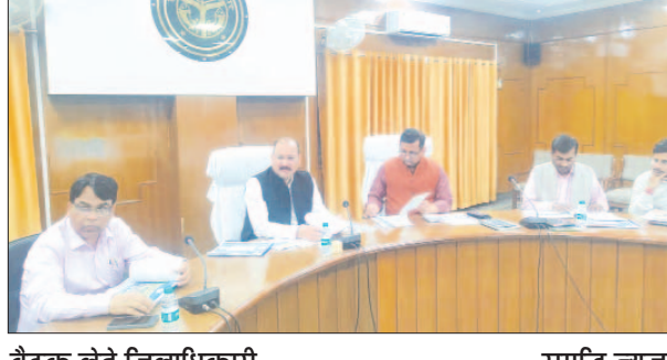
बैठक लेते जिलाधिकारी समृद्धि न्यूज़

फर्रुखाबाद, समृद्धि न्यूज़। जिलाधिकारी डॉ0 वी0के0 सिंह की अध्यक्षता में कलेक्ट्रेट सभागार में जल जीवन मिशन ग्रामीण की समीक्षा बैठक का आयोजन किया गया। बैठक में बताया गया कि जनपद में कार्य की प्रगति बहुत कम है। जिलाधिकारी द्वारा निर्देशित किया गया कि कार्य कर रही हर एजेंसी को नोटिस जारी करें और शासन को अवगत कराया जाये कि इनके द्वारा कार्य नहीं किया जा रहा है। निर्माण एजेंसी द्वारा गाँवों में सड़कें खोदकर पाइप डालने के बाद सही नहीं