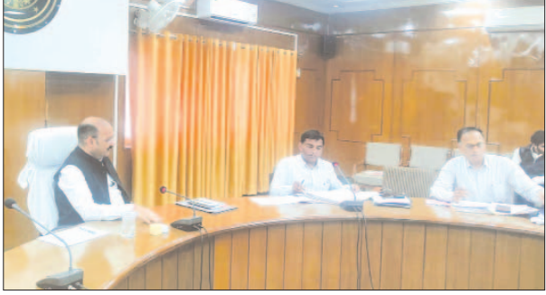
कर करेत्तर की समीक्षा बैठक लेते जिलाधिकारी