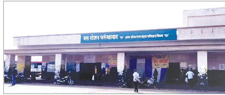
फर्रुखाबाद रोडवेज बस स्टेशन समृद्धि न्यूज़

विभिन्न बीमारियों से ग्रसित तथा काम करने में अक्षम नियमित सात चालकों को विभिन्न पटलों से हटा दिया गया है। इन्हें बसें चलाने के आदेश दिए गये। इसके बाद बस अड्डा का पूछताछ घर निजी गाड़ों के हवाले रहा।