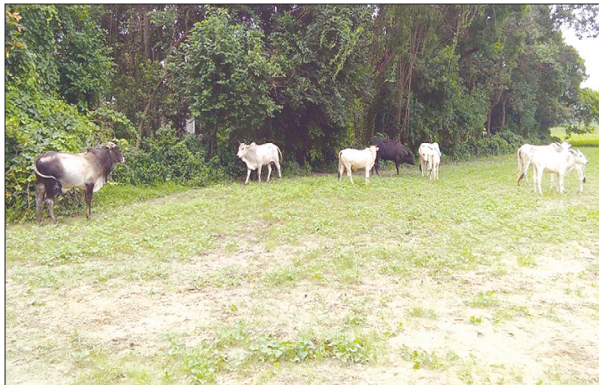
क्षेत्र में घूम रहे छुट्टा जानवर समृद्धि न्यूज़