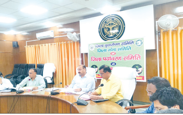
बैठक लेते जिलाधिकारी व मौजूद अधिकारीगण समृद्धि न्यूज़

जिलाधिकारी डॉ 0 वी 0 के 0 सिंह की अध्यक्षता में कलेक्ट्रेट सभागार में जिला वृक्षारोपण समिति, जिला गंगा समिति एवं जिला पर्यावरण समिति की बैठक का आयोजन किया गया। इस दौरान जिलाधिकारी ने सभी अधिकारियों को आवश्यक दिशा निर्देश दिये। जानकारी के अनुसार गुरुवार को जिलाधिकारी की अध्यक्षता में जिला वृक्षारोपण समिति, जिला गंगा समिति एवं