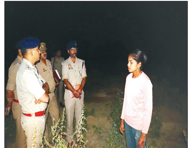
पीड़ित से पूछताछ करती पुलिस