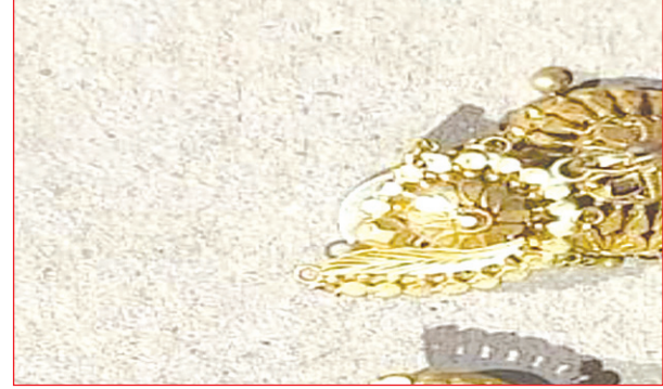
पुलिस द्वारा बरामद किये गये जेवरात