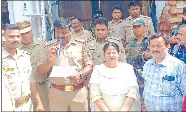
कुर्की की कार्यवाही करती पुलिस व मौजूद तहसीलदार आदि