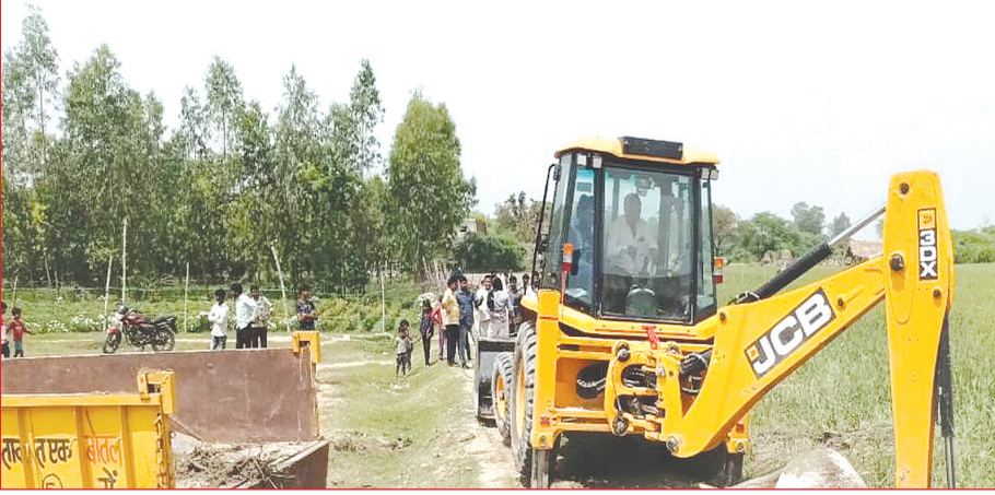
मृत अन्ना मवेशियों को जैसीबी की मदद से पोस्टमार्टम के लिए ले जाते कर्मि समृद्धि न्यूज

एएसपी, इंदरगढ़ व ठठिया थानाध्यक्ष सहित कई अफसर मौके पर पहुंचे बिजली विभाग के जेई ने दर्ज कराया मुकदमा