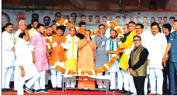
वोट की कीमत आप लोगों को समाज को बतानी होगी

उत्तर प्रदेश के मुख्यमंत्री योगी आदित्यनाथ ने गुरुवार को कहा कि वोट की ताकत ने ही अयोध्या में 500 सालों के लंबे इंतजार को खत्म कर आस्था को सम्मान दिलाया है। जानसट रोड स्थित लाला जगदीश प्रसाद स्कूल में गुरुवार को प्रबुद्ध सम्मेलन में आयोजित कार्यक्रम में भाजपा प्रत्याशी संजीव बालियान का समर्थन करते हुये श्री योगी ने कहा कि जब वोट वोट गलत हाथों में जाता था तो मुजफ्फरनगर आने से लोग डरते थे और अब जब सही हाथों में वोट गया तो अराजकता समाप्त हो गई। उन्होंने कहा कि प्रधानमंत्री नरेंद्र