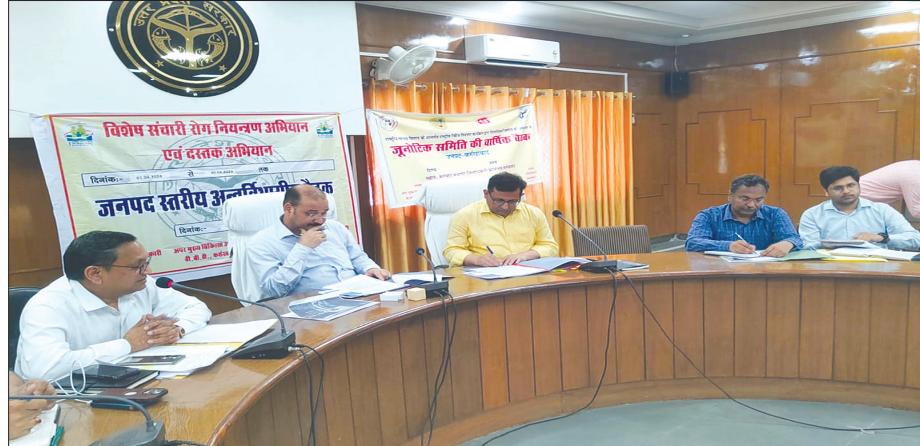
बैठक लेते जिलाधिकारी व मौजूद विभागों के अधिकारीगण समृद्धि न्यूज़

बैठक में सीएमओ ने अवगत कराया कि संचारी रोग नियंत्रण अभियान 01 अप्रैल से 30 अप्रैल तक चलेगा तथा दस्तक अभियान 10 अप्रैल से 30 अप्रैल तक चलेगा। बैठक में डीपीआरओ व ईओ को निर्देशित किया गया कि जनपद के सभी तालाबों की सफाई करा ली जाये। पशुपालन विभाग सभी सुअर पालन केंद्रों व मुर्गी पालन केंद्रों का निरीक्षण कर आवश्यक कार्यवाही करें। जिला कार्यक्रम अधिकारी को निर्देशित किया कि सभी कुपोषित बच्चों का चिन्वीकरण कर