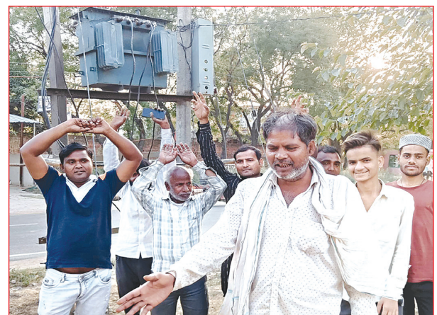
फुंके ट्रांसफार्मर के नीचे खड़े होकर प्रदर्शन करते ग्रामीण

क्षेत्र के ग्राम सभा खाडेदेवर में ग्रामवासियों की विद्युत आपूर्ति के लिए लगाया गया ट्रांसफार्मर करीब एक सप्ताह पूर्व तेज धमाके के साथ फुंक गया। जिससे ग्रामीणों सहित रोजेदारों के समक्ष पेयजल की समस्या गहरा गई और रात के अंधेरे में गुजर बसर करने को बाध्य हो गए। ग्रामीणों ने रोष व्यक्त करते हुये जिला प्रशासन से फुंक हुए ट्रांसफार्मर को बदलवाये जाने की मांग की है। सोमवार को ग्राम खाडेदेवर के बासिंदों की विद्युत आपूर्ति के लिए लगा ट्रांसफार्मर 08 दिन पूर्व तेज धमाके के साथ फुंक गया। जिस पर