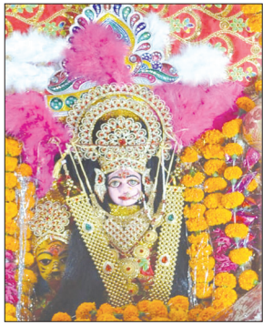
नवरात्रि की पूर्व संध्या पर गुरगांव देवी मंदिर में सजी मां दुर्गा की झांकी