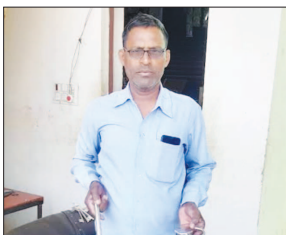
उरई, जालौन, समृद्धि न्यूज़।

नगर कोतवाली अंतर्गत मोहल्ला राजेंद्र नगर हनुमान चव्तरा समीप अज्ञात चोरों ने एक के बाद एक दो दुकानों से सोमवार की सुबह लगभग 2:00 बजे हजारों की नगदी पर होथ साफ कर लिया एक दुकान में ताला तोड़कर 4000 रुपए और कुछ सामान तो वहीं समीप की दूसरी दुकान से 2000 की नगदी सहित गुल्लक भी ले उड़े। पीड़ित दुकानदारों ने राजेंद्र नगर पुलिस चौकी में मामले की सूचना दी फिलहाल