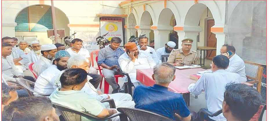
क्लीनिक पर लटका ताला तथा मौजूद टीम