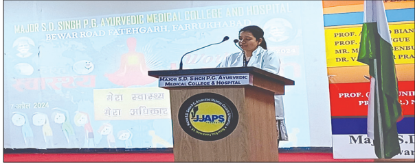
विचार व्यक्त करती छात्रा

मेजर एसडी सिंह पीजी आयुर्वेदिक मेडिकल कालेज एण्ड हॉस्पिटल बेवर रोड बजार में विश्व स्वास्थ्य दिवस मनाया गया। इस वर्ष की थीम है कि मेरा स्वास्थ्य मेरा अधिकार यह प्रत्येक वर्ष 7 अप्रैल को मनाया जाता है। आज ही के दिन 1948 में विश्व स्वास्थ्य संगठन की स्थापना हुई थी। इस दिन को मनाने का मुख्य उद्देश्य दुनिया भर के लोगों के स्वास्थ्य स्तर