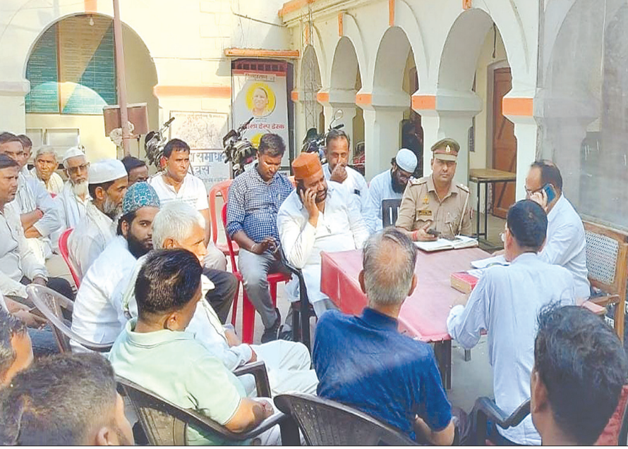
बैठक में मौजूद उप जिलाधिकारी व अन्य

सोमवार को शमशाबाद थाने में उप जिला अधिकारी कायमगंज एवं क्षेत्राधिकारी कायमगंज की उपस्थिति में पीस कमेटी की बैठक संपन्न हुई। बैठक में आगामी त्यौहारों को शांतिपूर्ण माहौल में मनाया जाने की रूपरेखा तैयार की गई। बैठक में सभी धर्म समुदाय के धर्मगुरु, संप्रदात लोग उपस्थित रहे। सभी लोगों से आगामी त्यौहारों में ईद, नवरात्रि पर्व, डॉ0 भीमराव अम्बेडकर जयंती एवं दुर्गा पूजा मूर्ति विसर्जन आदि के संबंध में विस्तार से चर्चा की गई। बैठक में उपस्थित सभी धर्म समुदाय के लोगों से उपजिलाधिकारी कायमगंज तथा क्षेत्राधिकारी कायमगंज ने अपील करते हुए कहा आगामी त्यौहारों में शांति का सहयोग दे तथा शांति के माहौल में त्यौहार की खुशियां मनाएं। उन्होंने यह भी कहा शांति में व्यवस्था में खलल डालने वाले अराजकतत्वों के खिलाफ कानूनी कार्रवाई की जाएगी। सभी लोग भाईचारे के साथ शांति के माहौल में पर्व मनाएं और एक दूसरे को खुशियों की सींगत दे