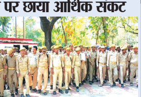
पीआरडी जवानों ने राज्यपाल को भेजा झापन

ड्यूटी आधी होने से परिवार पर छाया आर्थिक संकट