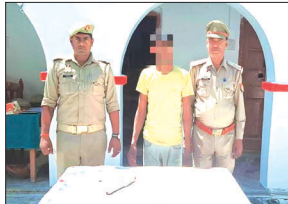
लहराते हुए फोटो वायरल होती रहती है। कारतूस, खोवा बरामद कर खामोश बैठ जाती है पुलिस

कारतूस, खोवा बरामद कर खामोश बैठ जाती है पुलिस