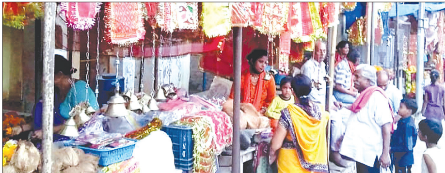
शीतला माता मंदिर के बाहर दुकानों पर बिकती पूजा सामग्री

चैत्र नवरात्रि का प्रारंभ भारतीय नववर्ष प्रतिपदा 09 मार्च से होगा। नवरात्रि की पूर्व संध्या पर जहां नगर में किराने की दुकानों पर पूजा सामग्री की बिक्री होती रही, वहीं नवरात्रि की पूर्व संध्या पर मंदिरों में भव्य सजावट