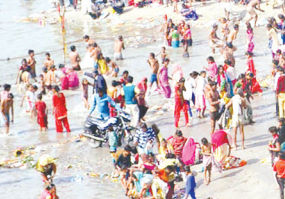
गंगा स्नान करते श्रद्धालु

सोमवती अमावस्या पर भक्तों ने गंगा में दुबकी लगायी। सुख समृद्धि की कामना करते हुए बड़ी संख्या में श्रद्धालुओं ने गंगा तट पांचाल घाट पहुंचकर स्नान किया और सूर्य भगवान को जलाईं देकर कामना मांगी। सोमवती अमावस्या का पर्व सनातन धर्म में उल्लास पूर्वक मनाया जाता है। मान्यता है कि सोमवती अमावस्या पर गंगा स्नान के साथ जो लोग व्रत रखते हैं और दान पुण्य करते हैं उनके घरों व परिवारों में सुख समृद्धि आती है और लक्ष्मी स्वयं निवास करती है। दुख, दलित्त्व अपने आप दूर भागता है। गंगा स्नान करने फर्रुखाबाद के अलावा अन्य जनपदों के लोग भी आते हैं।