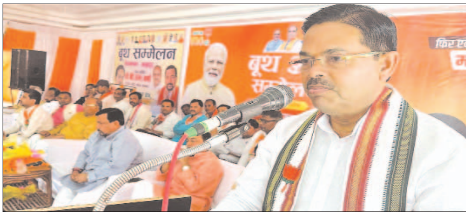
बूथ अध्यक्ष सम्मेलन को सम्बोधित करते केंद्रीय मंत्री बीएल वर्मा

वर्षों में गरीब कल्याण के लिए कार्य किया। कई साहित्यिक निर्णय भी उनकी सरकार में लिए गए जो वर्षों तक याद किए जाएंगे।