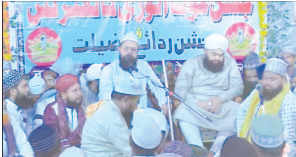
तालीमे निस्वा की चौथी पर मौजूद मौलाना