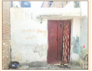
घर के बाहर दीवार पर लिखा मकान बिकाऊ है