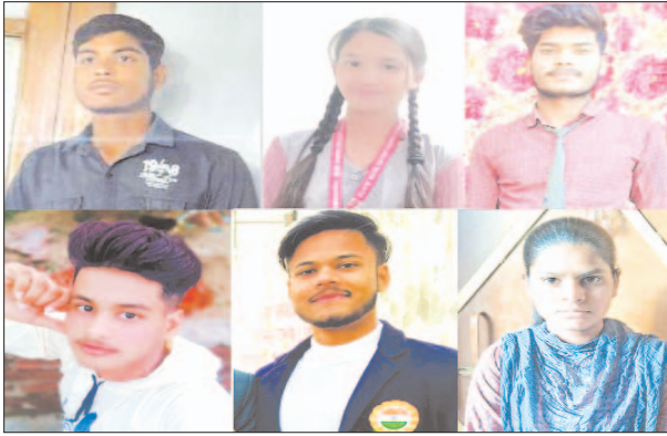
एसपीजीआर इंटर कालेज के उत्तीर्ण विद्यार्थी