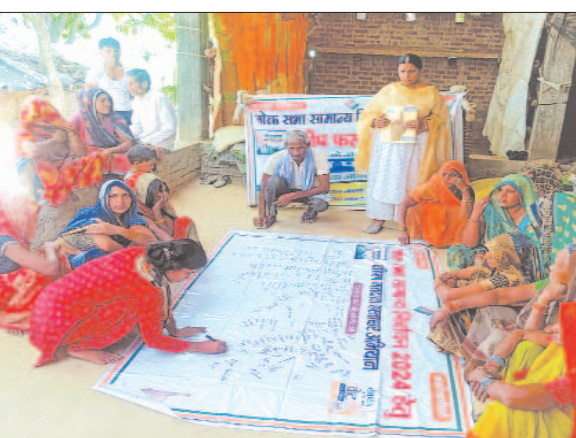
हस्ताक्षर अभियान में भाग लेती महिलायें