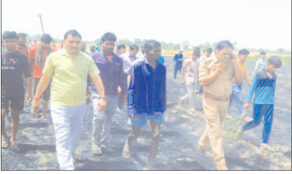
निरीक्षण कर वापस आते नगर पंचायत अध्यक्ष व थानाध्यक्ष आदि