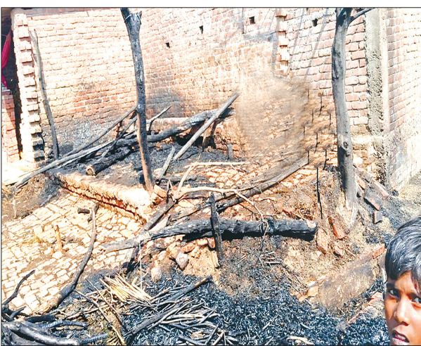
गृहस्थी का जला पड़ा सामान