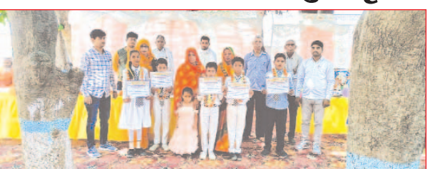
पुरस्कार वितरण समारोह में मौजूद विद्यार्थी