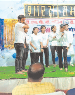
कार्यक्रम में नाटक प्रस्तुत करते छात्र-छात्रायाँ