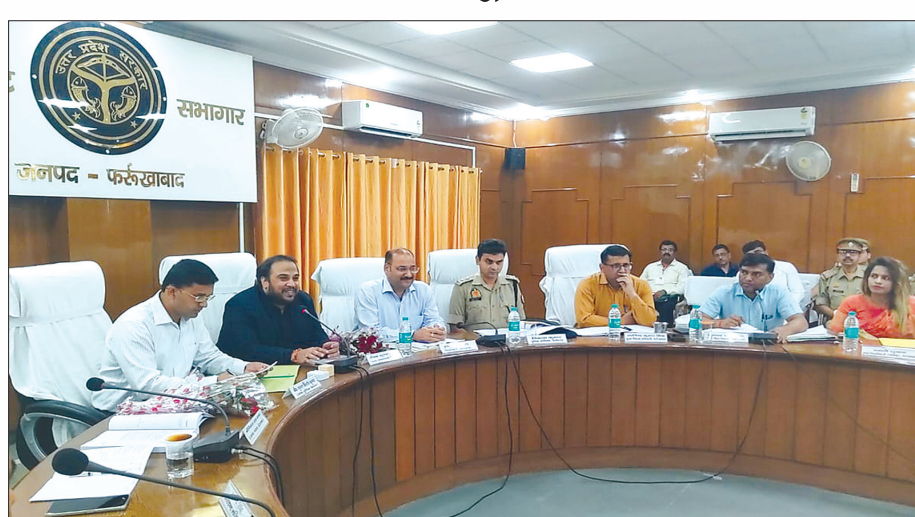
समीक्षा बैठक लेते प्रेक्षक व मौजूद अधिकारीगण