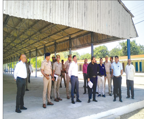
सातनपुर मंडी मतगणनास्थल का निरीक्षण करते प्रेक्षक