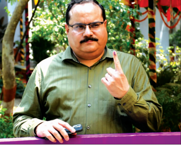
मतदान केंद्र पर निर्वाचन अधिकारी ने दिया वोट