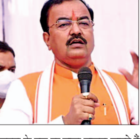
जनता के हक पर खका खलना चाहते हैं लेकिन, भाजपा ऐसा नहीं होने देगी। उन्होंने कहा कि एक तरफ भाजपा है उसने जो कहा है वो किया है वहीं दूसरी तरफ कट्टर बेईमान लोगों का समूह है, जिन्होंने 12 लाख करोड़ रुपये की लूट की है। सब आरोपी हैं, जिनमें कुछ जेल में हैं और कुछ टैम्पररी बेल पर हैं। उन्होंने कहा

बीजेपी के बढ़ते हुए जनाधार से विपक्ष चिंतित समृद्धि न्यूज़ लखनऊ/सिद्धार्थनगर। भारतीय जनता पार्टी के वरिष्ठ नेता एवं प्रदेश के उप मुख्यमंत्री केशव प्रसाद मौर्य ने सोमवार को सिद्धार्थनगर व जौनपुर में जनसभाओं को संबोधित किया। अपने संबोधन से उन्होंने कार्यकर्ताओं में उत्साह भरा। उन्होंने कहा कि 2024 के चुनाव में भारतीय जनता पार्टी 400 अंकड़ पार करके अपनी सरकार बनाएगी। भाजपा के बढ़ते जनाधार से लोग चिंतित हैं। सबसे ज्यादा चिंतित विपक्ष के लोग हैं जो देश को बेचना चाहते हैं, आम