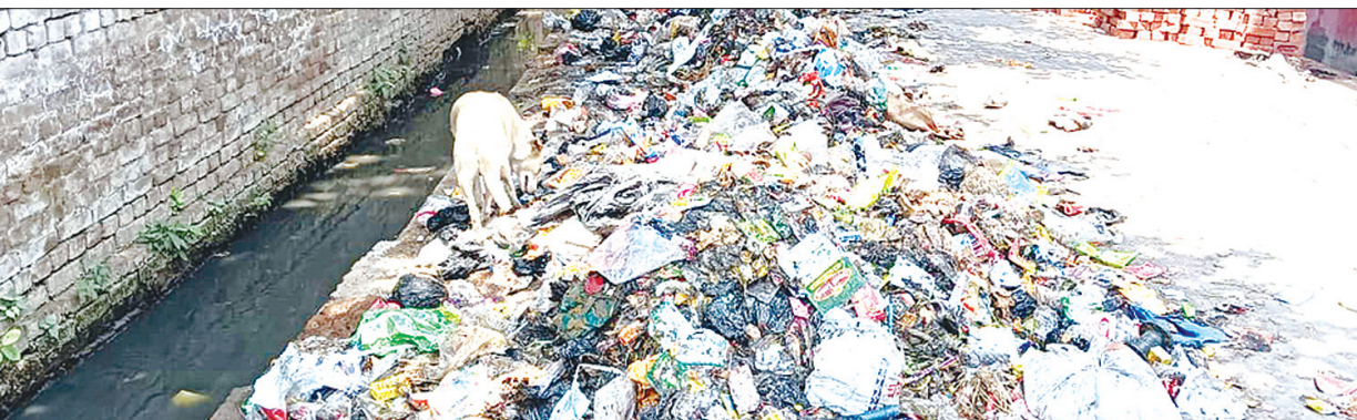
गढ़ी कोहना में लगा कूड़े का ढेर

का निकलना भी मुश्किल हो रहा है। पूरे मोहल्ले का कूड़ा एक जगह इकट्ठा होने के कारण दुर्गंध फैली हुई है। स्थानीय लोगों ने बताया कि यहां से कूड़ा अगर नहीं हटाया गया तो मजबूरन धरना देना पड़ेगा। इस संबंध में सफाई नायक से स्थानीय लोगों ने फोन पर वार्ता कर शीघ्र कूड़ा हटवावों की मांग की है।