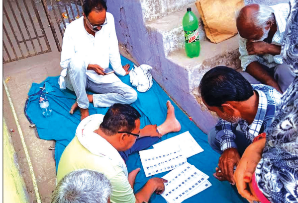
महोबा, समृद्धि न्यूज।