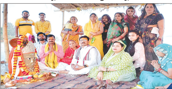
भगवान पार्थिवेश्वरनाथ की पूजा अर्चना करते भक्तगण