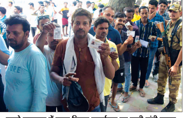
पुराने लखनऊ में नगर निगम कार्यालय पर लगी लंबी लाइन