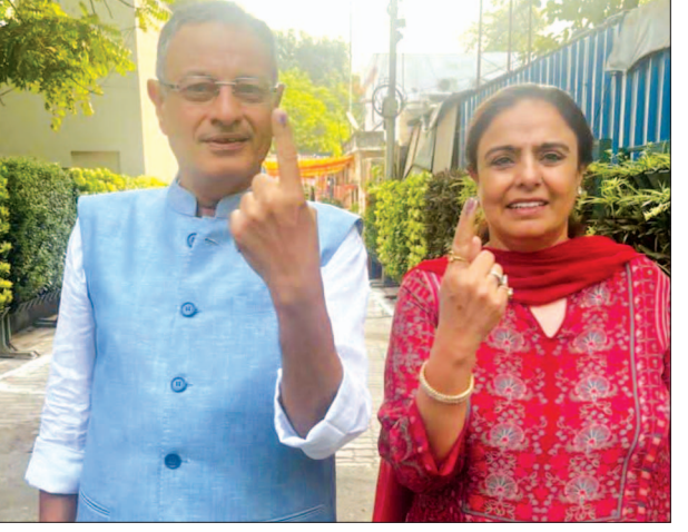
भाजपा से राज्यसभा सांसद संजय सेठ ने किया मतदान