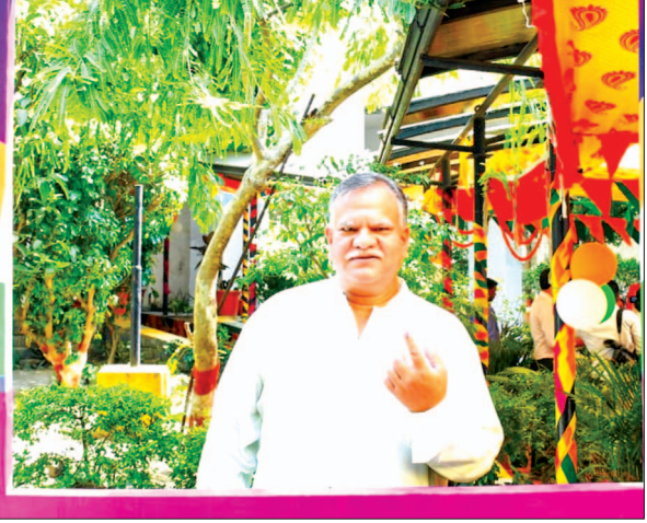
सीएससी टावर में मतदान केंद्र में कृषि उत्पादन आयुक्त मनोज सिंह