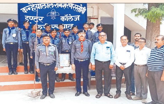
स्काउट गाइड कार्यक्रम में मौजूद लोग

रस्तोगी इंटर कालेज में स्काउट दीक्षा कार्यक्रम सम्पन्न