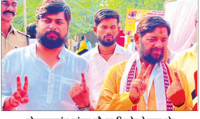
मोहनलालगंज सांसद कौशल किशोर ने डाला वोट