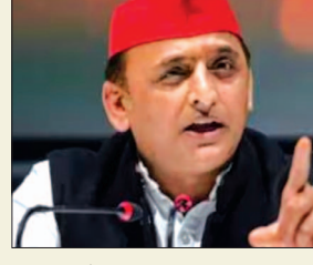
का है और इसके लिए हर वर्ग के लोग एक साथ आ गए हैं। जनता इस बार इन्हें 140 सीटों के लिए भी तरसा देगी। उन्होंने कहा कि इन्होंने आपके 10 साल नहीं बर्बाद किए हैं आपका एक तिहाई जीवन बर्बाद किया है। बस्ती में अखिलेश यादव ने कहा, मैंने नौजवानों को हर सभा में कहा है कि आपके 10 साल नहीं बर्बाद किए हैं आपका एक तिहाई

समृद्धि न्यूज़ लखनऊ/सिद्धार्थनगर। समाजवादी पार्टी प्रमुख अखिलेश यादव सोमवार को पूर्वांचल दौरे पर थे। उन्होंने जनपद बस्ती, सिद्धार्थनगर, दुमरियागंज और संतकबोरनगर ने जनसभाएं कर इंडिया गठबंधन के प्रत्याशियों के पक्ष में चुनावी माहौल बनाने की कोशिश की। सपा चीफ अखिलेश यादव ने जहां बीजेपी पर हमला बोला वहीं बीएसपी को भी आड़े हाथों लिया। सिद्धार्थनगर में अखिलेश ने कहा, भाजपा सरकार बदलने जा रही है, 10 साल सरकार ने किसान, नौजवान, व्यापारी के साथ भेदभाव किया है, यह चुनाव संविधान बचाने