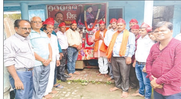
फूलन देवी की जयंती मानते निषाद पार्टी के लोग