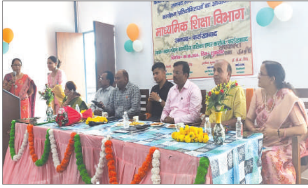
कार्यक्रम में मौजूद अतिथि व अन्य