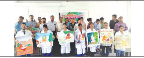
पोस्टर प्रतियोगिता में भाग लेंती छात्राएँ समृद्धि न्यूज़