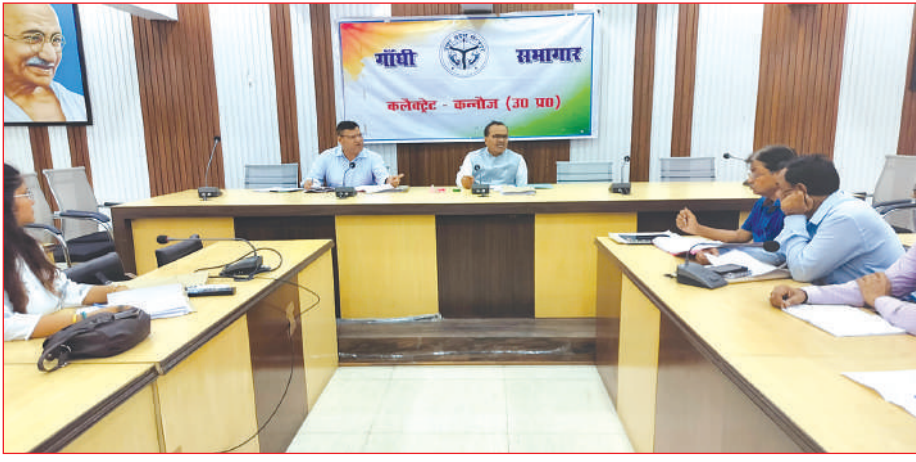
बैठक में निर्देश देते जिलाधिकारी

डीएम ने गांधी सभागार में जले हुए गांव के भू-अभिलेख और रिकॉर्ड ऑपरेशन ग्राम (सर्वे) के संबंध में की बैठक