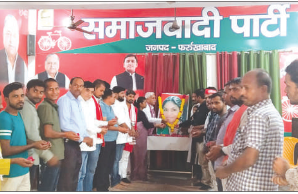
फूलन देवी की जयंती मनाते सपाई