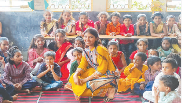
फैसी ड्रेस प्रतियोगिता में भाग लेते बच्चे समृद्धि न्यूज़

सत्य भारती स्कूल ज्योना में सांस्कृतिक कार्यक्रमों के साथ बाल संसद, बाल सभा एवं हाउस एक्टिविटी, फैसी ड्रेस प्रतियोगिता का आयोजन किया गया। जिसमें बच्चों ने बड़-चढ़कर भाग लिया। जानकारी के अनुसार भारती एयरटेल फाउंडेशन द्वारा संचालित सत्य भारती स्कूल ज्योना में बच्चों द्वारा विभिन्न सांस्कृतिक कार्यक्रमों के साथ बाल संसद, बाल सभा का आयोजन किया गया। इस अवसर पर बच्चों ने विभिन्न प्रकार की पारंपरिक एवं सांस्कृतिक परिधानों को पहनकर कार्यक्रम को सफल बनाया। इसके