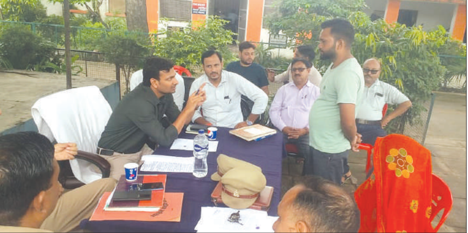
समस्यायें सुनते तहसीलदार व मौजूद प्रभारी निरीक्षक समृद्धि न्यूज़