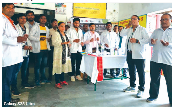
Galaxy S23 Ultra