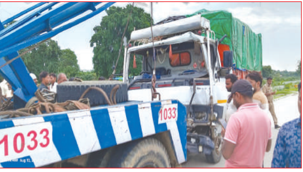
जलालाबाद, समृद्धि न्यूज

कस्बा के निकटतम नेशनल हाइवे पर शनिवार को करीब चार बजे कन्नौज की ओर जा रही पिकअप का टायर फट गया। जिससे पिकअप अनियंत्रित होकर डिवाइडर से टकरा गयी। उसी के पीछे आ रही डीसीएम की पीछे से भिड़त गयी। डीसीएम की इतनी तेज रफ्तार थी वह डिवाइडर तोड़ दूसरी ओर आ गयी।