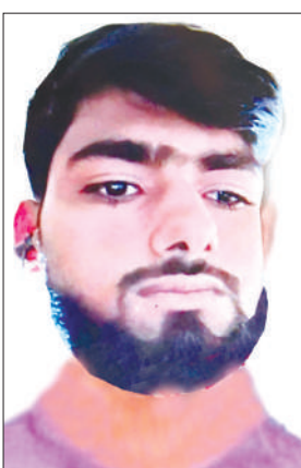
मृतक का फाइल फोटो

बीती रात बाइक सवार कांवड़िये की मार्ग दुर्घटना में मौत हो गयी, जबकि उसका साथी गम्भीर रूप से घायल हो गया। पुलिस ने शव का पंचनामा भरकर पोस्टमार्टम के लिए भेज दिया।