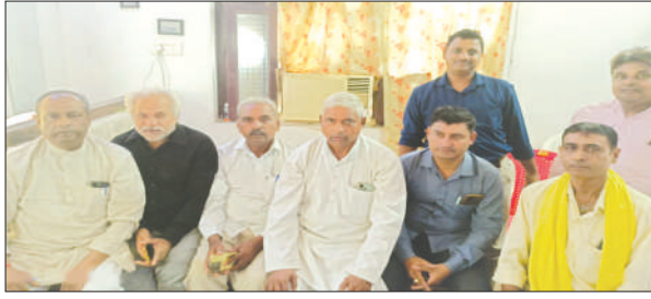
वार्ता में मौजूद लोधी समाज के लोग