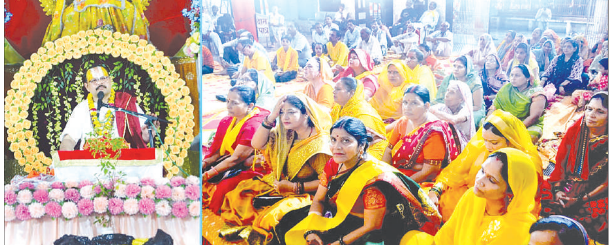
कल्याण का भाव ही हमारी सनातनी परंपरा की पहचान है। सम्पूर्ण विश्व में केवल सनातन धर्म ही कहता है की सभी सुखी हों सभी शांतिपूर्वक रहे, सबका मंगल हो, चारों ओर शांति हो, परंतु आज विडंबना है दुनिया में कुछ राक्षसी मत के अनुयायियों द्वारा अत्याचार इस कदर बढ़ रहा है की संपूर्ण दुनिया त्राहि त्राहि कर उठी है।

सत्कर्म ही, हमारा नाम जप ही हमारे काम आएगा। यह संसार तो गुण और दोष मय है। हमें ऐसे साधन करने होंगे जिससे इस दुखमय संसार को पार कर कर जाएं। आगे बताया की शिवभक्त वही हैं जिसके हृदय में जगत व अपनों के साथ ही नहीं, बल्कि अपने दुश्मनों के प्रति भी कल्याण का भाव रहता हो और यही