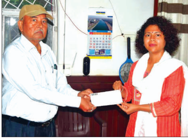
खेत में जमी सिल्ट की मोटाई 3 सेमी होने पर दिया जा रहा मुआवजा

लखीमपुर खीरी के 311 किसानों को दी गई सहायता धनराशि, लाभार्थियों ने बताया सीएम का आभार