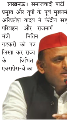
लखनऊ। समाजवादी पार्टी के प्रमुख और यूपी के पूर्व मुख्यमंत्री अखिलेश यादव ने केंद्रीय सड़क परिवहन और राजमार्ग मंत्री नितिन गडकरी को पत्र लिखा कर राज्य के विभिन्न एक्सप्रेस-वे का

निर्माण पूरा करने की मांग की है। उन्होंने भारत सरकार की ओर से पहले से स्वीकृत उत्तर प्रदेश के विकास को गति प्रदान करने और नए एक्सप्रेस-वे और सड़कों का निर्माण करने की बात कही है। सपा मुखिया अखिलेश यादव ने पत्र में लिखा-भारतीय राष्ट्रीय राजमार्ग प्राधिकरण द्वारा स्वीकृत संरक्षण, इटावा (उत्तर प्रदेश) और कोटा (राजस्थान) को जोड़ने वाले 408.77 किलोमीटर लंबे चंबल एक्सप्रेस-वे का निर्माण कार्य पूरा किया जाए। मध्य प्रदेश के ग्वालियर से