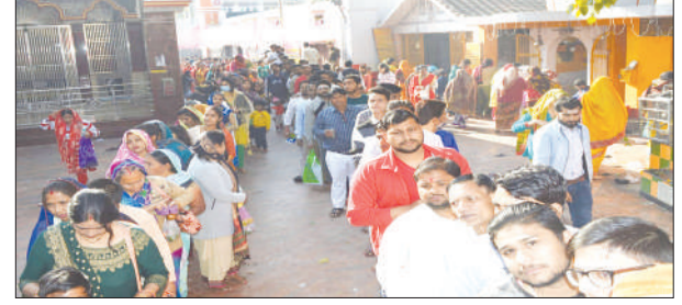
पंडाबाग मंदिर में लाइन में लगे भक्तगण

आज सावन का चौथा सोमवार होने के चलते नगर के शिवालयों में पूजा अर्चना करने के लिए भक्तों की भारी भीड़ उमड़ी। भक्तों ने श्रद्धाभाव से भगवान शिव का अभिषेक कर विल्वपत्र, भांग, धतूरा, पुष्प, शहद,