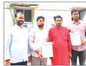
दूर-दूर से लगभग हजारों मरीज इलाज कराने आते हैं। अस्पताल के अंदर मरीजों एवं तीमारदारों को बड़ी समस्याओं का सामना करना पड़ता है। खासतौर से अस्पताल के मेन गेट से ओपीडी बिल्डिंग तक सड़क ध्वस्त हो गई है। इसमें बड़े-बड़े गड्डे हो गए हैं। परिस्तर में लगातार कई वर्षों से गंदे पानी का भराव हो रहा है। परिस्तर के