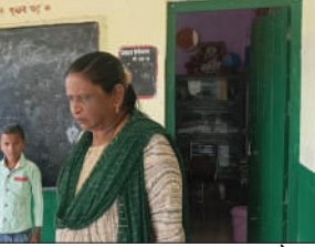
कालपी, जालौन समृद्धि न्यूज़।

सोमवार को उप जिलाधिकारी ने प्राथमिक विद्यालय का सुबह औचक निरीक्षण कर अभिभावक से मिलकर छात्र-छात्राओं की उपस्थिति बढ़ाने के लिए निर्देश दिए। सोमवार के दिन उप विद्यालय में मौजूद शिक्षिकाओं से कड़े लहजे में कहा कि जो विद्यालय की उपस्थिति रजिस्टर में पंजीकृत छात्र-छात्राएं हैं।