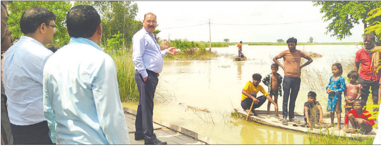
नाव से जायजा लेते जिलाधिकारी

बांटी राहत सामग्री, परकोपाइन बनाने के लिए सर्वे करने के दिने निर्देश