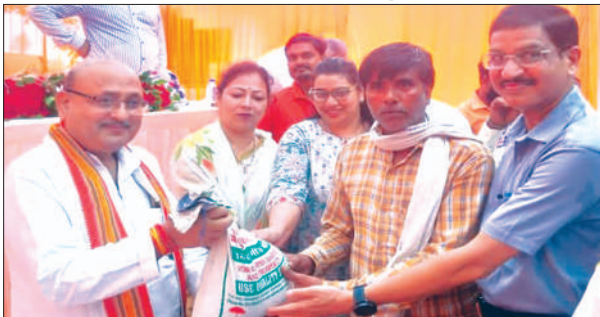
सिरौलीगौसपुर बाराबंकी, समृद्धि न्यूज़।