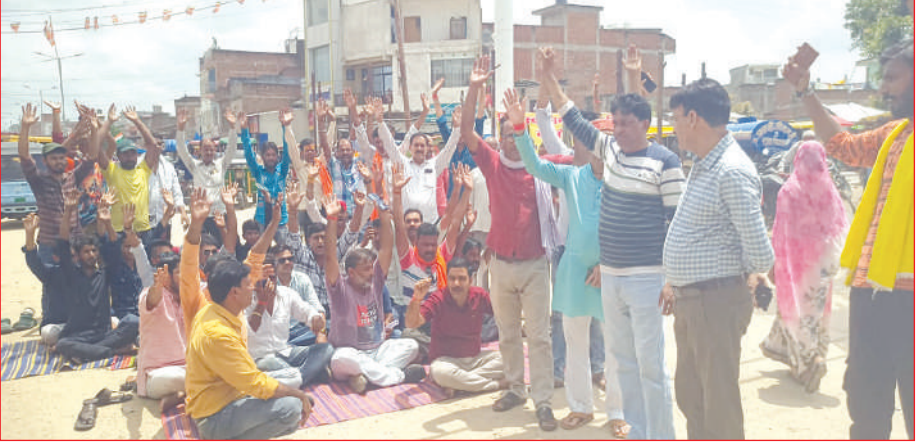
छिब्रामऊ कन्नौज। समृद्धि न्यूज

हिंदू स्वाभिमान समिति के बैनर के तले युवाओं ने बांग्लादेश में हिंदुओं पर हो रहे अत्याचार के विरोध में प्रधानमंत्री संबोधित लिखित ज्ञापन उप जिलाधिकारी को सौंपा। हिंदू स्वाभिमान समिति के बैनर के तले युवाओं ने बांग्लादेश में हिंदुओं पर हो रहे अत्याचार के विरोध में प्रधानमंत्री संबोधित लिखित ज्ञापन में कहा गया है कि बांग्लादेश में राजनीतिक