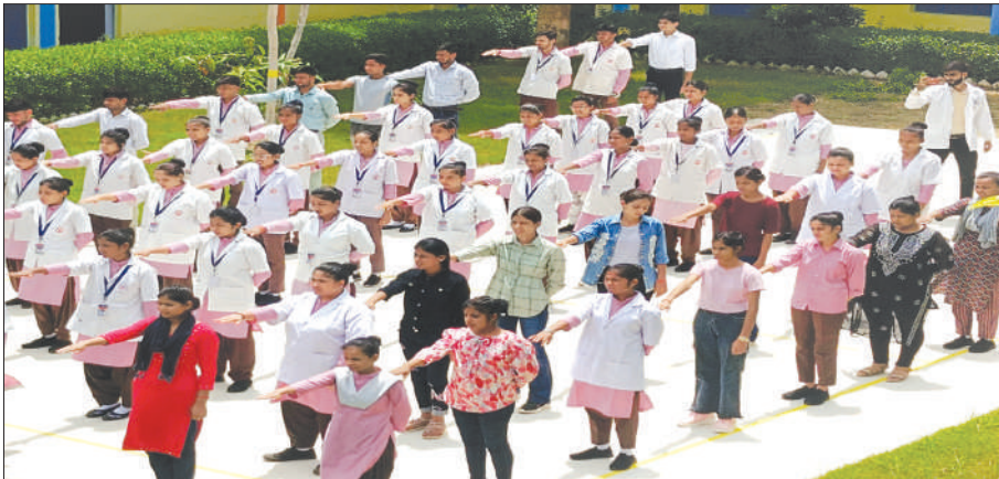
नर्सिंग कालेज में नशा मुक्ति की शपथ लेती छात्राओं