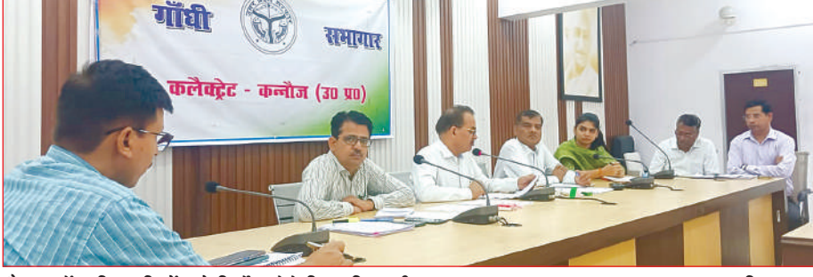
बैठक में अधिकारियों को निर्देश देते जिलाधिकारी