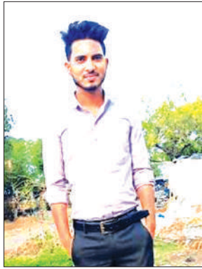
जिले में बाढ़ आ गई है। मामला जनपद के नसीराबाद थाना क्षेत्र का है जहां दलित युवक की गोली मारकर

गोली मारकर हमलावर मौके से हुए फरार सूचना पर पहुंची पुलिस जांच पड़ताल में जुटी