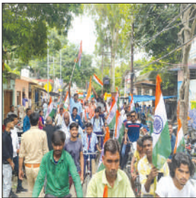
तिरंगा यात्रा बाइक रैली निकालते युवा