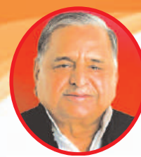
मुलायम सिंह यादव