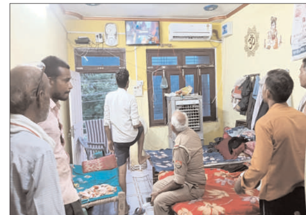
सी.सी.टी.वी. फुटेज देखती पुलिस

पीड़ित ने दी तहरीर, पुलिस ने खंगाले सीसीटीवी कैमरा