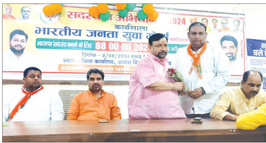
सांसद का स्वागत करते भाजयुमो जिलाध्यक्ष