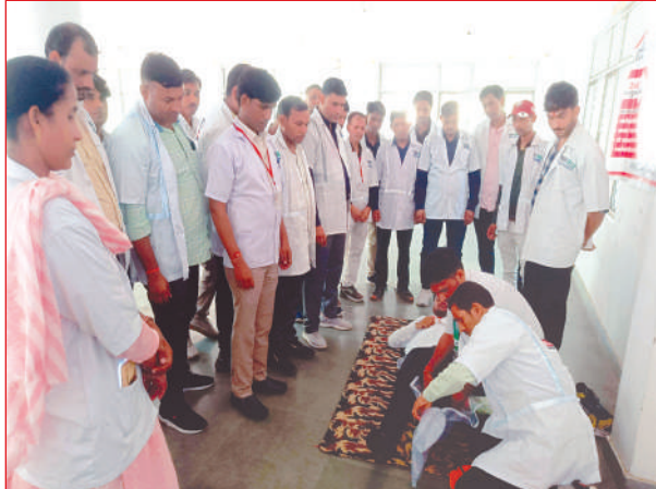
एम्बुलेंस कर्मियों को ट्रेनिंग देते प्रशिक्षक