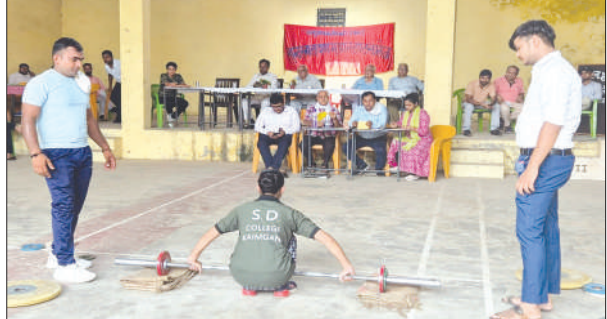
भारोत्तोलन प्रतियोगिता में भाग लेते विवालाड़ी