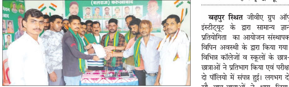
नवनियुक्त पदाधिकारियों को मनोनयन पत्र सौंपते जिलाध्यक्ष