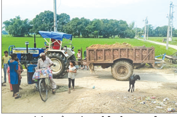
खनन करने के बाद ट्रैक्टर से जा रही मिट्टी

एक सिपाही की मौत के बाद भी क्षेत्र में मिट्टी का अवैध खनन रुकने का नाम नहीं ले रहा है। रात की बात छोड़ो, दिन के उजाले में खनन माफियाओं द्वारा मिट्टी का खनन किया जा रहा है। इसके बावजूद भी प्रशासन की नौद नहीं टूटी है। नवाबगंज थाना क्षेत्र के कस्बा तथा आसपास के ग्रामीण इलाकों में खनन माफियाओं द्वारा अवैध खनन जोरों पर किया जा रहा है। इसके बावजूद भी जिला प्रशासन की नौद नहीं टूट रही है। राजस्व विभाग तथा खनन अधिकारी सहित पुलिस विभाग की नाक के नीचे हो रहे खनन से सभी अनभिज्ञ बने हुए हैं। वहीं खनन माफिया अपने कार्य को लगातार अंजाम दे रहे हैं। बताते चलें कि बीते