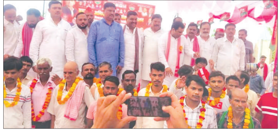
हैदराबाद बाराबंकी समृद्धि न्यूज़