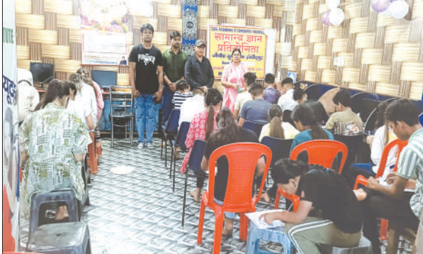
सामान्य ज्ञान परीक्षा में भाग लेते बच्चों