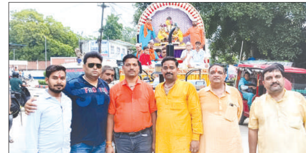
गणेश शोभायात्रा में भाग लेते भक्तगण