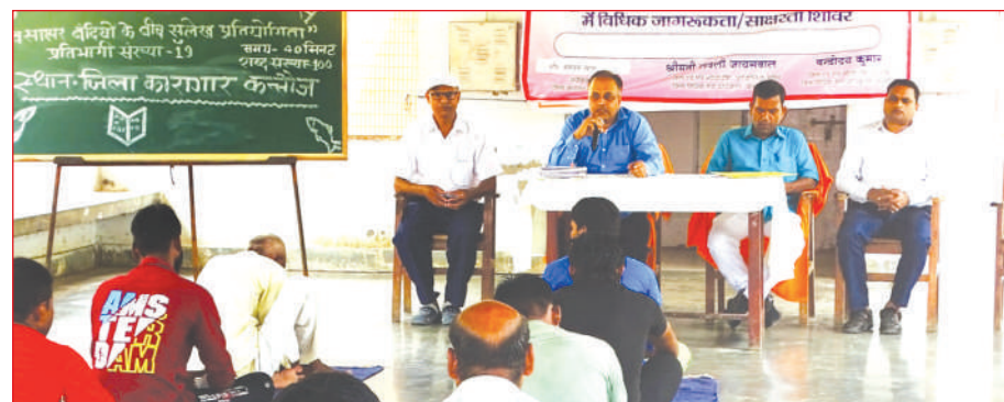
प्रतियोगिता में प्रतिभाग करते बंदी