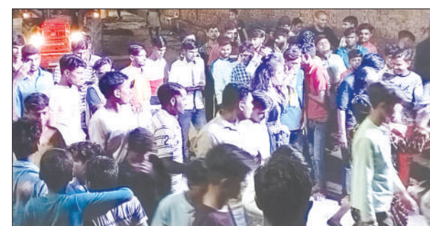
शोभायात्रा में मौजूद भक्तगण

शमशाबाद, समृद्धि न्यूज़ नगर में भगवान गणेश शोभायात्रा धूमधाम से साथ निकाली गई। डीजे की धुन पर श्रद्धालु थिरके। गणेश