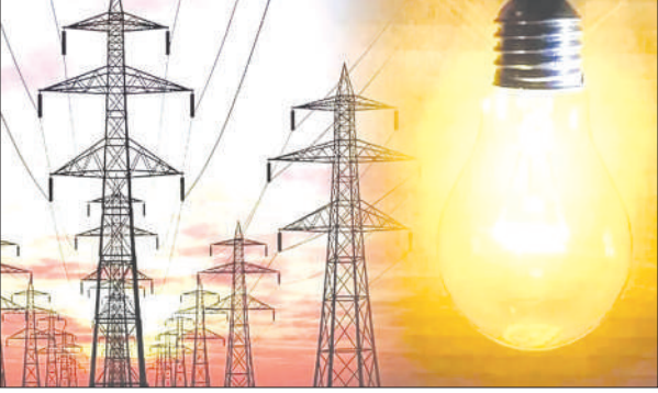
33 हजार केवीए की विद्युत लाइन

लगभग 68 किलोमीटर क्षेत्रफल में पड़ोसी बिजली लाइन विद्युत विभाग को मिला बजट, जल्द ही डाला जाएगा टेंडर