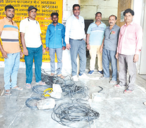
टीम द्वारा उखाड़े गये मीटर व जब्त की गयी केबिल