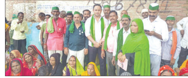
हैदराबाद बाराबंकी समृद्धि न्यूज़