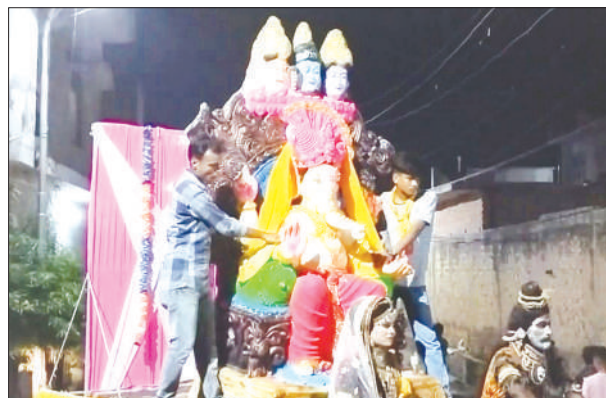
शोभायात्रा में भगवान गणेश की प्रतिमा