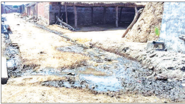
छैरासी के गदियाना गांव में सड़क पर बहता नालियों का पानी

ग्राम पंचायत छैरासी में तैनात सफाई कर्मी के न पहुंचने से गांव में बजबजती नालियां, कूड़ा करकट और गंदगी ग्राम पंचायत छैरासी के मजरा गदियाना की पहचान बन चुकी है। यहां कर्मचारी और अधिकारी सरकारी स्वच्छता अभियान को पत्तीला लगा रहे हैं।