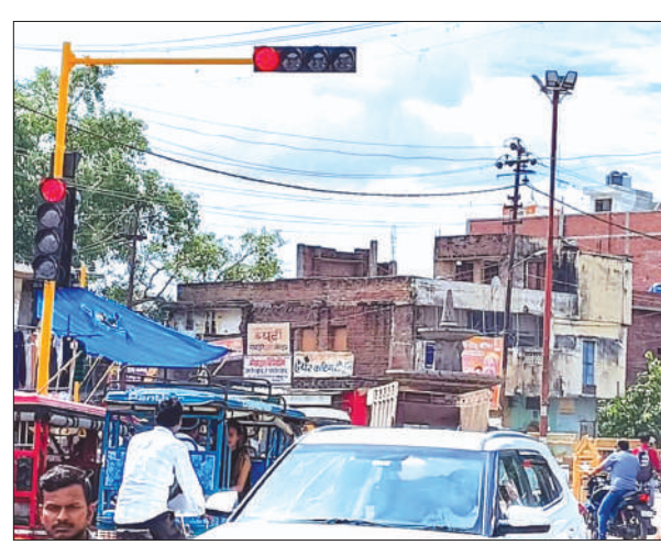
लालगेट पर रेड सिग्नल होने पर भी वाहनों आवागमन जारी

ऐसे में ट्रैफिक व्यवस्था की खुलेआम ध्वज्या उड़ान यहां के लोगों की आहत बन गयी है। जबकि रेड लाइट का पालन कराने के लिए