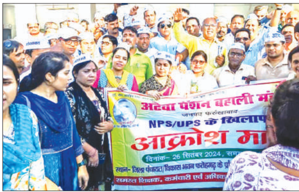
ज्ञापन देने के दौरान मौजूद शिक्षक व कर्मचारी

अब सरकार एनपीएस की जगह यूपीएस लेकर आयी है। जिससे शिक्षक व कर्मचारी चिंतित हैं। पुरानी पेंशन व्यवस्था ही कर्मचारियों के बुढ़ापे का सहारा है। बड़ी संख्या में विरोध प्रदर्शन करते हुए आक्रोश मार्च में शामिल हुए। आक्रोश मार्च में जनपद के विभिन्न संगठन लेखपाल संघ, पीडब्ल्यूडी कर्मचारी, विश्व विद्यालय शिक्षक महासंघ, जूनियर