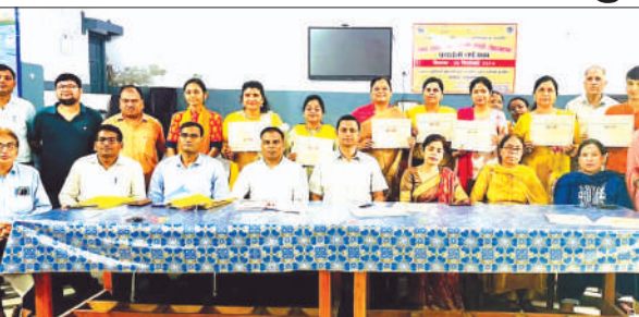
प्रधान पत्र के साथ शिक्षकगण