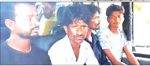
बढ़तेती देखने को मिल रही थी चोरी