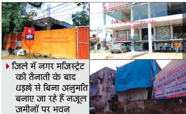
जिले में नगर मजिस्ट्रेट की तैनाती के बाद धड़ले से बिना अनुमति बनाए जा रहे हैं नजूल जमीनों पर भवन

गोण्डा स्टेशन रोड दुखहरण नाथ मंदिर सत्यनारायण मंदिर के बगल बिना मानचित्र के एक मजिस्ट्रेट इमारत बनकर खड़ी हो गई है और दूसरे की अब तैयारी चल रही है। शहर में अनियोजित विकास की, जिसने शहर का नक्शा तेजी से बदल रहा है। शहर में कई मल्टी स्टोरी और बहुमंजिला व्यवसायिक इमारतें नगरपालिका की बिना अनुमति और स्वीकृति के बिना नियम कायदों को दरकिनार कर धड़ले से बनाई जा रही हैं, लेकिन नगर पालिका और जिला प्रशासन इसकी तरफ आंख मूंदे हुए बैठे हैं।