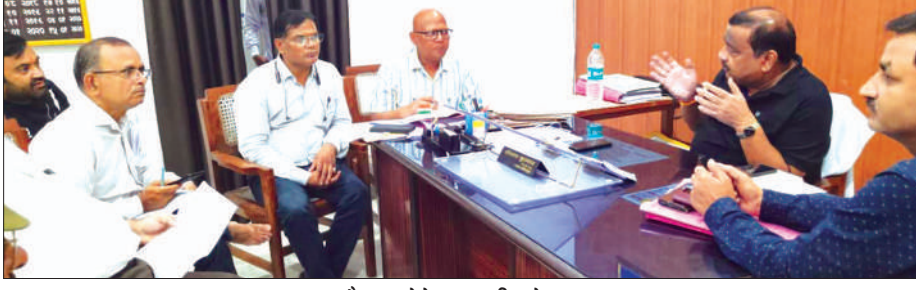
बैठक लेते नगर मजिस्ट्रेट

▶ बोलें सड़क किनारे की जा रही वाहन पार्किंग पर की जाये कठोर कार्रवाई ▶ ई-रिवक्शा चालकों को रूट निर्धारित कर दिया जायेगा कलर कोड