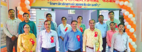
डायट कार्यालय में मौजूद प्राचार्य व अन्य