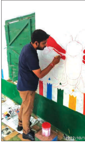
उन्की समझ में गहराई और विषयों में रुचि बढ़ी है।