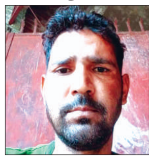
अजय की फाइल फोटो

बुधवार को लोगों को अर्चभित करने वाले घटनाक्रम में ग्राम भदेख निवासी 40 वर्षीय ग्रामीण ने शेरान्हा घाट पर बने यमुना पुल से नदी में मौत की छलांग लगा दी। जैसे ही उक्त नजारा मौके पर उपस्थित लोगों ने देखा तो वह सकते में आ गये और फिर आनन फानन में कुठैंद थाना पुलिस को सूचना दी जिससे मौके पर पहुंची थाना पुलिस ने प्राइवेट गोताखोरों को नदी में छलांग लगाने वाले की खोजबीन के उतारा लेकिन समाचार लिखे जाने