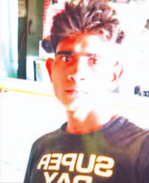
मृतकों के फाइल फोटो

सड़क हादसे में बाइक सवार पति-पत्नी तथा मासूम सहित तीन लोगों की दर्दनाक मौत हो गयी, जबकि भतीजी सहित दो लोग घायल हो गये। उधर सड़क दुर्घटना में मौत के शिकार हुए दंपति तथा मासूम का शव आते ही घर परिवार में कोहराम मच गया।