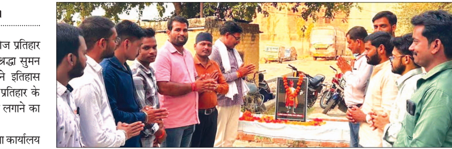
मिहिर भोज की जयंती मनाते करणी सेना के लोग