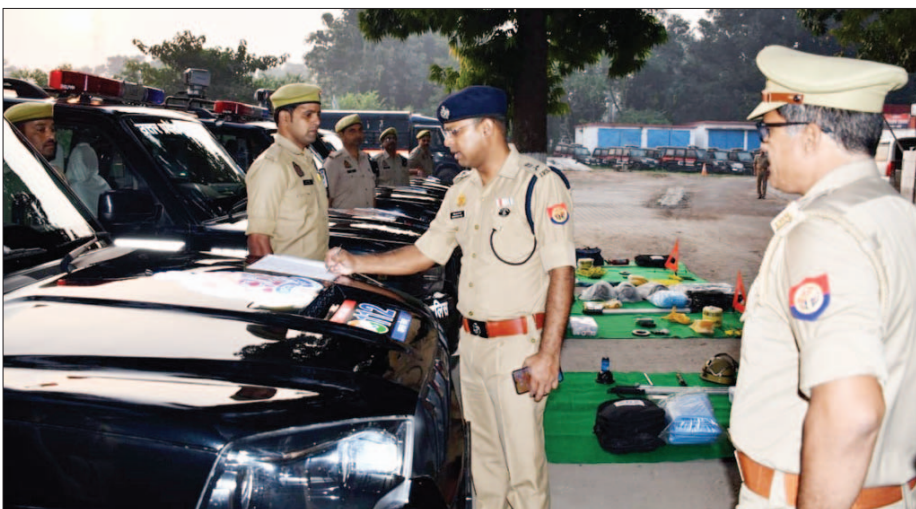
सुथरी एवं स्वच्छ बर्दी धारण करने तथा नियमित रूप से टर्नआउट मेंटेन करने हेतु निर्देशित किया गया। तत्पश्चात क्वार्टर गाई, एमटी शाखा, यूपी 112 पीआरबी, मेस, बैक आदि का निरीक्षण किया गया। यूपी 112 पीआरबी में मौजूद दंगा