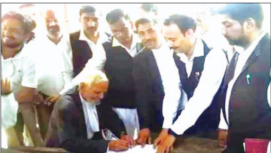
एलडस कैमेटेई के समक्ष मौजूद अधिवक्तागण