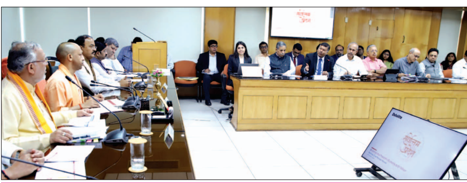
यूपी में 2250 घरेलू बायो गैस संयंत्रों की स्थापना को मिली मंजूरी

बैठक में मुख्यमंत्री ने सभी 10 सेक्टरों में जारी कार्यों की समीक्षा की। कंसल्टिंग एजेंसी डेलॉयट इंडिया ने विस्तार से प्रदेश के आर्थिक परिवेश की वर्तमान स्थिति और संभावित भावी परिणाम, उद्योग जगत की अपेक्षाओं आदि के संबंध में सेक्टरवार विस्तार से जानकारी दी। मुख्यमंत्री योगी आदित्यनाथ ने कहा कि विगत 07 वर्षों के नियोजित प्रयासों से उत्तर प्रदेश की अर्थव्यवस्था आज सार्वकालिक