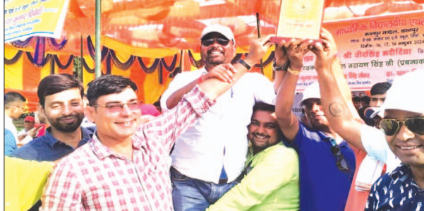
चैम्पियनशिप की ट्राफी के साथ जश्न मनाते कन्नौज के खिलाड़ी व शिक्षक

► सीओ तिर्वा ने विजेता छात्र-छात्राओं को प्रमाण पत्र देकर किया सम्मानित तिर्वा, समृद्धि न्यूज।