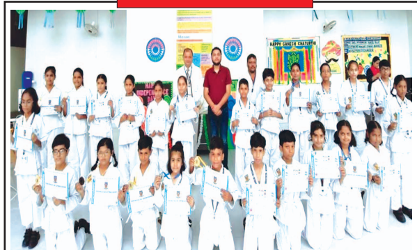
प्रमाण पत्र के साथ मौजूद बच्चे