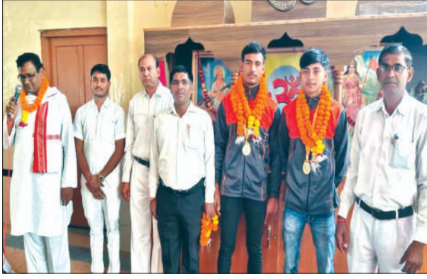
सभागार में दोनों छात्रों को सम्मानित करते प्रधानाचार्य व अन्य शिक्षक

कार्यक्रम का आयोजन कर दोनों छात्रों को किया गया सम्मानित। मध्य प्रदेश के सतना में आयोजित हुई थी 35वीं अखिल भारतीय खेलकूद प्रतियोगिता।