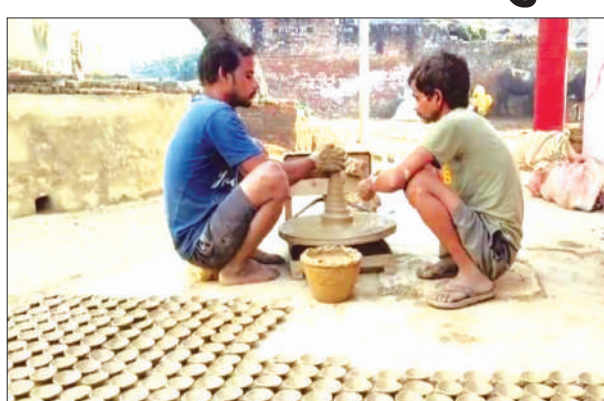
चाक से दीपक बनाते कुम्हार

जलालाबाद, समृद्धि न्यूज। दीपों का त्योहार दीपावली कुछ दिन ही शेष है। दीपावली पर्व की तैयारियों को लेकर कुम्हार के चाक ने रफतार पकड़ ली है। दीप पर्व पर घर-घर मिट्टी के दीपक जलाने का अलग ही महत्व है। इससे घर- आंगन तो रोशन होता ही है। इसके साथ ही हमारे घरों में भी समृद्धि की रोशनी आती है। हमारे घरों में समृद्धि की रोशनी लाने के लिए इन दिनों कुम्हार चाक पर दीपक गढ़ने में जुटे हुए हैं। कस्बा में कुं लोकर दीपोत्सव की तैयारी रफतार पकड़ ली है। दीप पर्व पर घर-घर मिट्टी के दीपक जलाने का अलग ही महत्व है। इससे घर- आंगन तो रोशन होता ही है। इसके साथ ही हमारे