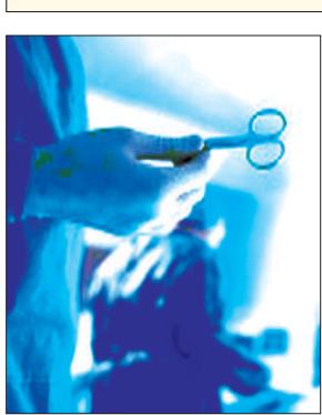
एक क्लीनिक पर ले गई जहां पर महिला की सफाई कर दी जिससे महिला की छोटी आंत वी बचचेदानी