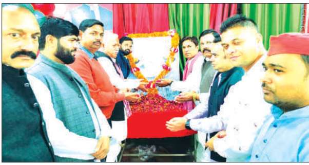
मुलायम सिंह यादव के चित्र पर पुष्पांजलि अर्पित करते सपाईं

स्वर्गीय नेताजी मुलायम सिंह यादव के चित्र पर पुष्पांजलि अर्पित कर उन्हें याद किया गया। साथ ही कार्यालय के बाहर भण्डारे का आयोजन किया गया और लोहिया अस्पताल में नेता जी के जन्मदिन पर मरीजों को फल वितरित किये गये। पार्टी कार्यालय पर गोष्ठी की