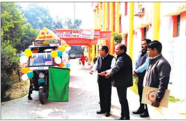
सारथी वाहन को झंडी दिखाकर रवाना करते सीएमओ

कुल 23 सारथी वाहन जनपद के सातों ब्लॉकों में और नगरीय क्षेत्र में भ्रमण कर परिवार नियोजन के प्रति जागरूकता फैलाएंगे। छोटे परिवार के फायदे बताते हुए परिवार नियोजन के