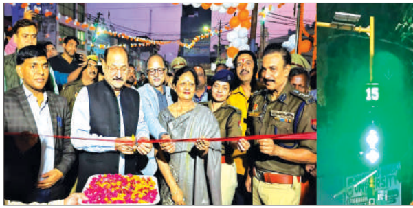
उद्घाटन करते डीएम व लगाया गया इलेक्ट्रॉनिक सिग्नल