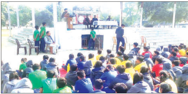
यातायात नियमों की जानकारी देती सीओ हिंदी

केंद्रीय विद्यालय में यातायात नियमों के प्रति छात्र-छात्राओं को किया गया जागरूक