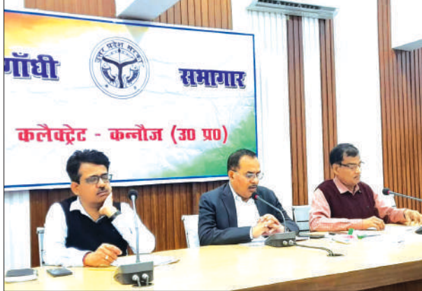
अधिकारियों के साथ बैठक करते जिलाधिकारी

डीएम बोले - कैम्प लगाकर आयुष्मान कार्ड बनाए इस कार्य में लापरवाही न करें कन्नौज, समृद्धि न्यूज़।