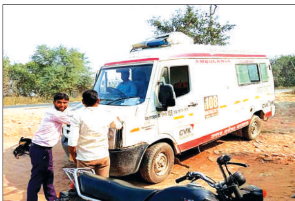
एंबुलेंस में धक्का लगा रहे चाकक व ईएमटी