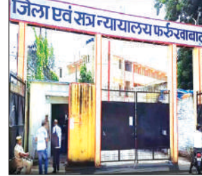
जनपद न्यायालय फर्रुखाबाद