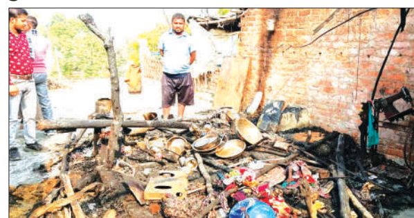
आग के बाद जले पड़े सामान को देखते ग्रामीण

इंद्रगढ़ थाना क्षेत्र के विसैनेपुर्वा गांव में गुरुवार की देर रात एक घर में अचानक आग लग गई। आग लगने से घर में रखा गृहस्थी का साम सामान जल गया। ग्रामीणों ने किसी तरह पानी डालकर आग बुझाई।