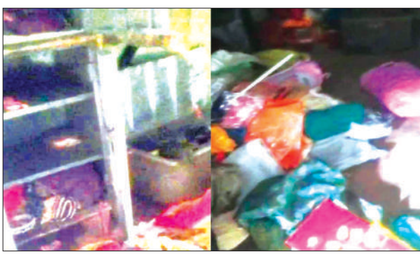
टूटी सेफ व बिचरा पड़ा सामान

चोरों ने एक घर को निशाना बनाते हुए जेवरात किये पार