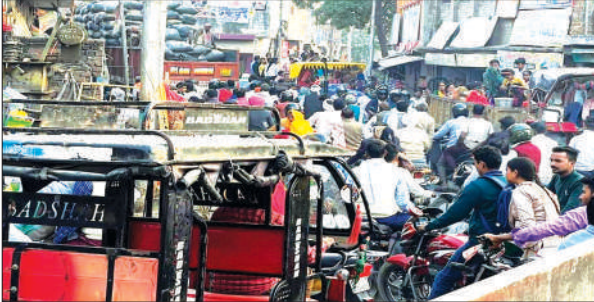
जाम में फंसे वाहन

शमशाबाद नगर की शायद कोई ऐसा मार्ग हो जिस पर जाम जैसे हालात न हो, शायद ही कोई ऐसा फुटपाथ हो, जिस पर अतिक्रमण न हो। अतिक्रमण का दायरा इतना बढ़ गया है कि अब लोगों को अवगमन में भी काफी दिक्कतों का सामना करना पड़ रहा है। अतिक्रमण और जाम की समस्याओं को लेकर आए दिन वाहन फंसे रहते हैं। कभी-कभी तो मरीजों को ले जाने वाली एंबुलेंस भी काफी समय तक जाम में फंसी रहती है जिससे गंभीर मरीजों की