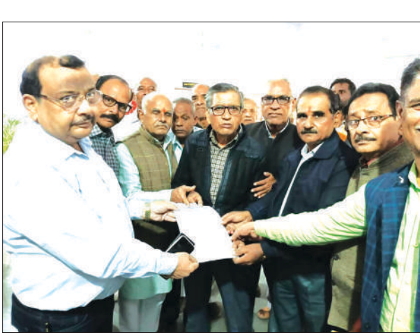
नगर मजिस्ट्रेट को ज्ञापन सौंपते सेवानिवृत्त कर्मचारी

सेवानिवृत्त कर्मचारियों ने धरना देकर मुख्यमंत्री को ज्ञापन भेजा। ज्ञापन में दर्शाया शिकारण की धनराशि की वसूली 10 वर्ष से बंद करने व अधिक वसूली की गई धनराशि को पेंशनर्स के खाते में वापस करने और पेंशनर्स को अवधि के आधार पर पेंशन में बढ़ोतरी