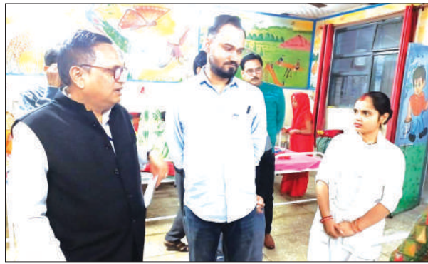
लोहिया का निरीक्षण करते सीएमओ