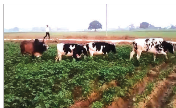
आलू के खेतों में घुसे आवारा जानवरों को भगा रहा किसान

नवाबगंज, समृद्धि न्यूज़। सरकार के आदेश के बाद भी आवारा जानवरों को गोशाला में बंद नहीं किया जा रहा है। जिससे वह किसानों की मेहनत से तैयार की गयीं फसलों को उजाड़कर उन्हें नष्ट कर रहे हैं। जिससे किसानों में रोष है। जानकारी के अनुसार नवाबगंज थाना क्षेत्र की नगर पंचायत क्षेत्र में घूम रहे आवारा गोवंश को अखबार में खबर छपने के बाद भी गोशालाओं में कैद नहीं किया जा रहा है। जिससे वह किसानों की मेहनत से तैयार की गयीं फसलों उजाड़कर नष्ट कर रहे हैं। नगर पंचायत कर्मचारी तथा जिम्मेदार इस और कोई ध्यान नहीं दे रहे हैं। नगर पंचायत क्षेत्र के कस्बा