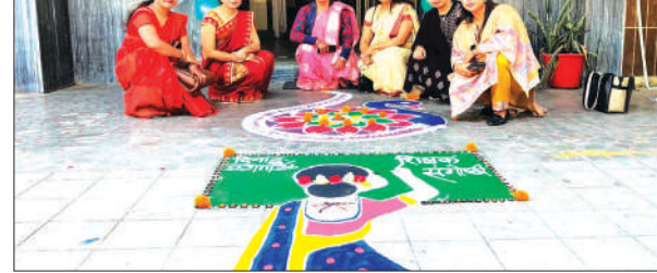
संगोष्ठी के दौरान शिक्षिकाओं द्वारा बनायी गयी रंगोली