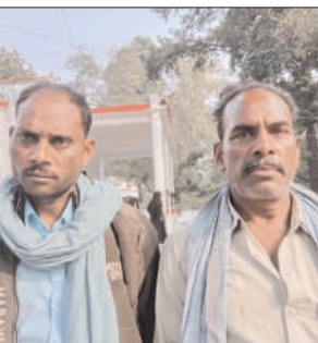
खौंकर चले गए। किसी के द्वारा कोई कार्यवाही नहीं की। ग्रामीण न्याय के लिए पुलिस अधीक्षक कार्यालय में चक्कर लगा रहे हैं। सभी ने एसपी बलरामपुर और बहराइच को शिकायती पत्र देकर जांच के बाद कार्रवाई की मांग की है। न्याय न मिलने पर कलेक्ट्रेट में धरना प्रदर्शन की चेतावनी दी है।

राम गांव थाने की पुलिस के साथ थानाध्यक्ष भी नहीं रोक सके अवैध कब्जा एसपी को शिकायती पत्र देकर कार्रवाई की मांग