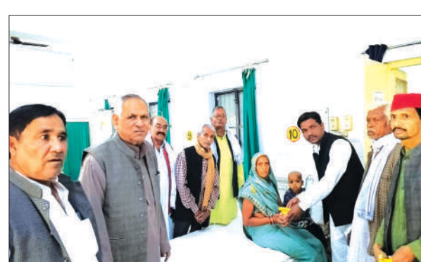
सीएचसी में फल वितरित करते सपाईं।

समाजवादी पार्टी के संस्थापक, पूर्व रक्षा मंत्री एवं पूर्व मुख्यमंत्री मुलायम सिंह यादव की 84वें जयंती सपाइयों ने गांधी स्मारक पर मनाई। पार्टी के पदाधिकारियों व कार्यकर्ता ने उन्हें याद कर श्रद्धा सुमन अर्पित किए।