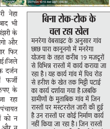
बिना रोक-टोक के चल रहा खेल मन्नेगा ग्रेवसाइट के अनुसार गांव छछ पापा कानूनगो में मन्नेगा योजना के तहत करीब 19 मजदूरों से विभिन्न दर्यों में कार्य कराया जा रहा है।

जिले के विकासखंड झंझरी के ग्राम पंचायत छछ पापा कानूनगो में भ्रष्टाचार का दमक लग गया है जिस मन्नेगा योजना से मोदी सरकार हिन्दुस्तान की तस्वीर बदलने का दावा किया गया, इसकी जमीनी हकीकत आप देखेंगे तो चौंक जाएंगे।