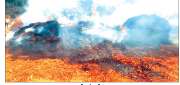
जल रही झोपड़ी व भूसा