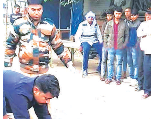
घटनास्थल पर शव को उठाती पुलिस

पुलिस ने शव को कब्जे में लेकर मोचरी भेज दिया। वहीं दूसरी घटना थाना जहानगंज के ग्राम रूनी चुराई के निकट छिब्रामऊ फर्रुखाबाद मार्ग पर घटी। जहां एक कम्पाइन मशीन सड़क किनारे खराब हालत में खड़ी थी। उसी दौरान एक अज्ञात