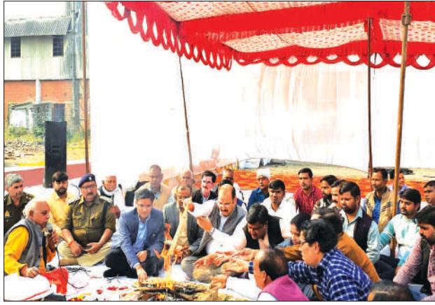
हवन पूजन करते जिलाधिकारी व विधायक व जीएम आदि

▶ पहले गन्ना लेकर आने वाले बैलगाड़ी व ट्रैक्टर चालक को किया सम्मानित कायमगंज, समृद्धि न्यूज़।