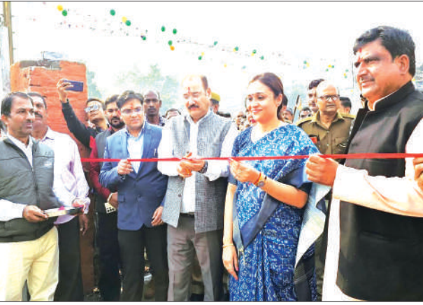
फीता काटकर शुभारंभ करते जिलाधिकारी व मौजूद विधायक, जीएम आदि