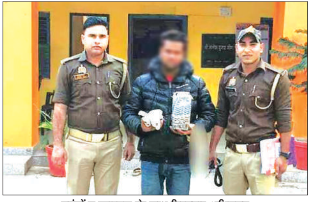
तमंचों व कारतूस के साथ गिरफ्तार अभियुक्त