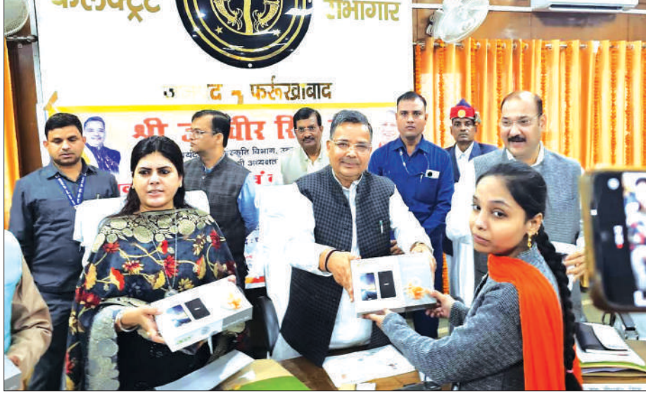
छात्रा को टेबलेट देते मंत्री जयवीर सिंह

▶ गलत रीडिंग निकालने वाले मीटर रीडर्स पर कार्रवाई के दिवस निर्देश ▶ कृषक दुर्घटना योजना के 6 लाभार्थियों को 5-5 लाख की दी सहायता फर्रुखाबाद, समृद्धि न्यूज़।