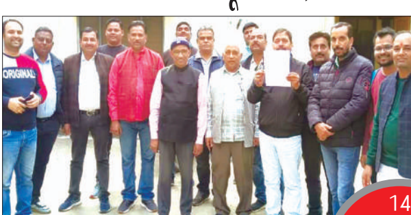
विरोध प्रदर्शन करते ठेकेदार

फर्रुखाबाद ठेकेदार कल्याण समिति ने अपीक्षक अभियंता कन्नौज-फर्रुखाबाद वृत्त लोनिवि कन्नौज को प्रदेश सरकार की दमनकारी नीति के विरोध में 10 दिसम्बर को खुलने वाली निविदाओं का पूर्ण रूप से बहिष्कार कर दिया है और घोषणा की है कि किसी भी टेण्डर प्रक्रिया में भाग नहीं लेंगे। बताते चले कि इससे पूर्व 14 नवम्बर को सभी ठेकेदारों ने पीडब्ल्यूडी प्रांतीय निर्माण खण्ड परिसर में विरोध प्रदर्शन कर मांग पत्र सौंपकर यह कहा था कि जब तक मांग पूरी नहीं होगी, तब तक विरोध प्रदर्शन जारी रहेगा। ठेकेदारों ने कहा कि प्रांतीय खण्ड लोनिवि फतेहगढ़ के