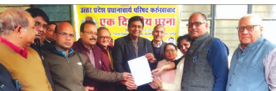
जिला विद्यालय निरीक्षक को ज्ञापन सौंपते प्रधानाचार्य

ज्ञापन में दर्शाया सहायता प्राप्त माध्यमिक विद्यालयों में अद्ययन कार्यात्मक सहायता तदर्थ प्रधानाचार्य जो सरकार से प्रधानाचार्य पद का वेतन पा रहे हैं और योग्यताये पूर्ण है, उनका भी विनियमितकरण किया जाये। साथ ही कार्यवाहक प्रधानाचार्य जो प्रधानाचार्य पद का वेतन नहीं पा रहे हैं, उन्हें समान कार्य समान वेतन के तहत प्रधानाचार्य पद का वेतन अनुमन्य किया जाये। शिक्षा निदेशक की अध्यक्षता में बनी