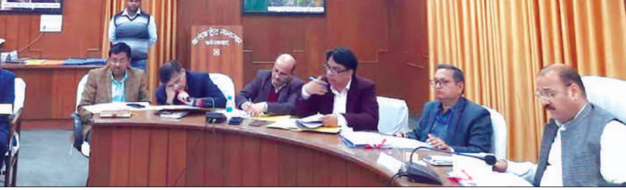
बैठक लेते जिलाधिकारी व मौजूद प्रधानाचार्य आदि

कलेक्ट्रेट सभागार में यूपीपीसीएस परीक्षा की तैयारी बैठक जिलाधिकारी डॉ. वीके सिंह की अध्यक्षता में आयोजित की गयी। जिलाधिकारी ने अनुपस्थित प्रधानाचार्यों से स्पष्टीकरण प्राप्त करने के निर्देश दिये। स्टेटिक मजिस्ट्रेट व केंद्र व्यवस्थापक किसी भी स्थिति में बदले नहीं जायेंगे। इनके मोबाइल सक्रिय रहें। सिस्कोरिटी लॉक इनके द्वारा ही खोला जायेगा। डाटा की सक्रियता हेतु निश्चितता बनाये रखें। परीक्षा 22 तारीख को दो पालियों में होगी। विद्युत जनरेटर चालू हाकत में सभी केंद्रों पर उपलब्ध रहें। सभी पोस्ट आफिस फोटोकॉपी की दुकानें बंद रहेंगी। परीक्षा के प्रभावित न हो। 19 तारीख को कोषागार में अतिरिक्त पुलिस बल उपलब्ध होगा। परीक्षा हेतु पेपर केंद्रों एक घंटे पूर्व ही उपलब्ध