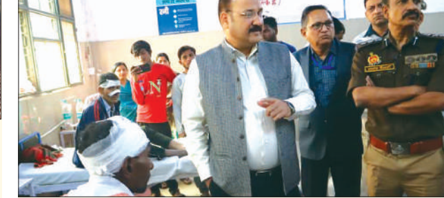
अस्पताल में घायलों के हालचाल लेते डीएम व एसपी

अधिकारियों ने लोहिया पहुंचकर घायलों के लिए हालचाल