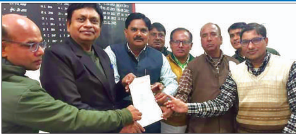
डीआईओएस को ज्ञापन सौंपते शिक्षक संघ एकजुट के पदाधिकारी

नवंबर माह में बस्ती में सम्पन्न हुये प्रांतीय अधिवेशन में पारित 6 प्रस्तावों सेवा सुरक्षा एवं राजकीय करण, पत्रावृत्ति, सिटीजन चार्टर, एनओसी रहित ऑनलाइन सत्यान्तरण, प्रधानाचार्य की भर्ती लिखित परीक्षा एवं साक्षात्कार के आधार पर, वित्त विहीन विद्यालयों को धारा-7(4) से आच्छादित करते हुये वित्त विहीन शिक्षकों की नियमावली बनायी जाये