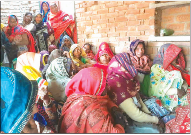
गुमशुम बैठे मृतका के परिजन

▶ मायके पक्ष के लोगों ने पहुंचकर किया हंगामा ▶ जहर देकर हत्या का करने का लगाया आरोप