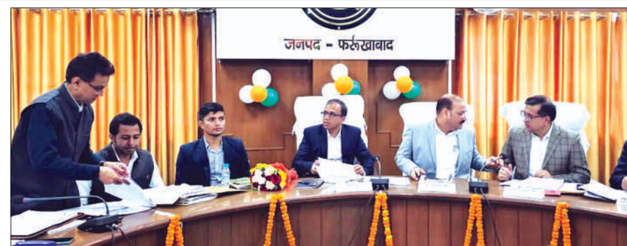
बैठक लेते मण्डलायुक्त मौजूद अधिकारीगण