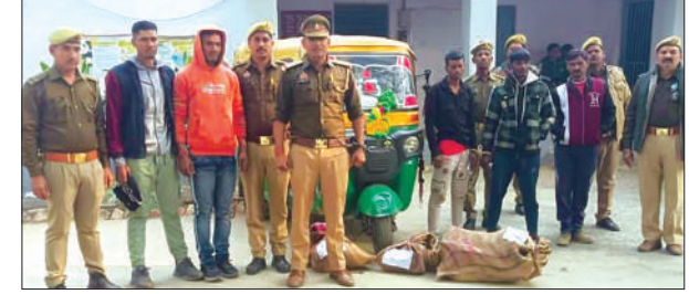
पुलिस हिरासत में चोर व माल