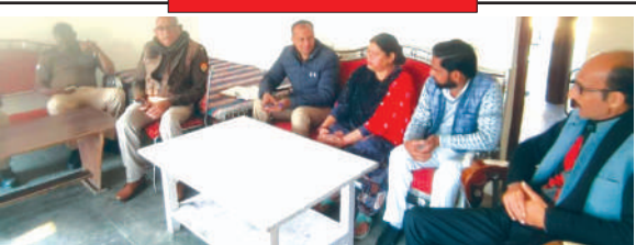
पुलिस की विभागीय में कांग्रेस जिलाध्यक्ष