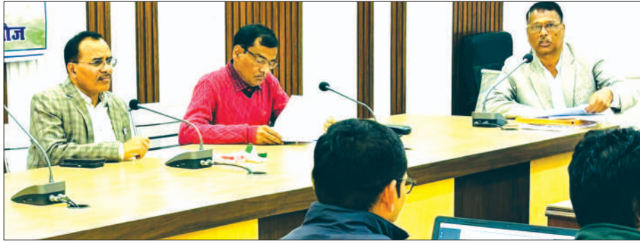
कन्नौज, समृद्धि न्यूज़।