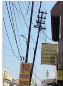
झुका विद्युत पोल

विद्युत विभाग की लापरवाही से कभी भी हादसा हो सकता है। शहर में कुछ जगह विद्युत पोल झुके हुए हैं। जिस कारण कभी भी हादसा हो सकता है। फतेहगढ़ कानपुर रोड सूरज अल्ट्रासाउंड के पास विद्युत विभाग की लापरवाही से पोल झुक गया है। बंच केबिल का लोड व झूलते तारों के चलते झुका हुआ पोल हादसे को दावत दे रहा है। इस संबंध में कई बार जेई को सूचना दी गई और उसके बाद भी विद्युत पोल बदला नहीं गया है। पास में बनी बिल्डिंग में झुके पोल होने के कारण करंट दौड़ने की संभावना है। ऐसे में विद्युत विभाग की लापरवाही से हादसा होने की