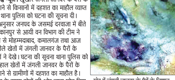
खेत में जंगली जानवर के पैरों के निशान

नवाबगंज, समृद्धि न्यूज़। खूबसूरत जंगली जानवर के पैरों के निशान देखे जाने से किसानों में दहशत का माहौल व्याप्त है। ग्रामीणों ने थाना पुलिस को घटना की सूचना दी। जानकारी के अनुसार जनपद के जसमई दरवाजा में बीते दिन तेंदुए को कानपुर से आयी वन विभाग की टीम ने पकड़ा था। तब से मोहम्मदबाद, कमालगंज तथा आज नवाबगंज में गीले खेतों में जंगली जानवर के पैरों के निशान ग्रामीणों ने देखे। घटना की सूचना थाना पुलिस को दी गयी। फिलहाल खेतों में जंगली जानवर के पैरों के निशान देखे जाने से ग्रामीणों में दहशत का माहौल है। ग्रामीणों ने शाम के समय खेतों की ओर जाना छोड़ दिया है। ग्रामीणों को बाहर नहीं निकलने दे रहे हैं। ग्रामीणों ने जंगली जानवर को पकड़वाये जाने की मांग जिला प्रशासन व वन विभाग से की है।