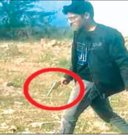
तमंचा लेकर जा रहा युवक

तमंचा लेकर घूम रहे युवक को टोकने पर उसने अपने साथी पर फिल्मी स्टाइल में फायर कर दिया। गोली लगने से वह घायल हो गया। इस घटना का वीडियो सोशल मीडिया पर वायरल हो रहा है, लेकिन पुलिस ने अभी तक कोई कार्यवाही नहीं की। जानकारी के अनुसार कोतवाली फतेहगढ़ के क्षेत्र पुलिस लाइन के निकट एक मैदान में एक युवक फिल्मी स्टाइल में तमंचा लेकर घूमते देखा गया, कुछ लोग बता रहे हैं कि वह रील बना रहा था। वहां कुछ बच्चे मैच खेल रहे थे, जब उसके साथियों ने