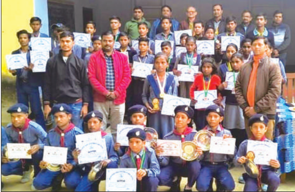
नेशन व प्रशस्ति पत्र के साथ विजेता छात्र-छात्राएँ