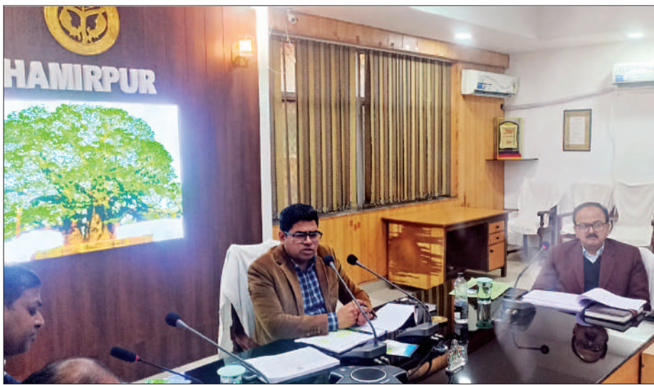
कर विभाग एवं पंचायत विभाग आबकारी विभाग परिवहन विभाग वन विभाग खनन विभाग विद्युत विभाग एमंडी समिति नगरीय निकायों की वसूली की समीक्षा की तथा लक्ष्य के सापेक्ष वसूली को प्राप्त करने के

▶ पांच वर्ष से अधिक पुराने वादों का शत प्रतिशत निस्तारण के लिए आदेश हमीरपुर, समृद्धि न्यूज़।