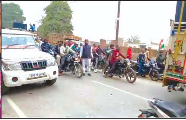
बाइक रैली निकालते पदाधिकारी

बाइक रैली सलेमपुर उमरपुर से शुभारंभ होकर कस्बा नवाबगंज होते हुए जसमई के लिए रवाना हुई। जिसमें सभी पदाधिकारी डीजे की धुन पर बाइक रैली में शामिल हुए।