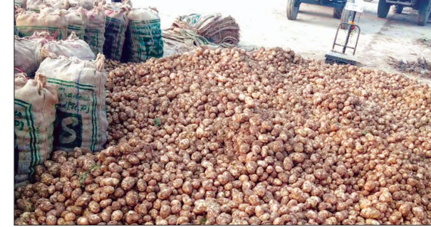
मण्डी में लगे आलू का ढेर