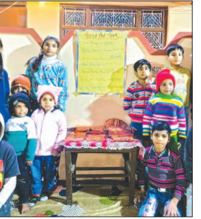
प्रतियोगिताओं के दौरान बच्चे