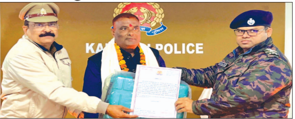
सेवानिवृत्त पुलिसकर्मियों को प्रमाण पत्र, ट्राली बेग भेंट करते एसपी