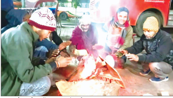
बस स्टैण्ड परिसर में अलाव तापते छात्री

लोग अपने संसाधनों से अलाव जलाकर सर्दी का बचाव कर रहे हैं। जबकि बस अड्डा, रेलवे स्टेशन के बाहर व पुलिस पिकेटों पर लोग ठिठुरते नजर आये। उनका कहना था कि नगर पालिका की ओर से अभी तक अलाव नहीं जलवाये गये हैं। नगर के गिने