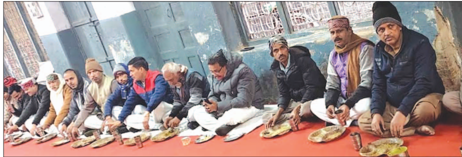
फर्रुखाबाद, समृद्धि न्यूज़।