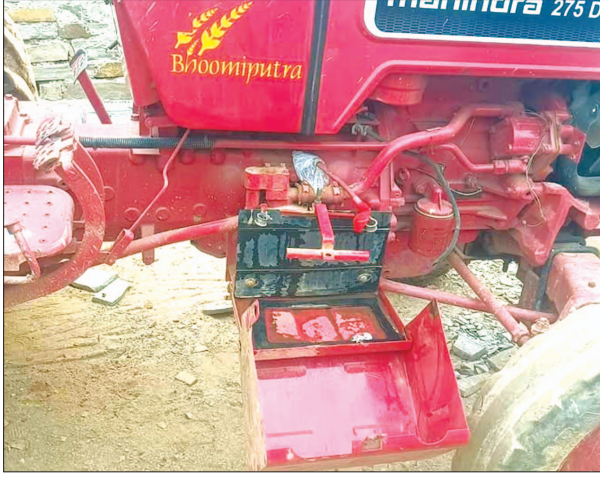
चोरों द्वारा ट्रैक्टर से चोरी की गयी बैटरी

सभी लोग राजशायों के अंदर सो रहे थे। घटनाक्रम के अनुसार बताया गया