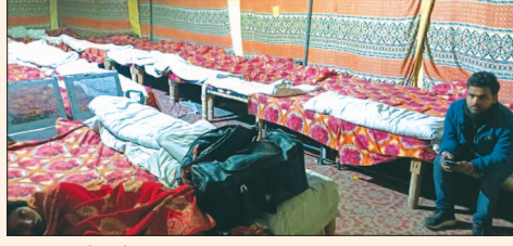
रैन बसेरा में पसरा सज्जात

सर्दी के चलते रैन बसेरों में व्यवस्था तो चाक चौबंद है, लेकिन कोई ठहरने वाला दिखायी नहीं दे रहा है। क्योंकि सर्दी के चलते लोग कम ही घरों से बाहर निकल रहे हैं। वहीं बसों में भी लोग यात्रा कम कर रहे हैं। सिर्फ जरूरतमंद लोग ही बसों में यात्रा कर रहे हैं। लोगों का कहना है कि सर्दी में जो आराम घर में है, वह बाहर नहीं। रैन बसेरा संचालक ने बताया कि हमारी व्यवस्था पूरी तरह से चाक चौबंद है। कोई भी अव्यवस्था नहीं है। जो कोई आयोग उसका स्वागत है। बताते चलें कि बीते दिनों अधिकारियों ने रैन बसेरा का निरीक्षण किया था और व्यवस्था चाक चौबंद रखने के निर्देश दिये थे।