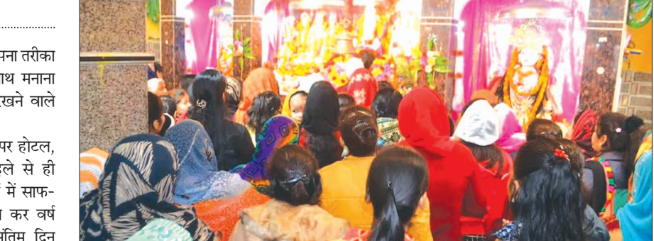
मंदिर में पूजा अर्चना करते भक्तगण

जहां एक तरफ नव वर्ष के आगमन पर होटल, रेस्टोरेंट सजाये गये हैं। कुछ जगह पहले से ही बुकिंग की गई। वहीं भक्तों ने भी मंदिरों में साफ-साफ व साज सज्जा कर पूजा अर्चना कर वर्ष 2025 का स्वागत किया। वर्ष के अंतिम दिन महाबली हनुमान जी का दिन मंगलवार होने के चलते मंदिरों में पूरे दिन रामधुन बजती रही तो वहीं भक्तों ने भी अपने-अपने तरीके से प्रभु श्रीराम जानकी की आराधना कर हनुमान जी का पूजन किया। फतेहगढ़ के भोलेपुर स्थित सिद्ध हनुमान जी के मंदिर में हजारों की संख्या में भक्तों की भीड़ देखी गई। सुबह से ही पूजन पाठ का आयोजन