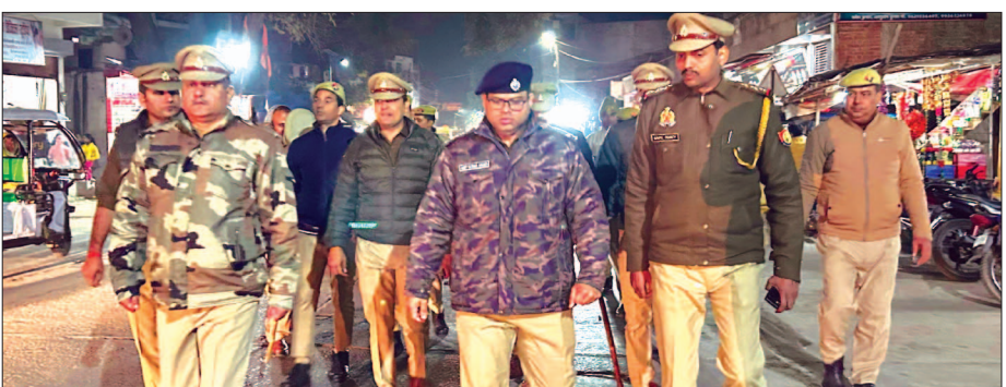
कन्नौज, समृद्धि न्यूज।