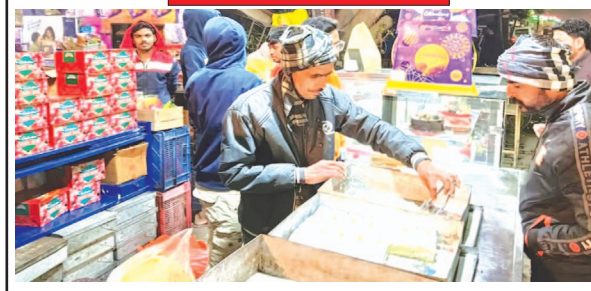
छावड़ा बेकरी पर केक खरीदते ग्राहक

को सर्दी से बचाव करना चाहिए, अन्यथा उन्हें जोखिम उठाना पड़ सकता है। वहीं बच्चों में सर्दी के चलते जुकाम, खांसी आदि ज्यादा हो रहा है।