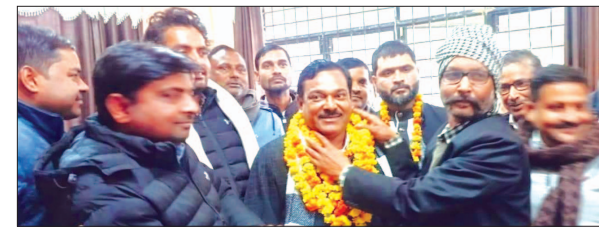
नवनिर्वाचित पदाधिकारियों का माला पहनाते अधिवक्ता