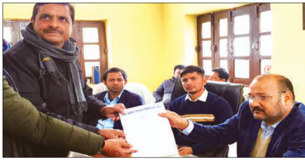
डीएम को ज्ञापन सौंपते लेखपाल

लेखपाल के पास ही आते हैं। दो पक्षों के विवाद के निस्तारण सम्बन्धी की गयी, कार्यवाही से किसी एक पक्ष का असंतुष्ट होना स्वाभाविक है। कुछ लोग काम मनमाना न होने से लेखपाल से दुश्मनी ठान लेते हैं और लेखपाल को क्षेत्र की राजनीति में घसीटने का भी प्रयास किया जाता है। इस प्रकार विधि