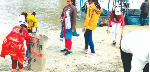
स्वच्छता अभियान चलाते गंगा सेवक