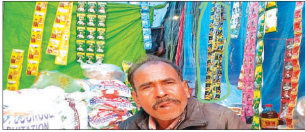
मेले में पान मसाला व गुटखा की बिक्री करता दुकानदार