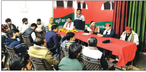
बैठक में मौजूद सपा नेता