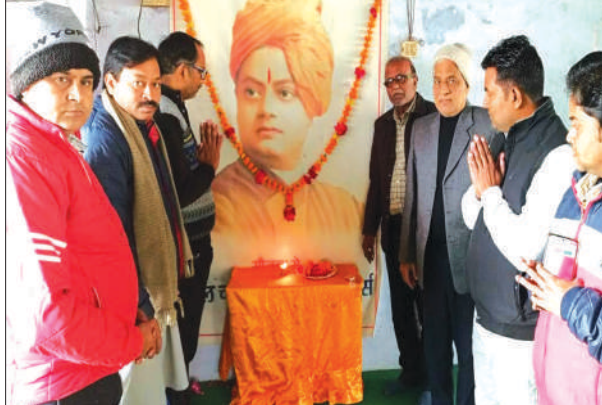
स्वामी विवेकानंद को नमन करते लोग।