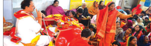
कथा का रसगान करती महिलाएँ