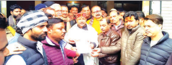
सांसद मुकेश राजपूत को ज्ञापन सौंपते व्यापारी