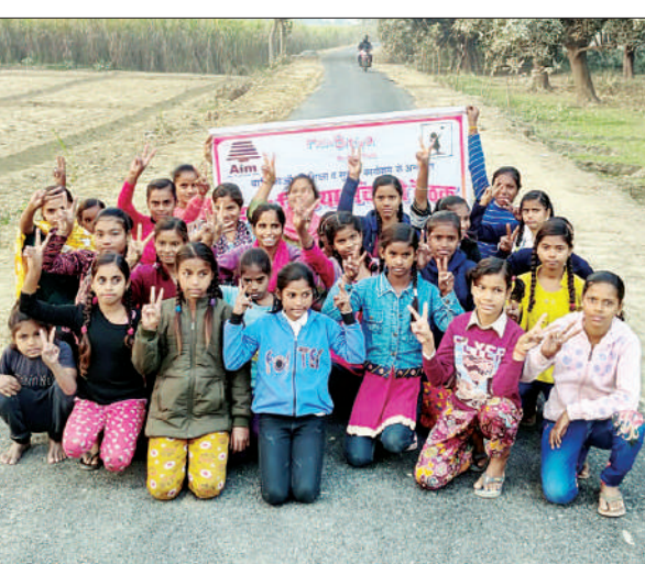
एक साथ क्षेत्र की बहुत बड़ी समस्या स्कूली बच्चों, मोतीपुर जिला अस्पताल जाने वाले मरीज तथा

असुरक्षित समझते हुए उसे रास्ते से शाम के समय निकलना मुनासिब नहीं समझते थे। यह रास्ता क्षेत्र के दर्जनों गाँवों से होता हुआ ओयल के मोतीपुर स्थित जिला अस्पताल को भी जाता है। स्कूली छात्राएँ उस रास्ते से स्कूल जाना पसंद नहीं करते थे। क्योंकि इधर-उधर सड़क के किनारे झाड़ियाँ और पतली ने उस रास्ते को बहुत सकरा कर दिया था। इसलिए यह बहुत ही खतरनाक रास्तों में शुमार किया जाता था। एक दिन की बात है जब टीकर पुरवा (मुराउन पुरवा) व टीकर के हेलो बिटिया मंच के साथ टीकर में बैठक हो रही थी। बैठक में परिचय समापन के बाद समस्याओं पर चर्चा करने की बात आई तो बैठक में उपस्थित सभी किशोरियों ने