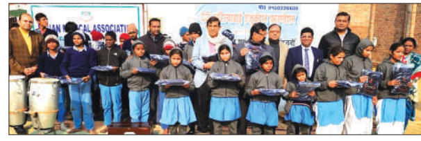
गर्म कपड़े वितरित करते आईएमए के पदाधिकारी

फर्रुखाबाद, समृद्धि न्यूज़। आईएमए फाउंडेशन द्वारा देवी अहिल्याबाई एजुकेशन फाउंडेशन में मानसिक एवं नेत्रहीन विद्यार्थियों को स्कूल ड्रेस व गर्म कपड़े एवं मिठाई वितरित की गईं। बच्चे गर्म कपड़े व स्वेटर पाकर खुश हुए और चेहरे खिल उठे।