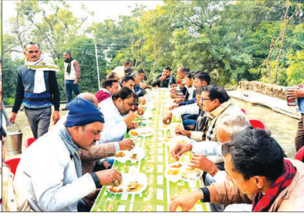
दाल बाटी का आनन्द लेते कार्यकर्ता