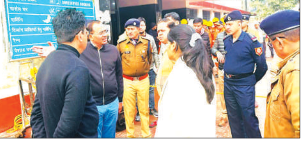
निरीक्षण करते जिलाधिकारी सहित अन्य अधिकारियों