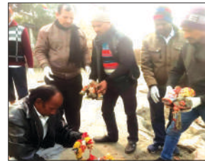
घाट पर साफ-साफ रखते छात्रिकाएँ के लोग