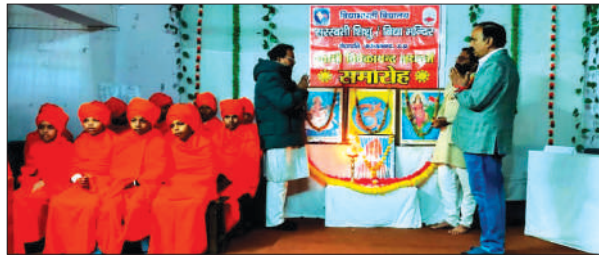
विवेकानंद जयंती कार्यक्रम में मौजूद आचार्यगण