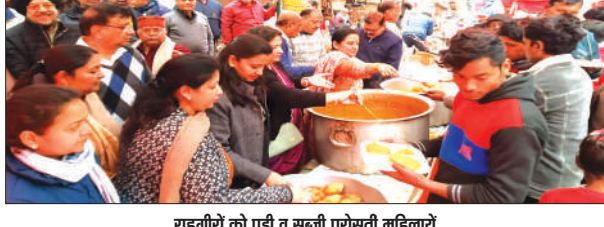
राहगीरों को पूड़ी व सब्जी परोसती महिलाएँ