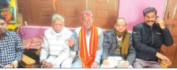
परिचर्चा के दौरान मौजूद वक्तागण