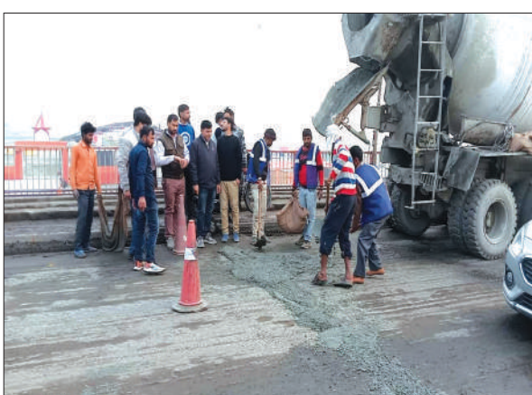
पुल की मरम्मत का कार्य करते पीडब्ल्यू की कर्मचारी

जानकारी के अनुसार मिनी कुम्भ के नाम से मशहूर मेला रामनगरिया का आज उद्घाटन होना है। जिसके चलते तैयारियां चाक चौबंद की जा रही हैं। मेला उद्घाटन के समय कोई खामी न रहे। इसको ध्यान में रखते हुए रविवार को पांचाल घाट पुल की मरम्मत का कार्य किया गया। बताते चलें कि बीते दिन एनएचआई के अधिकारियों ने पुल का निरीक्षण किया था और शीघ्र ही पुल की मरम्मत कराने का भरोसा दिया था। पुल जोड़ों पर क्षतिग्रस्त हो गया था और उसमें काफी चौड़ी दरारें पड़ गयी थीं। जिससे चार बाइक चालकों को काफी दिक्कतों का सामना करना पड़ रहा था। आज उन दरारों को भरने का काम