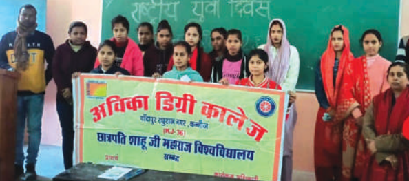
कार्यक्रम के दौरान मौजूद शिक्षक व छात्र-छात्राएं।