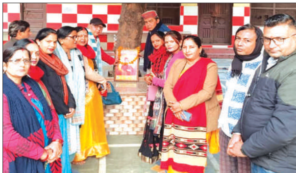
स्वामी विवेकानंद की जयंती मनाते लोग

लगने वाले कैंप कार्यालय में आयोजित होने वाले कार्यक्रमों के