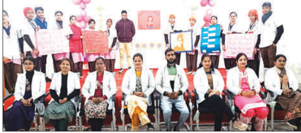
पोस्टर प्रतियोगिता में भाग लेते गर्लिंग विद्यार्थी