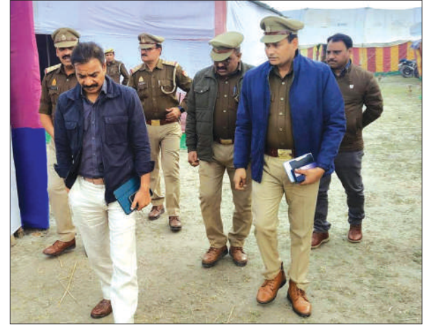
मेला रामनगरिया का निरीक्षण करते पुलिस अधीक्षक