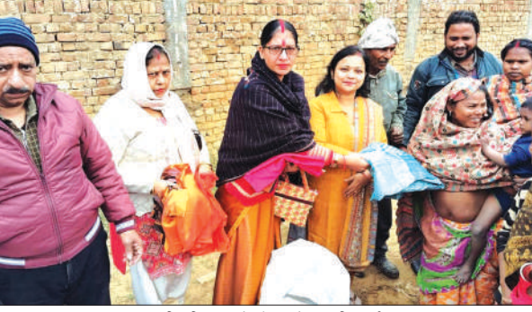
वस्त्र वितरित करते संस्था के पदाधिकारी