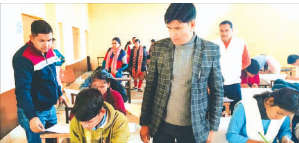
प्रतियोगिता में भाग लेते विद्यार्थी

विद्यालयों से छात्र-छात्राएँ जिनका चयन विद्यालय स्तर पर प्रथम, द्वितीय तथा तृतीय पुरस्कार हेतु चयन किया गया। जनपद के माध्यमिक विद्यालयों के भाषण प्रतियोगिता में 24, क्रिज प्रतियोगिता में 23 तथा पोस्टर प्रतियोगिता में 34 छात्र छात्राओं ने प्रतिभाग किया। प्रतियोगिता का उद्घाटन सहायक सभागीय परिवहन अधिकारी