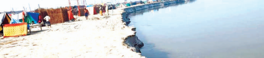
गंगा में हो रहा कटान का दृश्य

ढाईघाट शमशाबाद जहां माघ का महीना आरंभ होते ही रामनगरिया का मेला सजने लगा था। आजकल मेला सबाब पर है। चारों ओर कल्पवासियों साधु संतों के टेंट सजे हुए हैं। साधु संत गंगा मैया की पवित्र जलधारा में गोते लगाकर भगवान के गुणों का गुणगान कर रहे हैं। हर तरफ चकाचौंध का माहौल है। मेले की सजावट देखते ही बन रही थी। कहावत है ज्यादा खुशियां कभी-कभी मुश्किलों का कारण बनने लगती हैं। जो हां आजकल ढाईघाट शमशाबाद की पवित्र गंगा नदी जहां बसी रामनगरिया में कल्पवास करने वाले कल्पवासियों साथ कुछ अलग होता नजर आ रहा