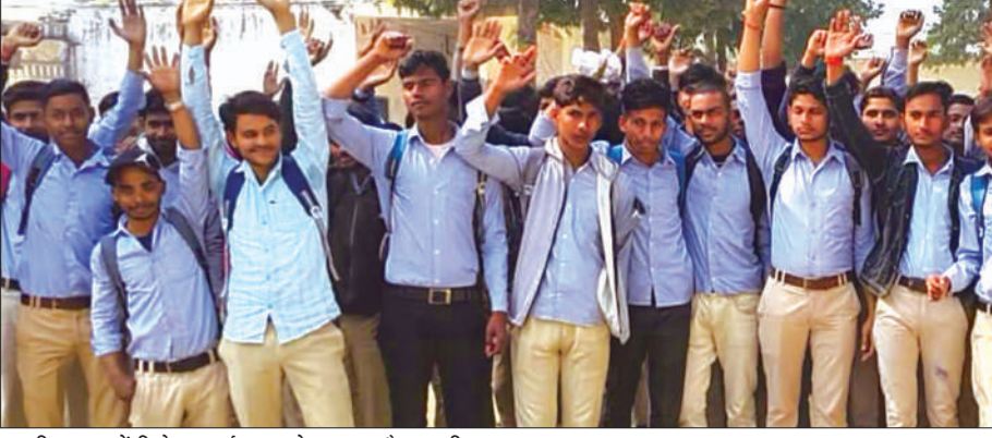
विद्यालय में विरोध प्रदर्शन करते छात्र व मौजूद पुलिस

इंटर मीडिएट की बोर्ड परीक्षा से पहले प्रयोगात्मक परीक्षा के नाम पर छात्रों से वसूली को लेकर विरोध हो गया। छात्रों ने विद्यालय परिसर में विरोध प्रदर्शन करते हुए नाराजगी जाहिर की और आर्थिक स्थिति का हवाला देते हुए पैसे देने में असमर्थता जताई। सूचना पर पुलिस भी मौके पर पहुंची और छात्रों व अध्यापकों से बात कर मामला शांत कराया। नगर के ऋषि भूमि इंटर कालेज में इंटर मीडिएट की बोर्ड परीक्षा से पहले