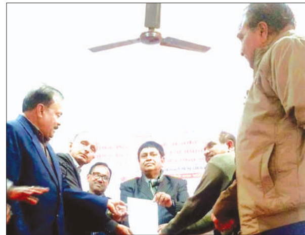
डीआईओएस को ज्ञापन सौंपते प्रधानाचार्य

जिन छात्रों का डाटा मिसपेच है उनमें समस्या आ रही है, उन्हें भी ठीक कराया जा रहा है। ऐसे में माध्यमिक विद्यालय के वेतन बिल स्वीकार कर भुगतान समय पर किया जाये। जो विद्यालय कुछ कारणवश आधार आइडी फीड करने में पिछड़े गये है उन विद्यालयों का वेतन न रोका जाये। उनके भी विद्यालय आधार