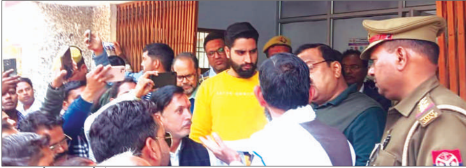
ज्ञापन देते ठगी पीड़ित परिवार के लोग

ठगी पीड़ित जमाकर्ता परिवार ने जिलाधिकारी को ज्ञापन सौंपा। दिये गये ज्ञापन में कहा गया कि जनपद में अनियमित जमा योजनाएं पाबंदी अधिनियम 2019 और उत्तर प्रदेश के जमाकर्ता हित संरक्षण अधिनियम 2016 का उल्लंघन करके विभिन्न कम्पनी एवं क्रेडिट कॉर्पोरेशन से सासाइटी बैंगर पॉजी स्कीम चला रही थीं। जिन्हें भारत सरकार एवं राज्य सरकार ने प्रतिबंधित कर दिया था और