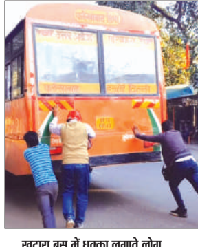
खटारा बस में धक्का लगाते लोग

रोडवेज विभाग में कई बसें खटारा हो गयी हैं, तो कई बसों में से बैटरी खराब है। सड़क पर अचानक रोडवेज बसें बंद हो जाती हैं। जहां एक तरफ जाम की समस्या का कारण बनती है तो वहीं सवारियों को ही अपना पसीना बहाना पड़ता है। बस को स्टार्ट कराने के लिए सवारियों को भी धक्का लगाया पड़ता है। तब जाकर वह स्टार्ट होती है।