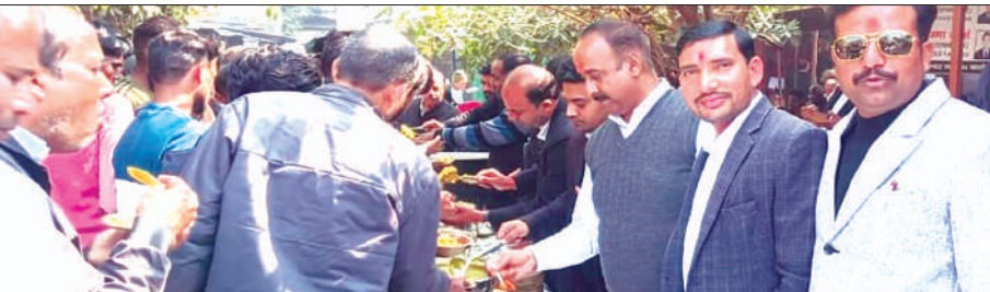
फर्रुखाबाद, समृद्धि न्यूज़।