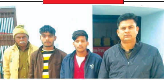
पुलिस हिरासत में अभियुक्तगण