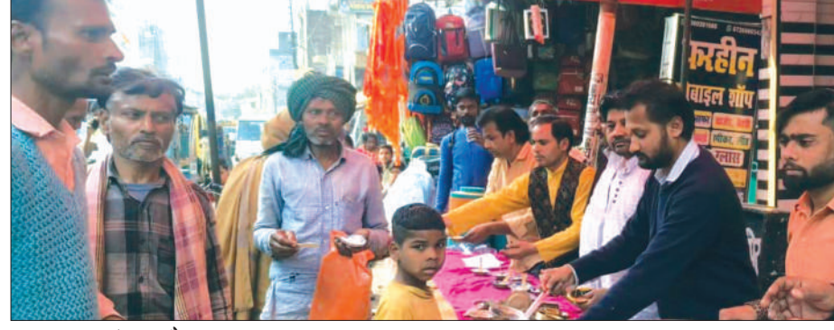
गुरसहायगंज कन्नौज, समृद्धि न्यूज़।

जीटी रोड पर प्रसाद वितरित करते श्रद्धालु।