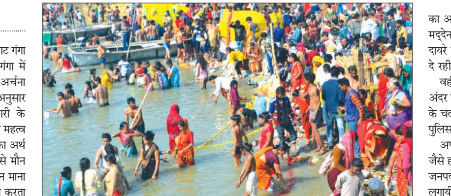
गंगा स्नान करते भक्तगण

मौनी अमावस्या पर भक्तों ने पांचाल घाट गंगा तट पर पहुंचकर हर-हर गंगे के बीच गंगा में डुबकी लगायी और गंगा तट पर पूजा अर्चना की। कई भक्तों ने अपनी सामर्थ्य के अनुसार पुण्ड्रिका को दान दक्षिण दी। जानकारी के अनुसार मौनी अमावस्या पर स्नान दान का महत्व बहुत अधिक माना जाता है। मौनी शब्द का अर्थ है मौन यानी चुप रहने से संबंधित है। इसे मौन रहने और आत्मचिंतन के लिए विशेष दिन माना जाता है। मौन रहने से व्यक्ति आत्मचिंतन करता है और अपने अंतर्मन की शांति प्राप्त करता है। इस साल मौनी अमावस्या पर त्रिवेणी योग का शुभ संयोग बन रहा है। त्रिवेणी योग को सुख