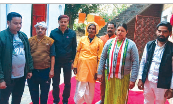
मृतकों को श्रद्धांजलि देते कांग्रेसी

रखकर मृतकों की आत्मा की शांति के लिए ईश्वर से प्रार्थना की। साथ ही घायल श्रद्धालुओं के जल्द से जल्द स्वस्थ होने की भगवान से प्रार्थना की। कांग्रेस का आग्रह है कि प्रशासन की लापरवाही के चलते घटना घटित हुई