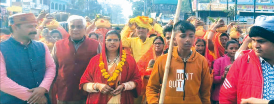
नगर में कलश रात्रा निकालते श्रद्धालु।

▶ रात्रा के बाद नव दिवसीय श्री राम कथा का शुभारंभ ▶ महिला पुरुष भक्तों ने मंदिरों में की पूजा अर्चना