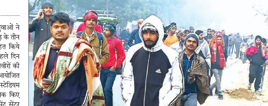
भर्ती देखने जाते युवा

अग्निवीर भर्ती प्रक्रिया के पहले दिन युवाओं ने अपना दमखम दिखाया। इस दौरान फतेहगढ़ के तीन स्कूल अग्निवीरों के रुकने के लिए चिंतित किये गये। जानकारी के अनुसार बुधवार को पहले दिन अग्निवीर भर्ती प्रक्रिया शुरू की गयी। अग्निवीरों की भर्ती सैनिक भर्ती बोर्ड अरली की तरफ से आयोजित की जा रही है। स्व० ब्रह्मदत्त द्विवेदी स्टेडियम फतेहगढ़ में युवाओं के डॉक्यूमेंट चेक चेक किए गए। इसके बाद युवाओं को राजपूत रेजीमेंट सेंटर के करिअथ्या प्लाउंड पर भेज दिया गया। जहां युवाओं ने रनिंग ट्रैक पर दौड़ लगाकर अपना दम कम दिखाया। फतेहगढ़ के अधिग्रहित किये गए तीन स्कूलों में अग्निवीर भर्ती देखने आए युवाओं के